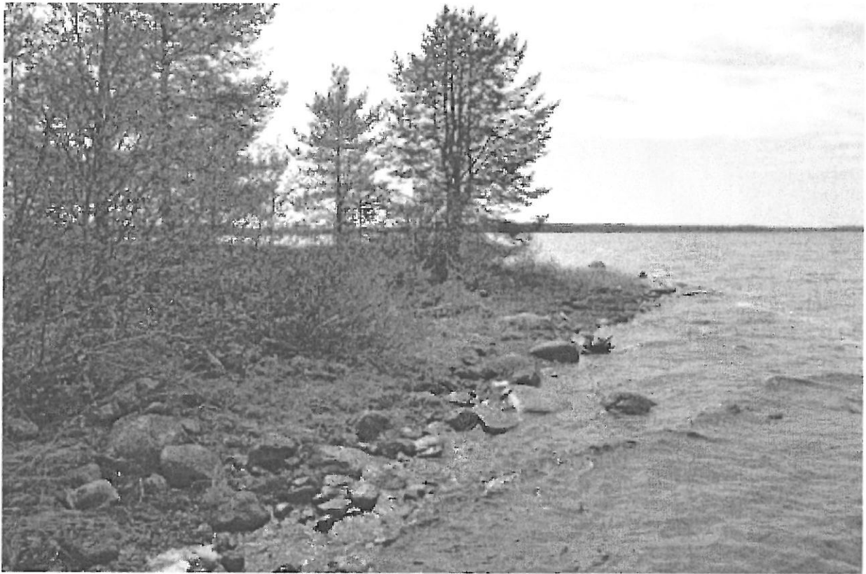
Kuva 3. Selkäsaari 2. Saaren länsipään pohjoisrantaa, jonka rantavedestä löytyi kvartsi-iskoksia. NE. KaiM 7589:4.