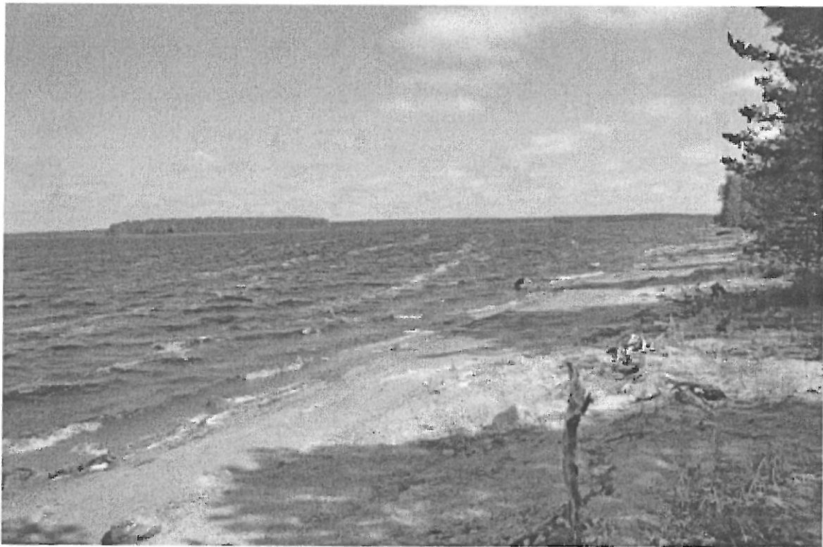
Kuva 2. Selkäsaari (1). Kvartsialueen länsipää, vasemmalla Pärsämönsaari. SW. KaiM 7589:3.