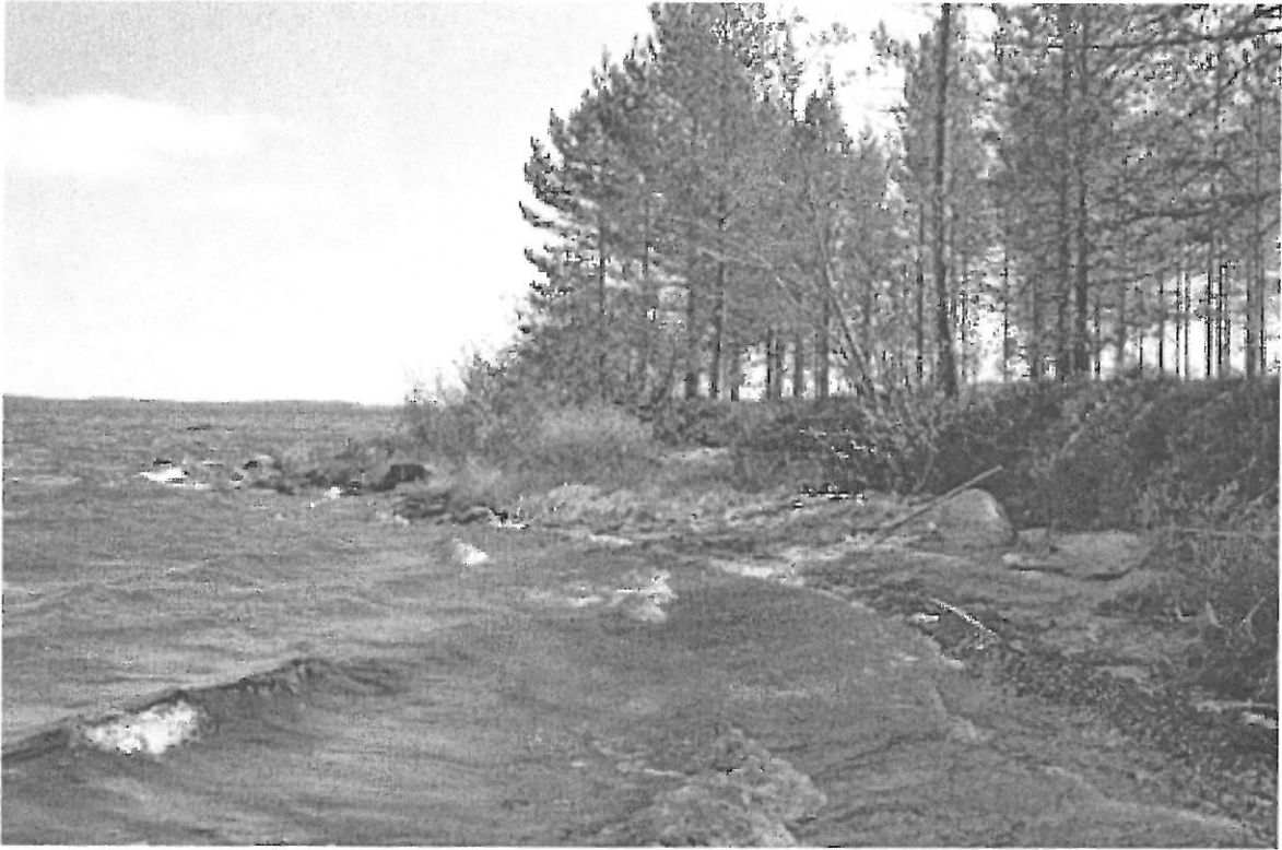
Kuva 5. Selkäsaari 3. Lahdelma pohjoisrannan länsipäässä. Siitä löytyi hieman kvartsi-iskokia. NW. KaiM 7589:6