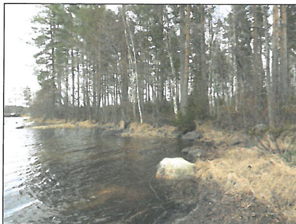
Tutkimusalueen eteläosan niemi luoteesta.

Tutkimusalue rajattu vihreällä viivalla. Sen eteläpuolella Riitniemen (844010025) kivikautinen asuinpaikka ja länsipuolella saarella Hynnisenosaaren (844010006) kivikautinen asuinpaikka.