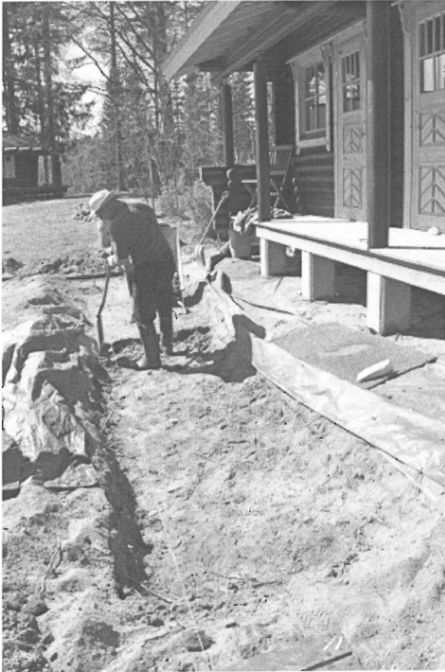
Pentti Turunen kaivaa aitan edustaa. KaiM 7502:4.