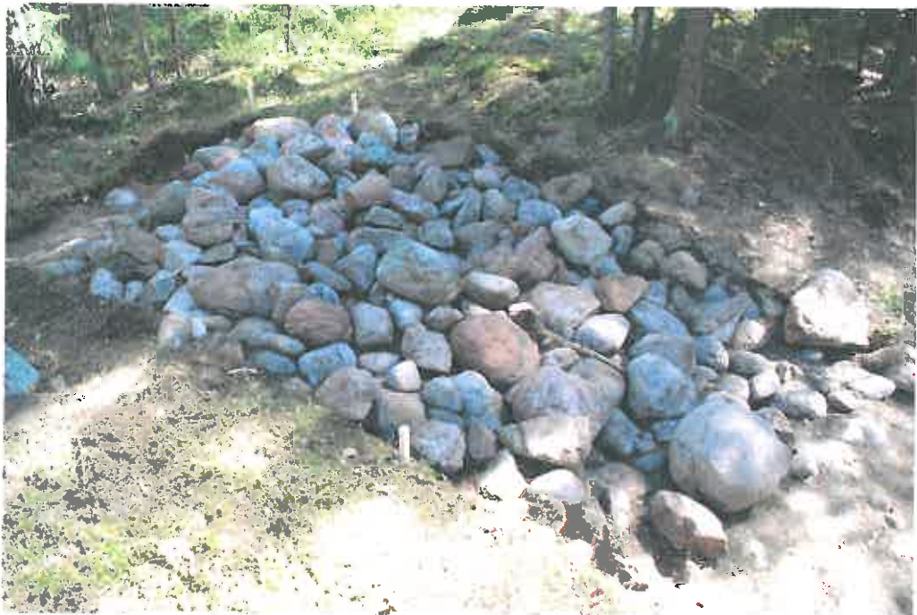
Bild 2. Provschakt 4, stenkonstruktionen blottad, från väster (TYA 16:14).