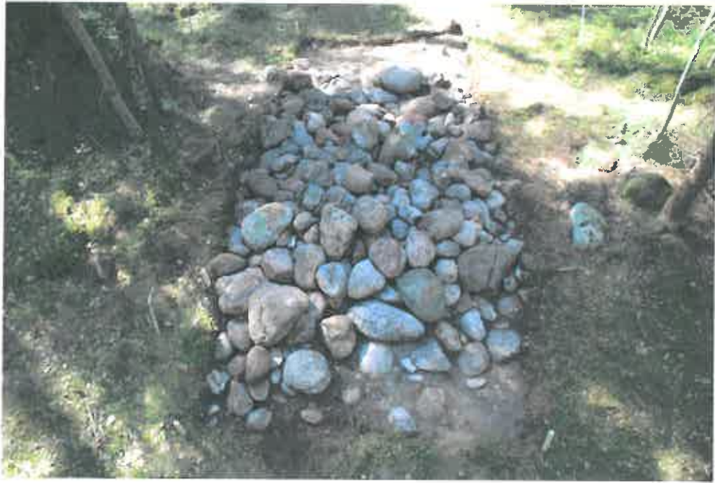
Bild 1. Provschakt 4, stenkonstruktionen blottad, från nordost (TYA 16:13).