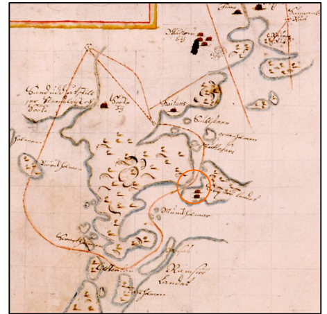
Svinön tilat näkyvät v. 1689 metsäkartassa.

Vuoden 1571 hopeaveroluettelon tietojen mukaan Svinön talot olivat Espoon pitäjän vauraimpien joukoissa 2 . Syynä on voinut olla saaristolaistalonpoikien kauppapurjehdus Tallinnaan. Tilanne muuttui 1600-luvun alussa, kun Svinön tilat merkitään maakirjoissa autioiksi ja isännät köyhiksi. Svinön köyhtyneistä tiloista tuli ensin kruunutiloja 1638, ja sittemmin, vuonna 1641, kruunu antoi ne Gustav Hornille, jolle Espoon kartano oli tähän aikaan läänitetty. Svinön tilat jäivät Espoon kartanon alaisuuteen 1800-luvun alkupuolelle saakka. 3