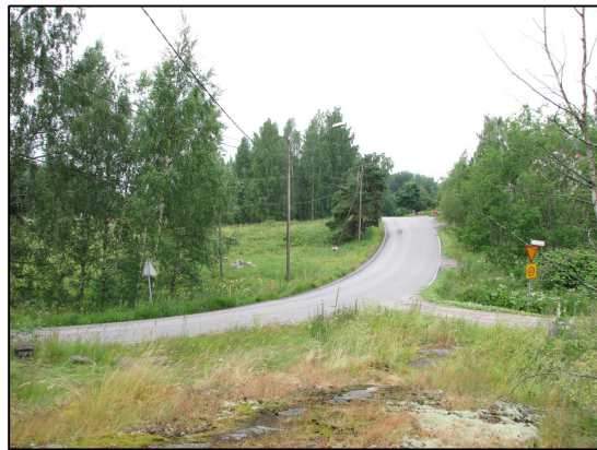
Suvisaarentien mutka 1960-luvulla ja kesällä 2009. 1960-luvun kuvassa näkyy taustalla Stor-Svinön rakennuskanta, joka nykyään on purettu.