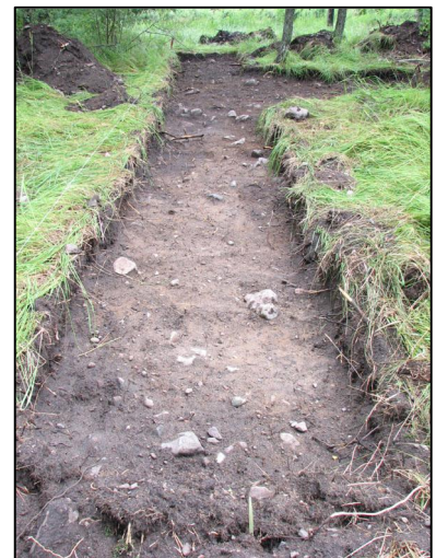
Alue 1 etelästä

Kaivaus aloitettiin avaamalla koeoja (Alue 1) Suinonmäen tien suuntaisesti alueen länsiosassa. Koeojasta ei löytynyt vanhempaan asutukseen viittaavaa. Peltokerroksen alta tuli vastaan puhdas pohjamaa, ainoana poikkeuksena Y1-1 joka löytöjen perusteella (esim. patruunan hylsy) voitiin tulkita moderniksi kuopaksi.