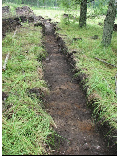
Alue 2. Vasemmalla pohjoispäädyn läikät, jossa havaittiin palanutta savea, oikealla koejan keskiosa, jossa ei ollut säilyneitä kulttuurikerroksia peltomullan alla.