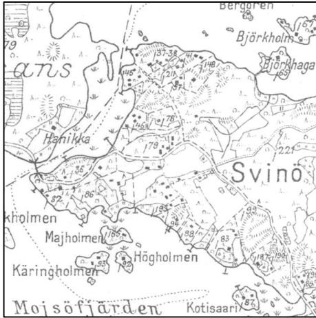
Svinö.v. 1930 kartassa.