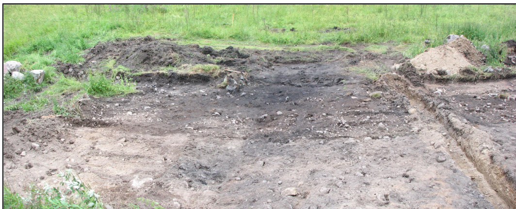
Palokerros Y 3-3.

Alue 1:n keskivaiheelta avattiin n. 2 metriä leveä koejoja, joka puuston vähentyessä levennettiin n. 4-5 metriseksi. Alueen suunta seurasi tulevan kevyen liikenteen väylän maastoon merkittyä linjausta. Päällimmäisenä kerroksena oli koko alueella sekoittunut pintamultakerros Y3-0. Alueen länsi- ja itäpäädyissä sen alta tuli puhdas pohjamaa Y3-4, mutta keskiosassa mullan- ja hiekkansekainen kerros Y3-1, joka löytöjen perusteella ajoittui 1800-luvulle. Tämän kerroksen sisällä sijaitsi myös syvemmälle menevä, jätekuopaksi tulkittu KU 3-2, joka oli täytetty Y3-1:llä. Kerrosta Y 3-4 ei poistettu, mutta koekuoppien avulla varmistettiin että kyseisen kerroksen alta tuli vastaan ainoastaan puhdas pohjamaa tai peruskallio. Alue 3:n itäpäädyssä tuli vastaan vahvasti nokinen ja selkeästi palanut Y3-3. Tämäkin kerros, joka voisi olla peräisin esim. palaneesta ladosta, ajoittui 1800-luvulle tai nuoremmaksi. Sen alta tuli vastaan Y3-4.