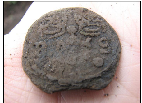
Kuningatar Kristiinan kupariraha (1622–1644)

Keramiikkapala luettelointiin Kansallismuseon historiallisiin kokoelmiin numerolla KM 2010024:1 ja rahat Kansallismuseon rahakammion kokoelmiin.