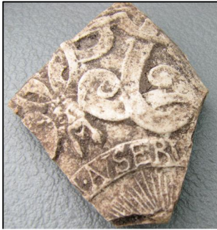
Svinön kaivauksilla löydetty saksalainen kivsavikeramiikka 1500-luvulta

Svinön löytöaineistossa oli mukana paljon 1800-1900-luvun talousjätettä, jota ei otettu talteen. Tästä sekoittuneesta ja suhteellisen modernista kerroksesta löytyi kuitenkin yksi sirpale kivsavikeramiikkaa (puhdistuskerroksesta alue 3:n keskivaiheilta), joka sinällään viittaa siihen että kaivausalue sijaitsi vanhemman asutuksen läheisyydessä. Kyseinen pala oli 1500-luvun lopulla Reininmaan Sieburgissa valmistettua keramiikkaa, ja se on todennäköisemmin peräisin korkeasta ns. Schnelle-kannusta. 9 Pala on tehty vaaleasta savesta, ja siinä näkyy reliefikoristelua. Koristelusta voi erottaa viiksekkään mieshahmon kasvot sekä ornamenttiikkaa. Palassa on myös tekstinauha, jossa voi erottaa kirjaimet AISER(W?) tai NSER(W?).