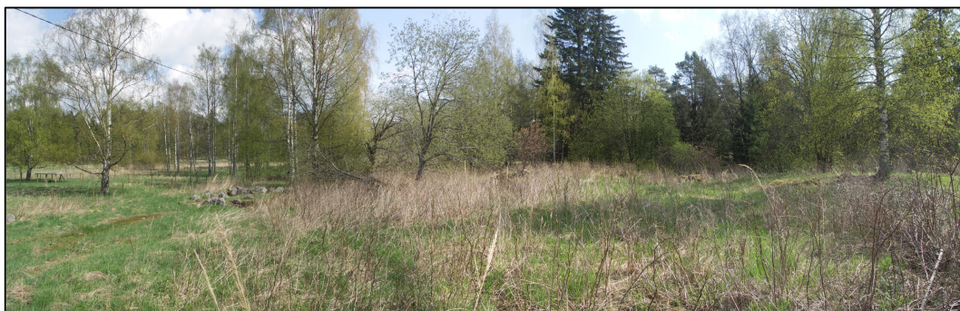
Yleiskuva Stor-Svinön tontilta