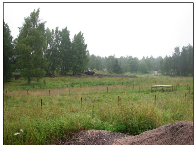
Kaivannot peitettiin koneellisesti kaivausten loputtua

Kaivausten jälkeen koeojat täytettiin koneellisesti Espoon kaupungin toimesta.