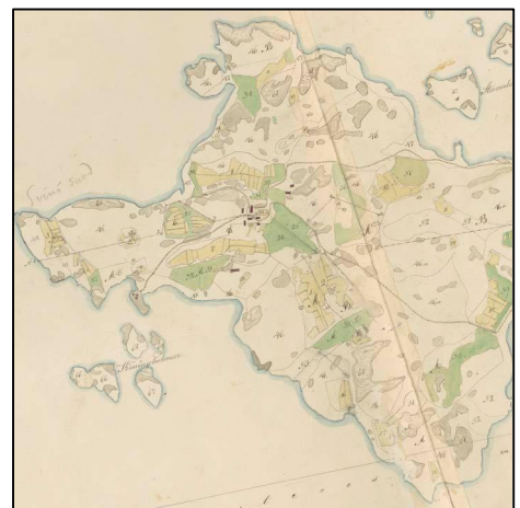
Svinön kartta v. 1828-29