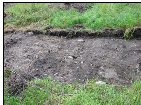
Aluella 5 havaittu vanha tienpohja