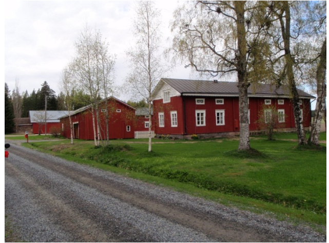
Laurila luoteeseen kohti Torvisen löytöaluetta.

Tarkastuksessa ei siis todettu muinaismuistoja tilalla Soralaurila 5:67 eikä ottotoiminnan rajoittamiseen löydy muinaismuistolain (295/63) mukaista perustetta.