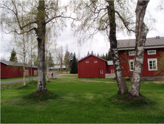
Laurila länteen vanhan oton suuntaan.