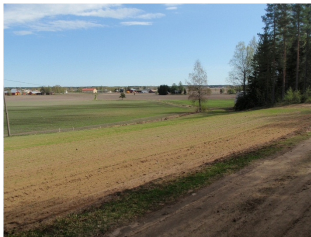
Kuva 2. Metsänreunasta mökkitieltä itään kohti rekisterikoordinaattia.

Torvisen löytöalue sijaitsee soratilalta noin 200 m koilliseen. Vanha soranotto on metsittynyt ja sen reunalta oli paikoin poistettu puusto. Vanhalla ottoalueella oli matalia kuoppia, punertavan peitteen