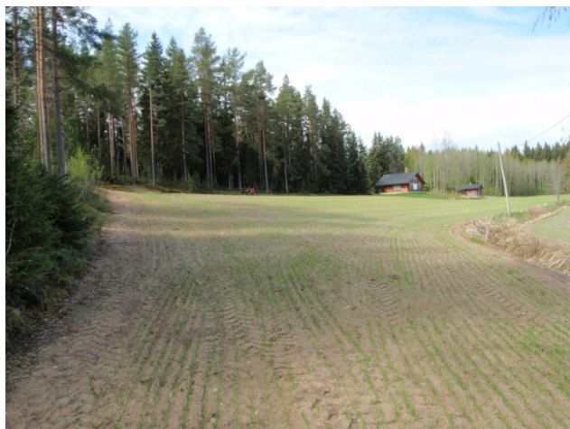
Kuva 1. Rekisterikoordinaatista P: 6937296 ja I: 237804 länteen.