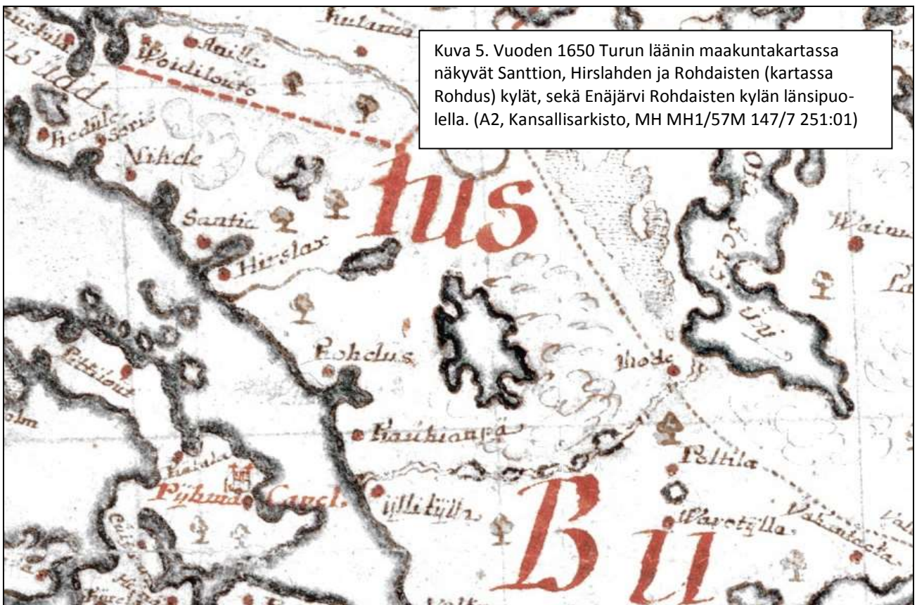
Kuva 5. Vuoden 1650 Turun läänin maakuntakartassa näkyvät Santtion, Hirslahden ja Rohdaisten (kartassa Rohdus) kylät, sekä Enäjärvi Rohdaisten kylän länsipuolella. (A2, Kansallisarkisto, MH MH1/57M 147/7 251:01)