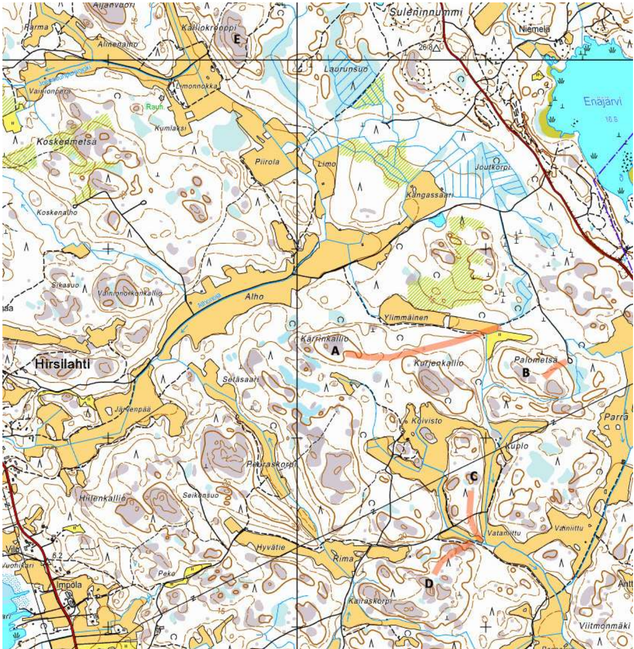
Kartta 1. Tarkastetut kohteet on merkitty karttaan seuraavasti: