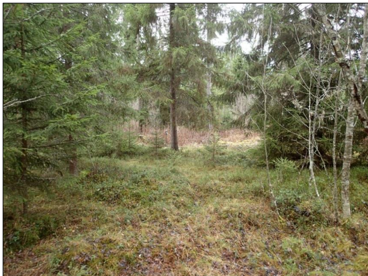
Koekuoppa n:o 3 kuvan keskiosassa, kuusen vasemmalla puolella. Kuvattu eteläkaakkoon.