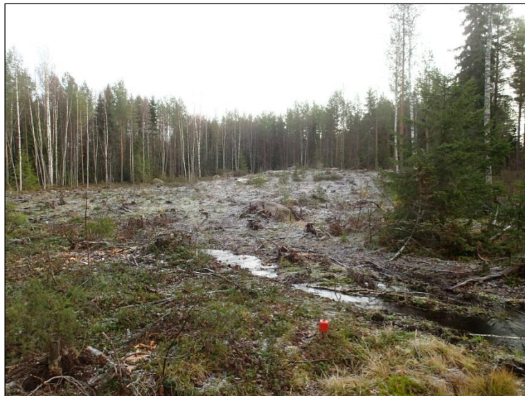
Hakattua aluetta kuvattuna Marjakujan päästä itään. Tällä alueella ei havaittu muinaisjännöksiä.