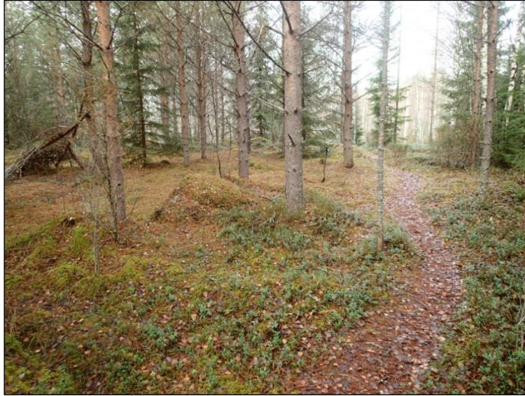
Koekuoppa n:o 1 lapion kohdalla polun vasemmalla puolella. Kuvattu luoteeseen.