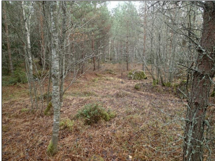
Koekuoppa n:o 2 kuvan keskiosassa lapion kohdalla. Kuvattu koilliseen.