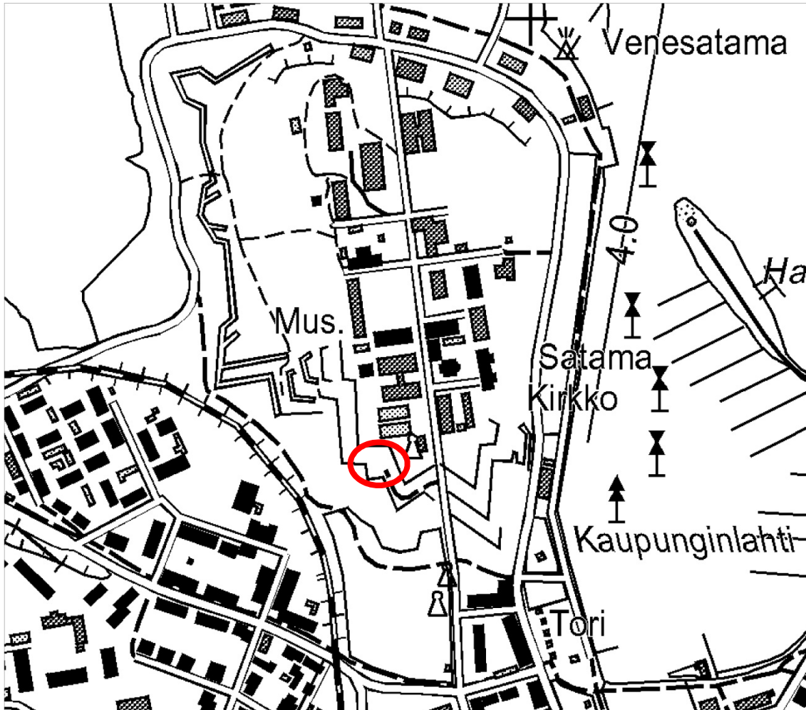
Kesäteatterin sijainti Lappeenrannan linnoituksessa.