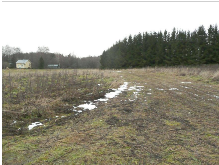
Kesannolla olevaa tasaista savipeltoa Petäykseen menevän tien lounaispuolella.