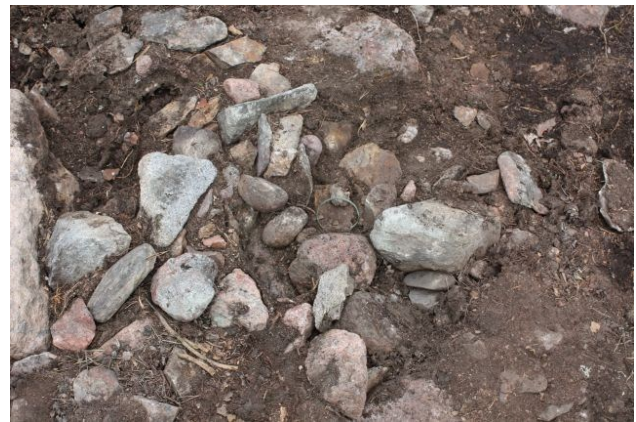
AKDG3618:65. Pirunkynsi I. Pronssinen rannerengas in situ. Yksityiskohtakuva kaakosta. Oikealla AKDG3618:66. Rannerenkaan löytöpaikkaa hieman laajemmin. Kuvattu kaakosta.