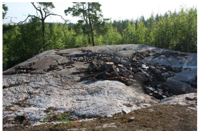
AKDG3618:81. Pirunkynsi I tasossa 2. Kuvattu luoteesta. Oikealla AKDG3618:82. Pirunkynsi I tasossa 2. Kuvattu etelästä.