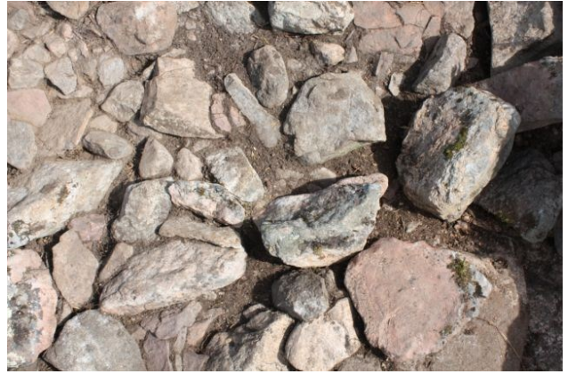
AKDG3618:56. Pirunkynsi II. Röykkiön pohjoisosa tasossa 1. Kuvattu etelästä. Oikealla AKDG3618:57. Pirunkynsi II. Yksityiskohtakuva röykkiön eteläosan kiveyksestä tasossa 1. Kuvattu lännestä.