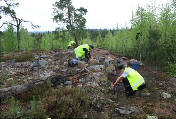
AKDG3618:9. Pirunkynsi I. Työkuva pintaturpeen poistosta röykkiön itäreunalla. Etelästä.