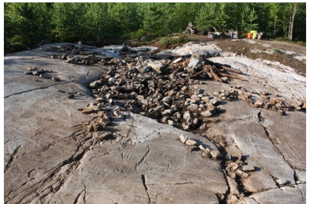
AKDG3618:79. Pirunkynsi I tasossa 2. Kuvattu kaakosta. Oikealla AKDG3618:80. Pirunkynsi I tasossa 2. Kuvattu pohjoisesta.