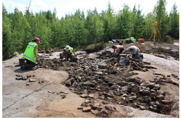
AKDG3618:67. Pirunkynsi I. Ensimmäinen kivikerros poistettu. Kuvattu etelästä. Oikealla AKDG3618:70. Työkuva. Pirunkynsi I. Tasoa 2 otetaan esille. Kuvattu pohjoisesta.