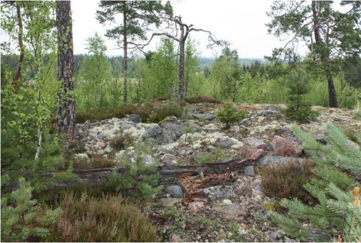
AKDG3618:4. Pirunkynsi I. Yleiskuva röykkiöstä ennen pintaturpeen poistoa. Etelästä.