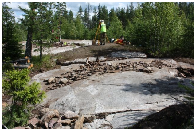
AKDG3618:91. Pirunkynsi II tasossa 2. Kuvattuna etelästä. Oikealla AKDG3618:92. Pirunkynsi II tasossa 2. Kuvattuna lännestä.