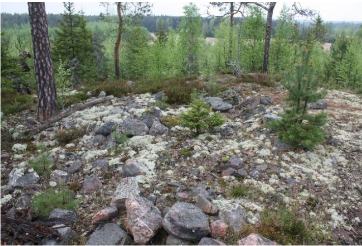
AKDG3618:5. Pirunkynsi I. Lähikuva röykkiöstä ennen pintaturpeen poistoa. Kaakosta.