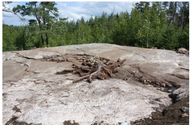
AKDG3618:97. Pirunkynsi I tasossa 3. Kuvattu pohjoisesta. Oikealla AKDG3618:98. Pirunkynsi I tasossa 3. Kuvattu lounaasta.