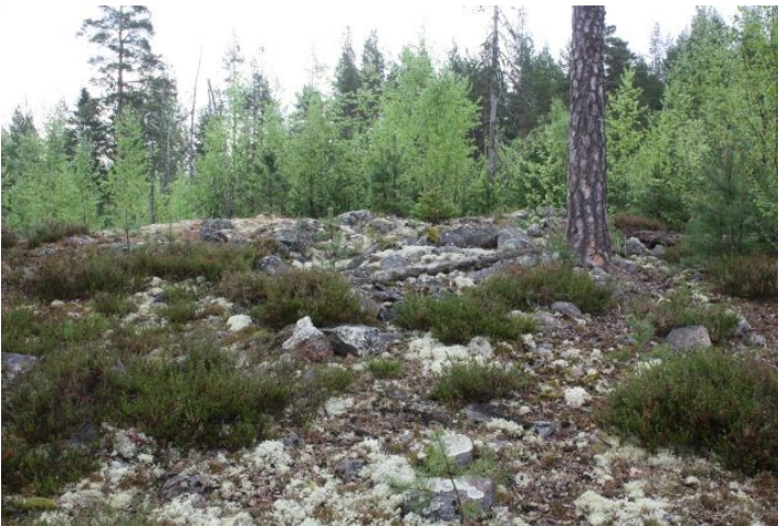
AKDG3618:3. Pirunkynsi I. Yleiskuva röykkiöstä ennen pintaturpeen poistoa. Lännestä.