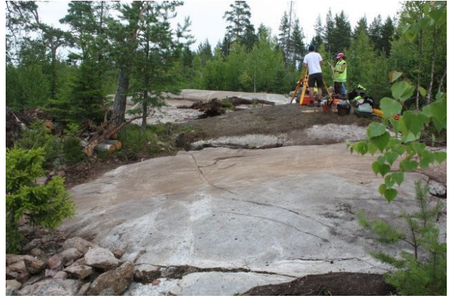
AKDG3618:114. Pirunkynsi II pohjaan kaivattuna. Idästä. Oikealla AKDG3618:115. Pirunkynsi II pohjaan kaivattuna. Lännestä.