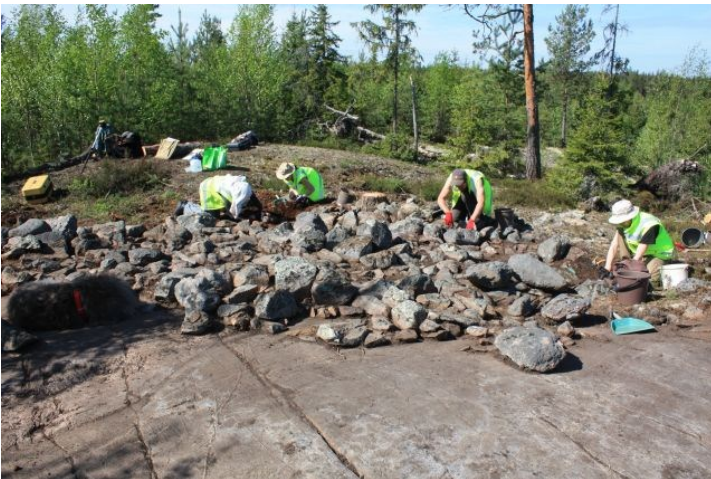
AKDG3618:14. Pirunkynsi I. Työkuva röykkiön pintaturpeen poistosta. Koillisesta.