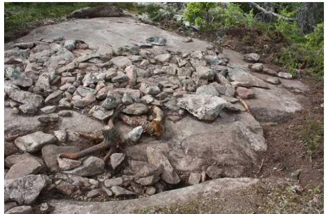
AKDG3618:50. Pirunkynsi II. Röykkiön pohjoisosa tasossa 1. Kuvattu idästä. Oikealla AKDG3618:51. Pirunkynsi II. Röykkiön eteläosa tasossa 1. Kuvattu idästä.