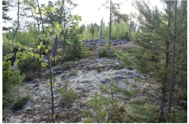
AKDG3618:17. Pirunkynsi II. Röykkiö ennen turpeen poistoa. Luoteesta. Oikealla AKDG3618:18. Pirunkynsi II. Röykkiö ennen turpeen poistoa. Lännestä. Taustalla Pirunkynsi I.