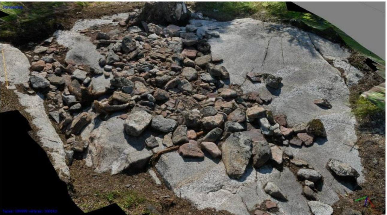
Pirunkynnen røykkiö II tasossa 1 yläviistosta pohjoisesta nähtynä.