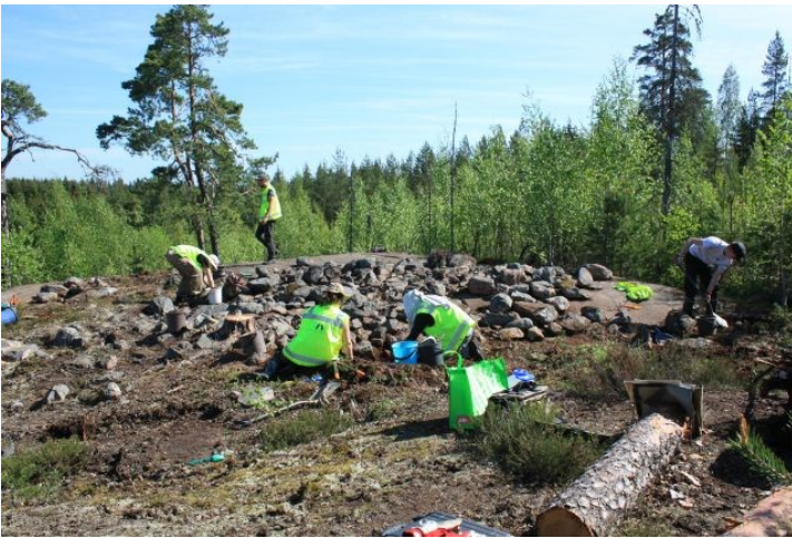
AKDG3618:13. Pirunkynsi I. Työkuva röykkiön pintaturpeen poistosta. Lounaasta.