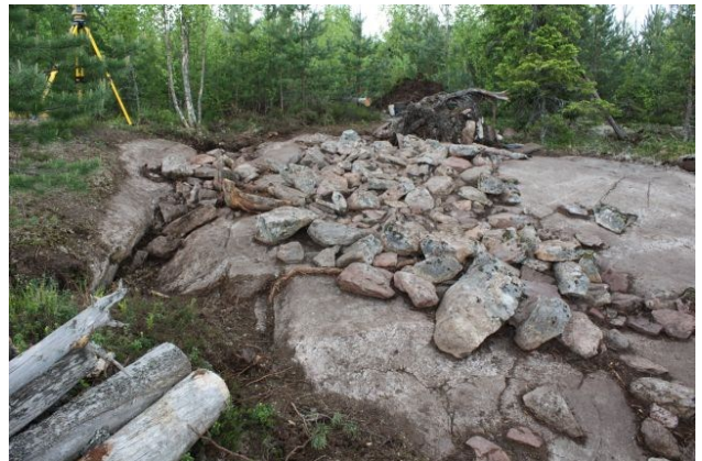
AKDG3618:45. Pirunkynsi II tasossa 1. Idästä. Oikealla AKDG3618:49. Pirunkynsi II tasossa 1. Kuvattu etelästä.