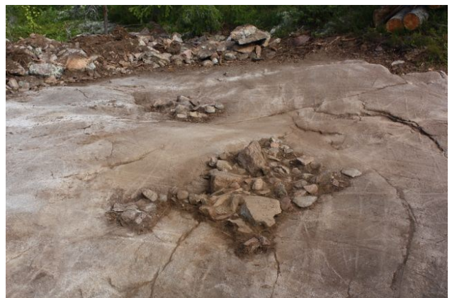
AKDG3618:93. Pirunkynsi II tasossa 2. Kuvattuna pohjoisesta. Oikealla AKDG3618:104. Pirunkynsi II tasossa 3. Kuvattu etelästä.