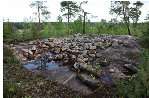
Ylhäällä vasemmalla: AKDG3618:29 Pirunkynsi I tasossa 1. Kuvattu luoteesta. Ylhäällä oikealla: AKDG3618:30. Pirunkynsi I tasossa 1. Kuvattu pohjoisesta. Alhaalla vasemmalla: AKDG3618:33 Pirunkynsi I. Rökkiön kaakkoisosa tasossa 1. Kuvattu pohjoisesta. Alhaalla oikealla: AKDG3618:34 Pirunkynsi I. Tasossa 1. Kuvattu kaakosta.