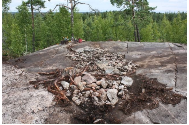
AKDG3618:88. Pirunkynsi I. Yksityiskohtakuva röykkiön pohjoisosan kiveyksestä tasossa 2. Kaakosta. Oikealla AKDG3618:90. Pirunkynsi I reunakivien poiston jälkeen. Kuvattuna etelästä.

Röykkiön I pinta-ala pieneni ensimmäisen kivikerroksen poiston jälkeen noin 50 %. Kiveys oli yhtenäinen vain röykkiön keskellä kalliossa olleen syvennyksen kohdalta. Röykkiön luoteis- ja itäpuolella oli vielä pieniä kivikkoalueita. Toisen kivikerroksen kivet olivat keskimäärin pienempiä kuin ensimmäisen eli kivet olivat halkaisijaltaan alle 25 cm. Vain männyn kannon ympärillä sekä rannerenkaan löytöpaikan kohdalla oli isompia kiviä, joiden halkaisija oli 30–45 cm. Osa suuremmista kivistä oli kiinni männyn juurissa.