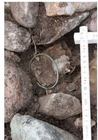
Vasemmalta oikealle: AKDG3618:6 Pirunkynsi I. Lähikuva rökkiön mahdollisesta reunakehästä ennen pintaturpeen poistoa. Luoteesta. AKDG3618:11 Puun kaatoa rökkiöltä I. Kuvattu etelästä. AKDG3618:36 Yleiskuva maisemasta. Kuvattu etelästä. AKDG3618:64 Rannerengas KM 39764:1 in situ. Kuvattu luoteesta.