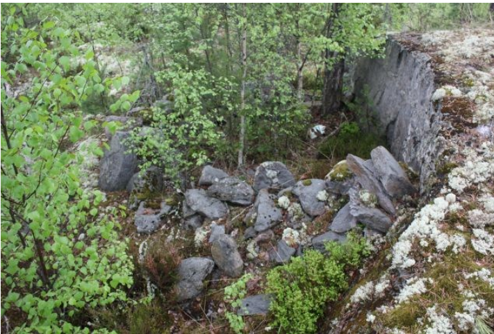
AKDG3618:8. Röykkiön kivien uusiokäyttöä suojavallina Pirunkynsi I pohjoispuolisen kallioseinämän vieressä. Lounaasta.