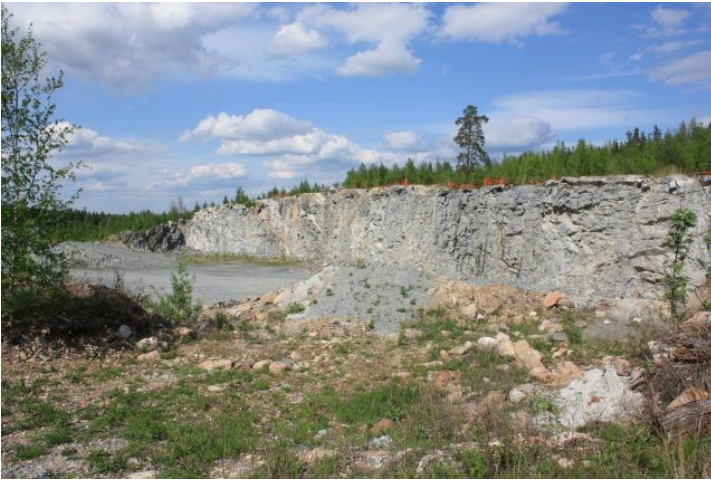
AKDG3618:1. Lemminkäinen Infra Oy:n Pirunkynnen louhosalue kuvattuna lounaasta. Kaivauskohde sijaitsee kallioalueen pohjoisosassa.