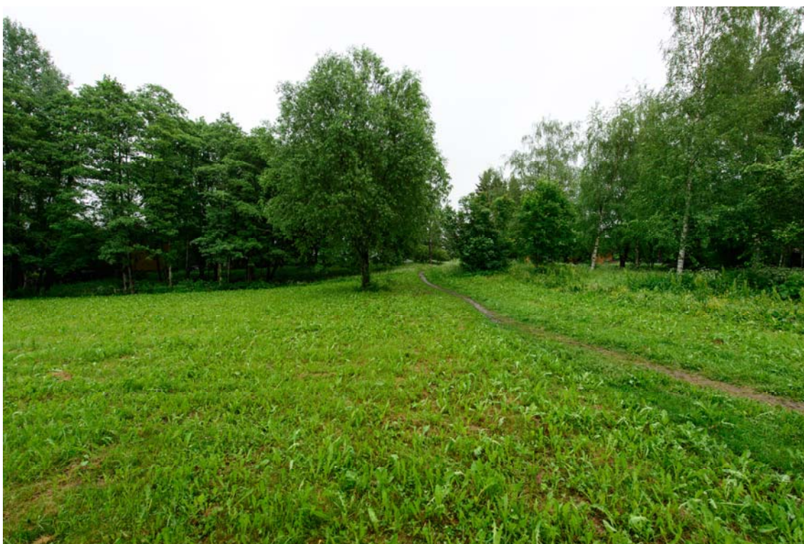
Inventointialuetta Valkamatien itäpuolella. Kuvattu itään. (AKDG3733:3)

Kajoavia tutkimuksia ei ollut tarkoitus tehdä, johtuen lähinnä siitä, että alue koostuu puistoista ja yksityispihoista. Valkamatien ja Tervanokantien risteyksessä oleva muuttuvan maankäytön tontti on nykyisin rakentamatta, joten sille kuitenkin tehtiin neljä 50x50 cm koekuoppaa. Koekuopat kaivettiin noin 50 cm syvyyteen. Niistä todettiin, että turve- ja multakerroksen alapuolella on sekoittuneen näköinen