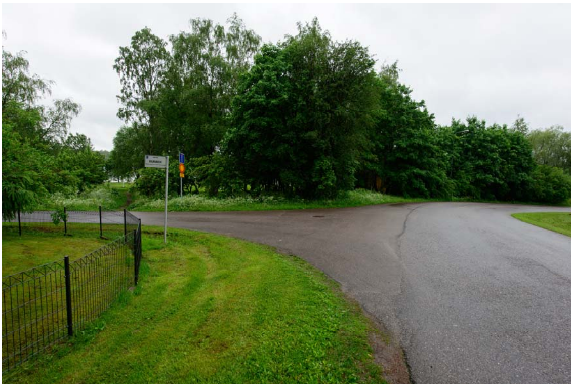
Inventointialuetta Tervanokantien ja Valkamatien risteyksessä. Kuvattu luoteeseen. (AKDG3733:2=)