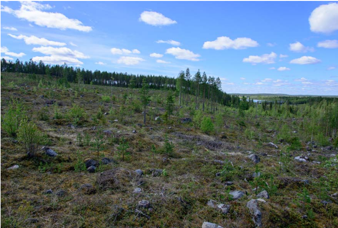
Kuva 2. Inventointialuetta Marjavaaran pohjoisosassa. Kuva luoteeseen. (AKD3729:2)

Rovaniemen alue oli veden peitossa viimeisen jääkauden jälkeen. Maankohoamisen seurauksena Marjavaaran yläosat paljastuivat Ancyclusjärven alta noin 7000–6800 eaa. Ancyclusjärveä seurasi Litorina meren vaihe, jonka korkein ranta on Rovaniemellä noin 90 m mpy ja ajoittuu noin 5800 eaa. Inventointialueella korkein Litorina ranta on Marjavaaran rinteiden puolen välin paikkeilla. Maankohoaminen ei ole kuitenkaan tasaista joka puolella ja siihen vaikuttavat monet tekijät, tämän seurauksena muodostui Valajaisen kohdalle kynnyksen, joka aiheutti ns. Kolpeneen muinaisjärven syntymisen noin 4000 eaa. Kyseessä oli huomattavan iso järvi, sen pinta-ala oli noin 200 km 2 . Kolpeneen ylin ranta on noin 81–83 metrin korkeudella, joten tässä vaiheessa inventointialueesta vain Marjavaara oli kuivaa maata. Kolpeneen muinaisjärvi kutistui vaiheittain. Tyypillisen kampakeramiikan aikaan noin 3500–2800 eaa, veden pinta oli noin 76–77 metrin korkeudella mpy. Kivikauden lopulla 2800–1300 eaa pinta laski jo alle 74 m mpy. Järven purku-uomat kasvoivat koko ajan suuremmiksi ja virtaus kasvoi ja lopulta Kolpeneen muinaisjärvi lakkasi olemasta ja muuttui jälleen osaksi Kemijokea noin 1000 eaa.