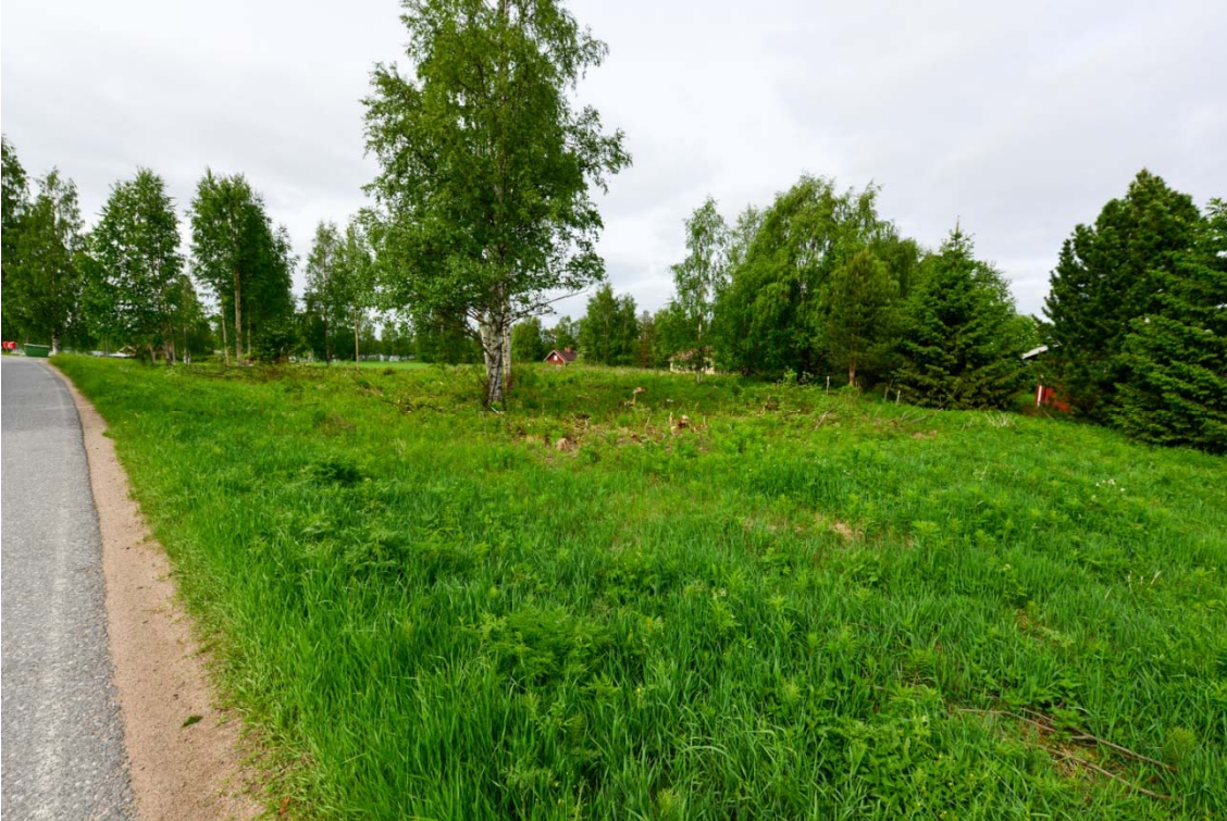
Oinas, mahdollinen muinaisjäännös. Tontilla on jäännöksiä 1800-1900 –luvun asutuksesta mm. kaivo. Kuva luoteeseen Paavalniemen tieltä. (AKD3730:1)