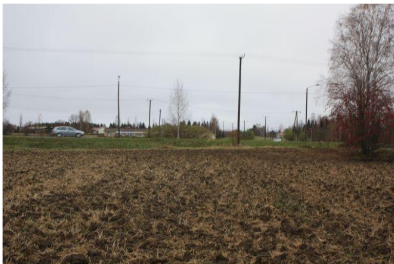
AKDG3899:4. Näkymä. Yleiskuva tutkimusalueen länsiosasta Tammelantielle. Etelästä. 20.10.2014