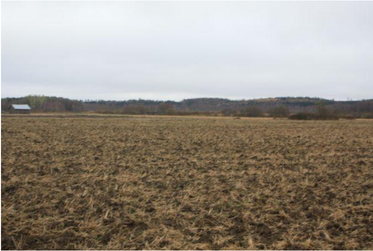
AKDG3899:7. Näkymä Linjapellon peltosaarekkeelta kohti Loimijokea. Pohjoisesta.