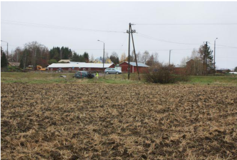
AKDG3899:3. Yleiskuva tutkimusalueen länsiosasta. Tammelantien pohjoispuolella Vanhan-Similän tilan rakennuksia. Eteläkaakosta. 20.10.2014