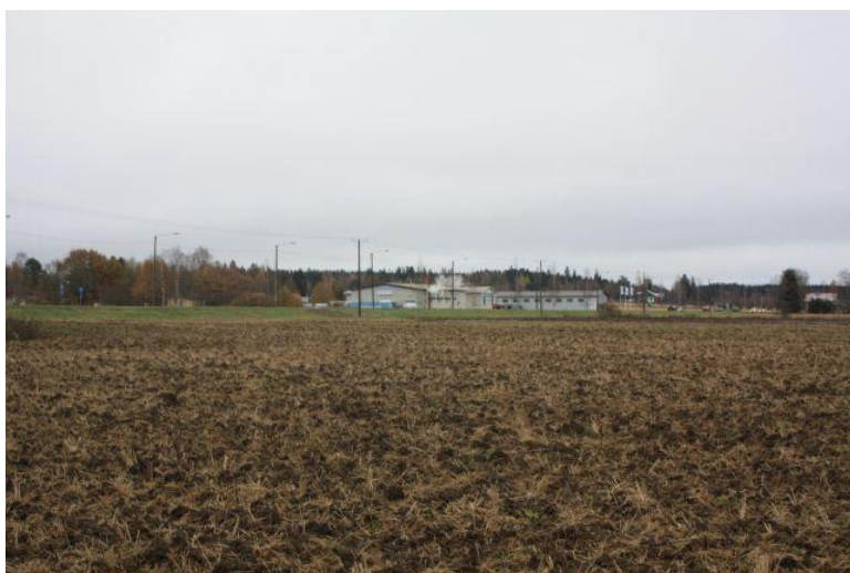
AKDG3899:6 Näkymä tutkimusalueen itäosasta kohti koillista. Lounaasta. 22.10.2014