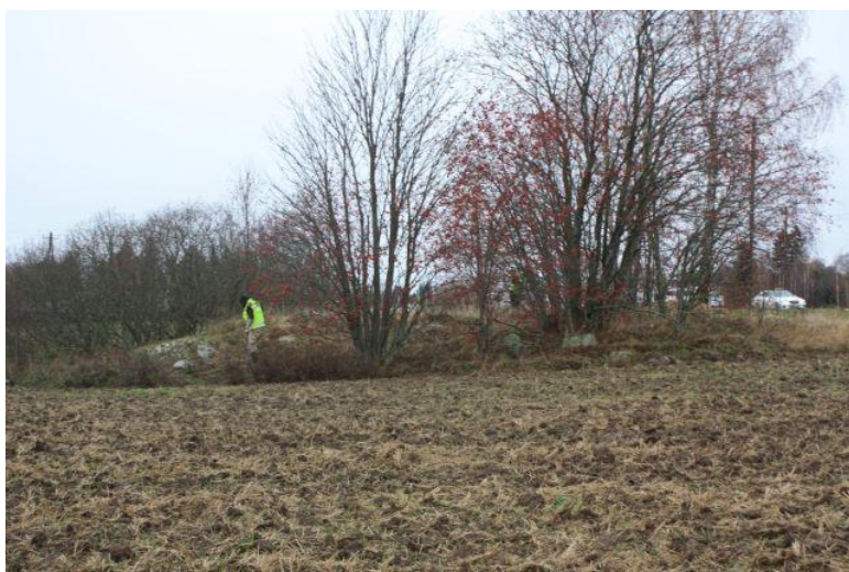
AKDG3899:5. Yleiskuva tutkimusalueen itäosasta. Idästä.