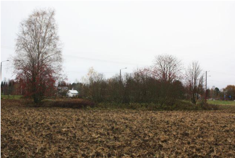
AKDG3899:2 Linjapellon oletettu kivikautinen asuinpaikkakumpare lounaasta kuvattuna.

Seuraavassa esitellään tutkimusten aikana otettu ja WebMuskettiin tallennettu digitaalinen kuva-aineisto soveltuvien osien. Kuva-aineisto on talletettu numeroilla AKDG3899:1-7.