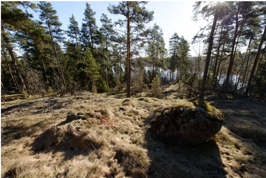
Raasepori, Västerudden. Maisemaan mäen päältä pohjoiseen. (AKDG3921:5)