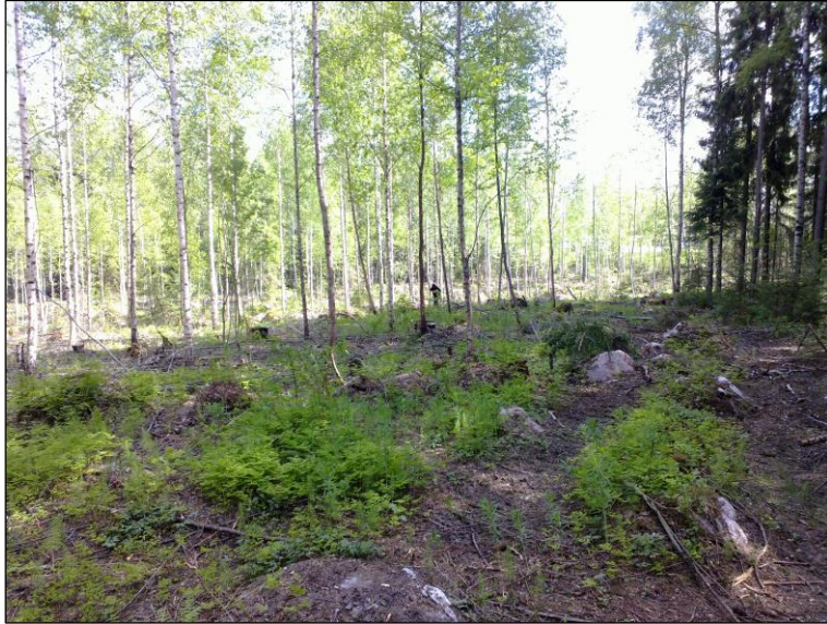
Pohjoisemman reittivaihtoehdon aluetta suon reunamilla, etelään.