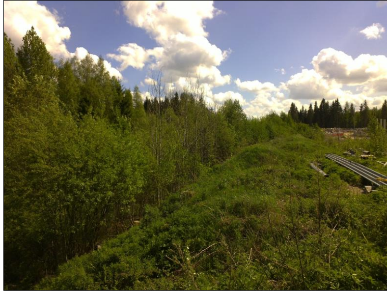
Linjan lounaispään eteläisen reittivaihtoehdon aluetta suon reunalla – suohon laskeva täyte- maatörmä. Sen alapuolella (itäpuolella) jokin maahan kaivettu linja (vesijohto?)