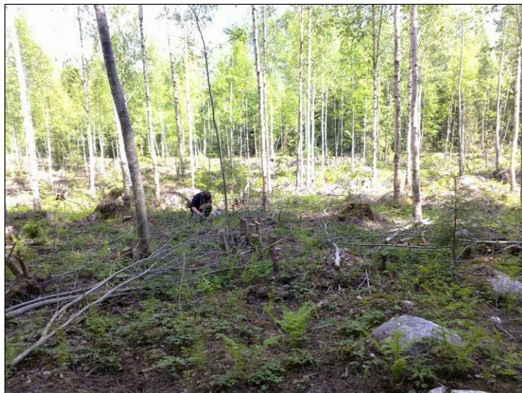
Pohjoisemman reittivaihtoehdon aluetta suon reunamilla. Itään linjan kohdalta.