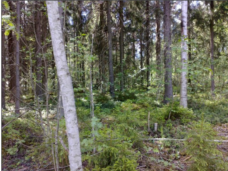
Pohjoisemman reittivaihtoehdon aluetta kauempana suon reunasta, länteen.