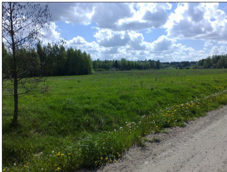
Voimajohtolinjaa suopellossa kuvan keskellä, vedenottamon länsipuolelta lounaaseen.