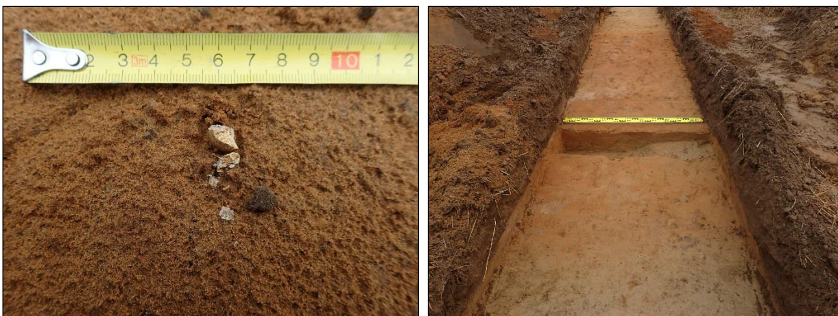
Palanutta luuta koejassa nro 9 (vas.). Kivikautista kulttuurikerrosta koejassa nro 9 (oik.).

Koejan kaakkoispäässä muokkauskerros oli 25 cm, hieta 5 cm syvyydessä, oli kokonaissyvyys 30 cm. Koejan luoteispäässä muokkauskerros oli 25–30 cm, savi 5-10 cm syvyydessä, kokonaissyvyys 40 cm.