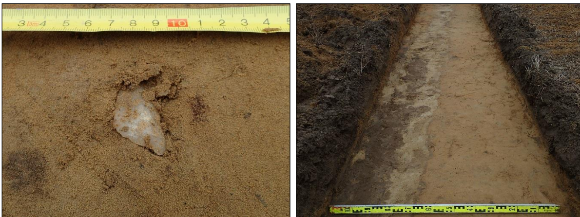
Kvartsi-iskos koejassa nro 8 (vas.). Resentti oja koejassa nro 8 (oik.).