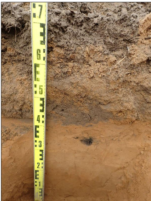
Kulttuurikerrosta kyntökerroksen alapuolella koeojassa nro 5.