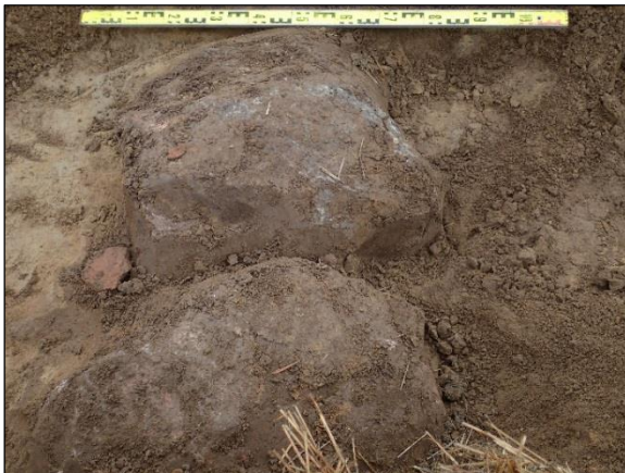
Rakennuksen peruskiviä koeojasta 2.

Koeojan kaakkoispäässä muokkauskerros oli 25–30 cm ja hiekka 10–15 cm syvyydessä, kokonaissyvyys oli 40 cm. Koeojan luoteispäässä muokkauskerros oli 25 cm, savi 15 cm, kokonaissyvyys 40 cm.