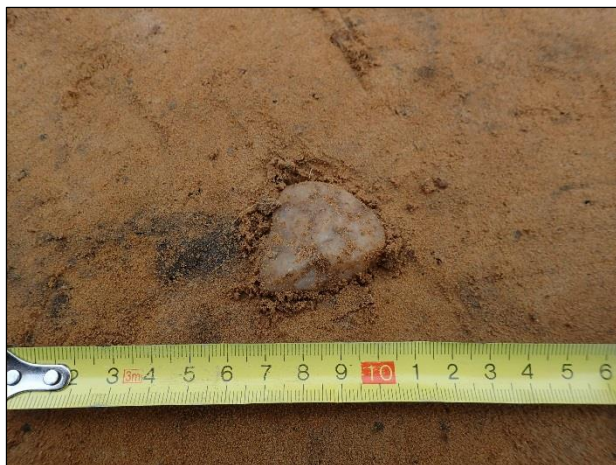
Kvartsi-iskos koejassa nro 7.