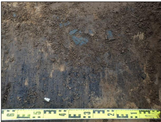
Historiallisen ajan kerrosta, jossa fajanssia ja astialasia koeojassa nro 5.

Koeojan kaakkoispäässä muokkauskerros 25 cm ja hiekka 5 cm syvyydessä, kokonaissyvyys oli 30 cm. Koeojan luoteispäässä muokkauskerros oli 25 cm, savi 10 cm, kokonaissyvyys 35 cm.