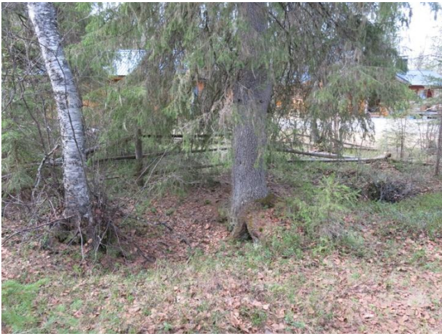
Hautakuoppia keväällä ennen raivausta