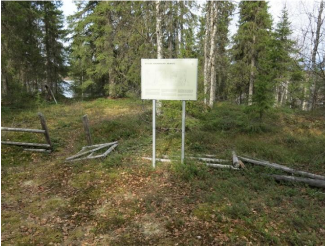
Opasteen kohdalta ennen hoitoa