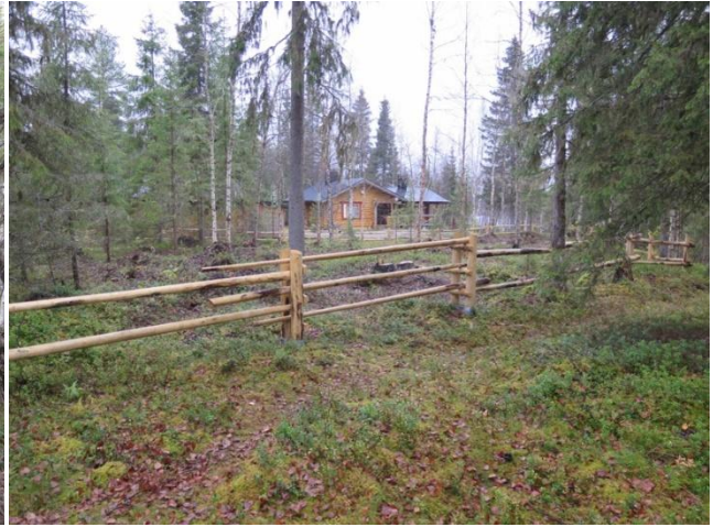
Alue raivauksen jälkeen