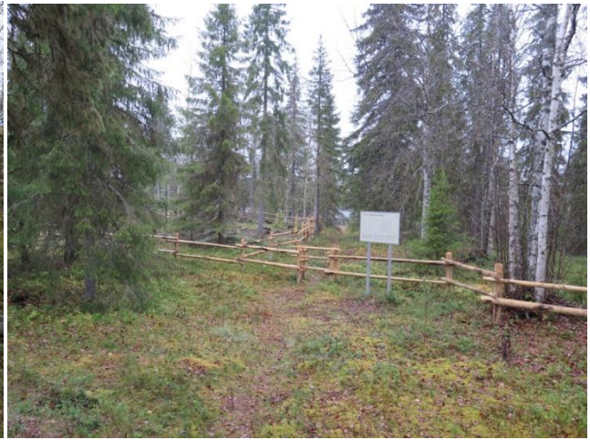
Opasteen kodalta jälkeen