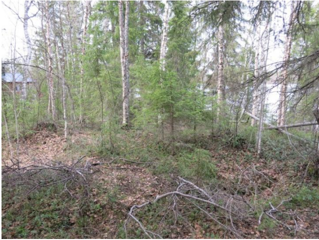
Alue ennen raivausta