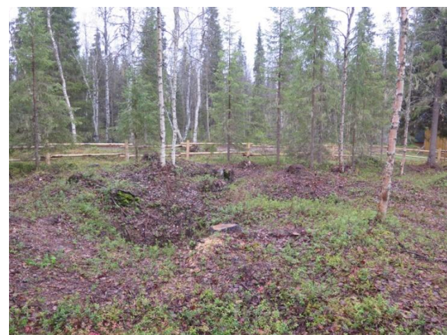
Hautakuoppia raivauksen jälkeen