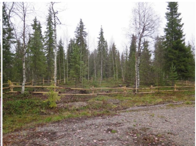
Alue mökkitontilta raivauksen jälkeen