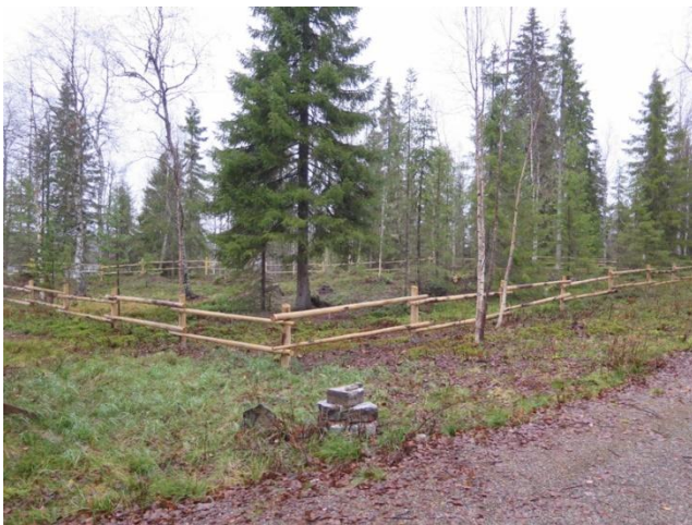
Alue tieltä raivauksen jälkeen