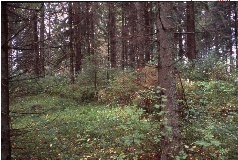
Kuva 4: Rakennuksen pohja.