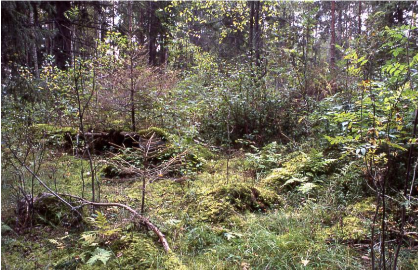
Kuva 2: Rakennuksen pohja.