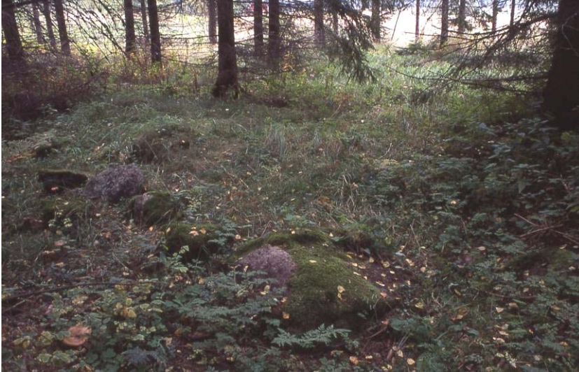
Kuva 1: Rakennus 2. Etualalla mahdollista kivijalkaa.