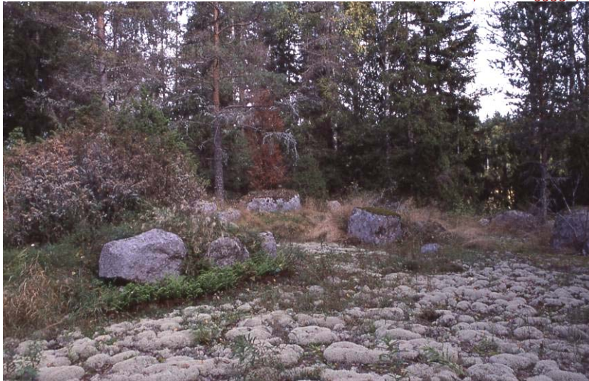
Kuva 3: Rakennuksen pohja.

Havaintomahdollisuudet olivat inventointiajankohtana kohtalaisen hyvät. Rakennuksen päällä kasvaa heinää ja katajaa. Rakennus rajoittuu etelästä avokalliioon ja muualta kuusi-/mäntymetsään.