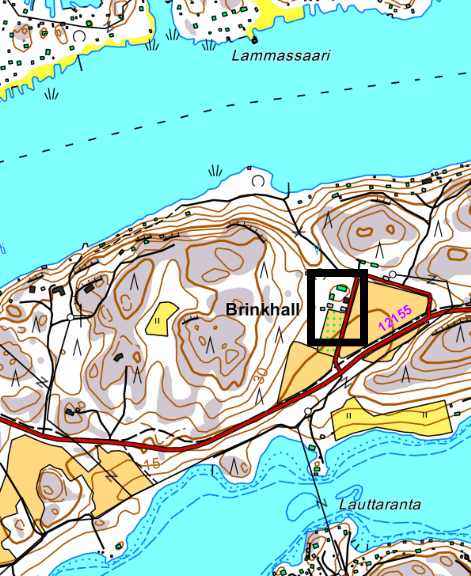
Kartta 1. Yleiskartta.