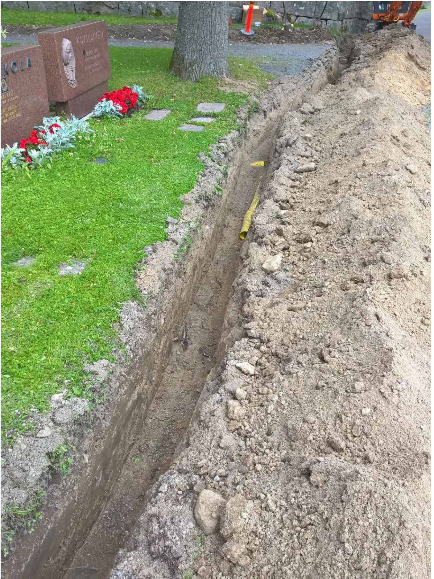
Kuva 1. Kirkon itäpuolen kaivanto. Kapea sähkökaivanto, joka rajoittuu selvään hiekkamaatäyttöön. Kuva 27.7.2015.