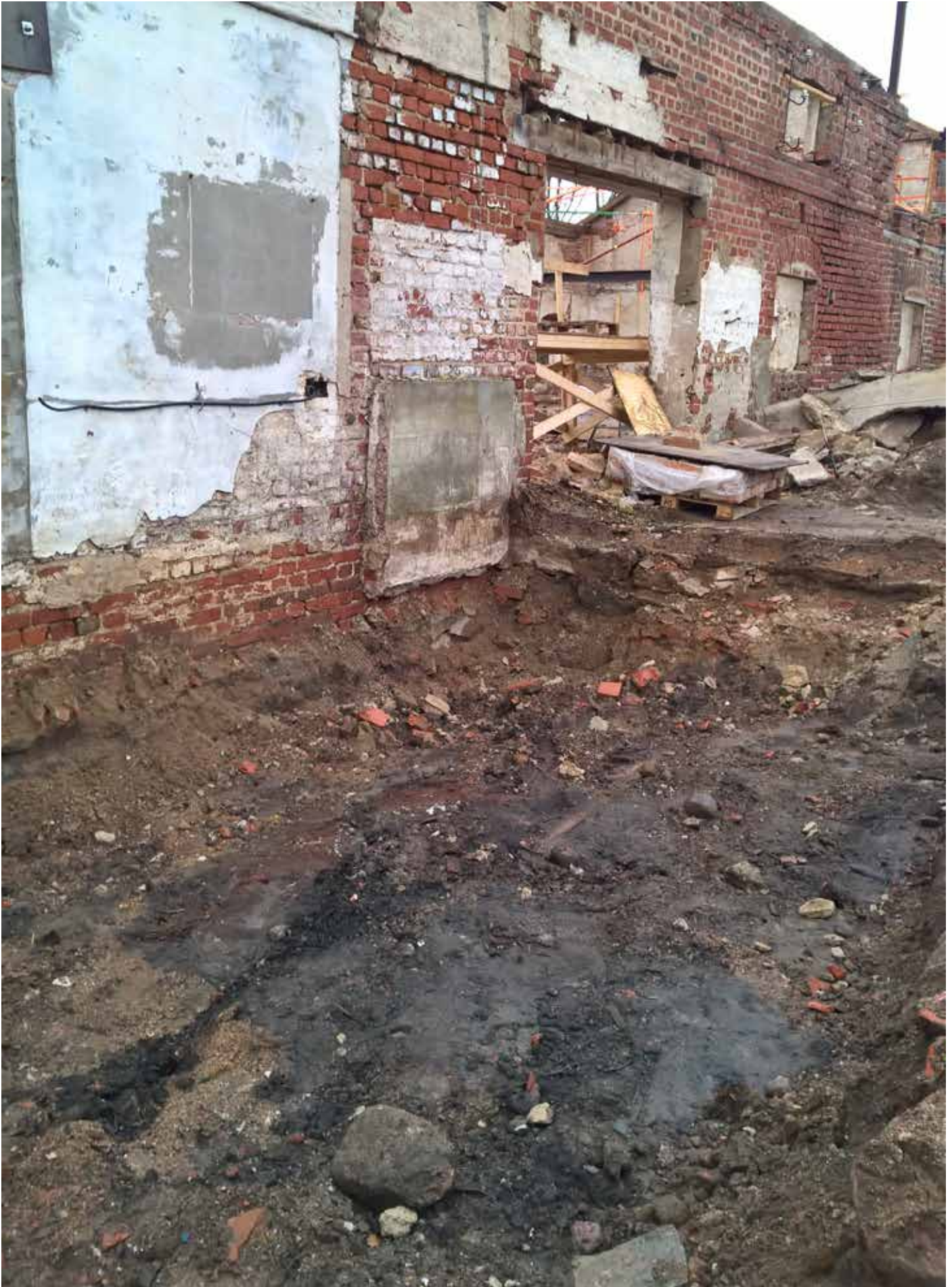
Kuva 1. Navetan eteläpuolen täyttö- ja käyttökerrokset. 12.11.2015.