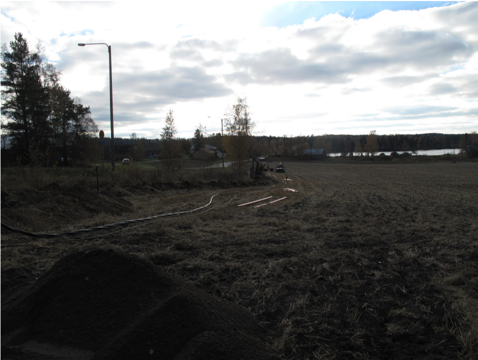
Yleiskuva tutkimusalueesta etelään. Vasemmalla Siltatie ja taustalla vesistö.