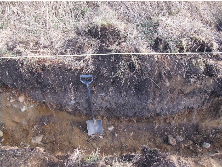
Likamaajälki 4 ojan itäleikkauksessa.