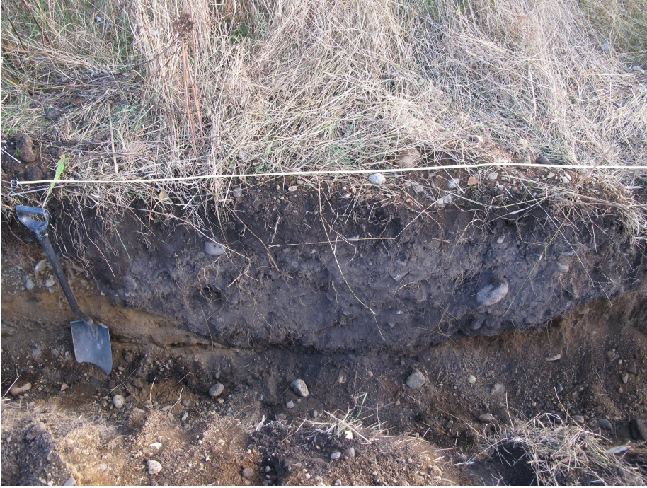
Likamaajälki 1 ojan itäleikkauksessa.