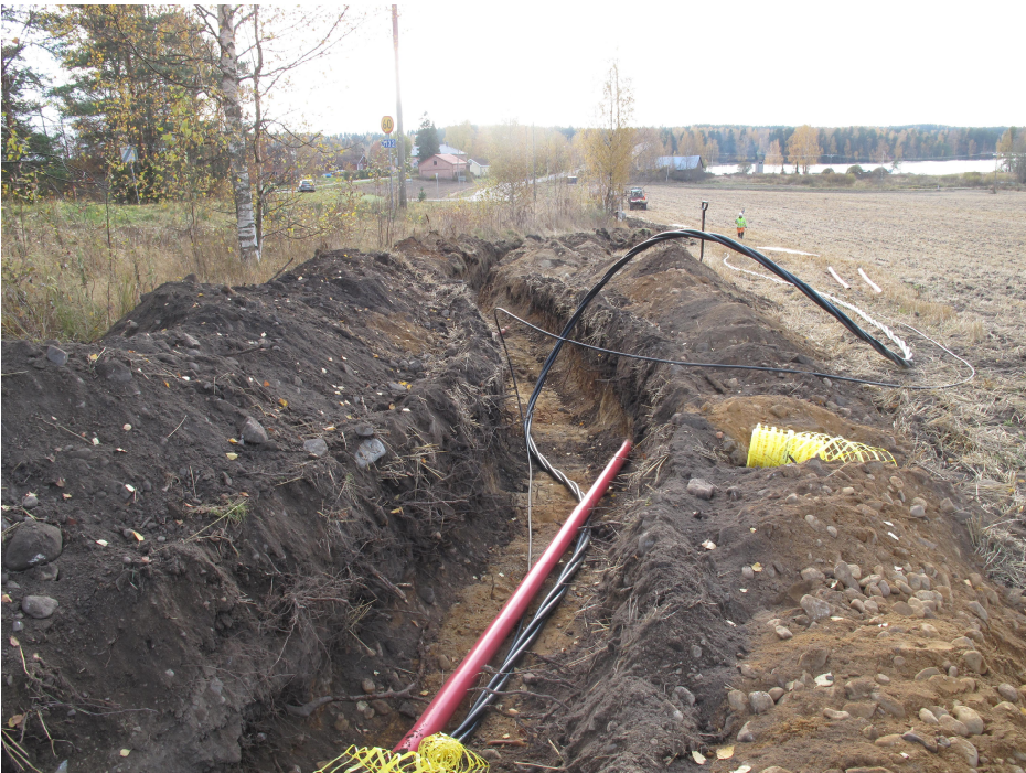
Kaapelikaivannon pohjoispää pellonreunassa.