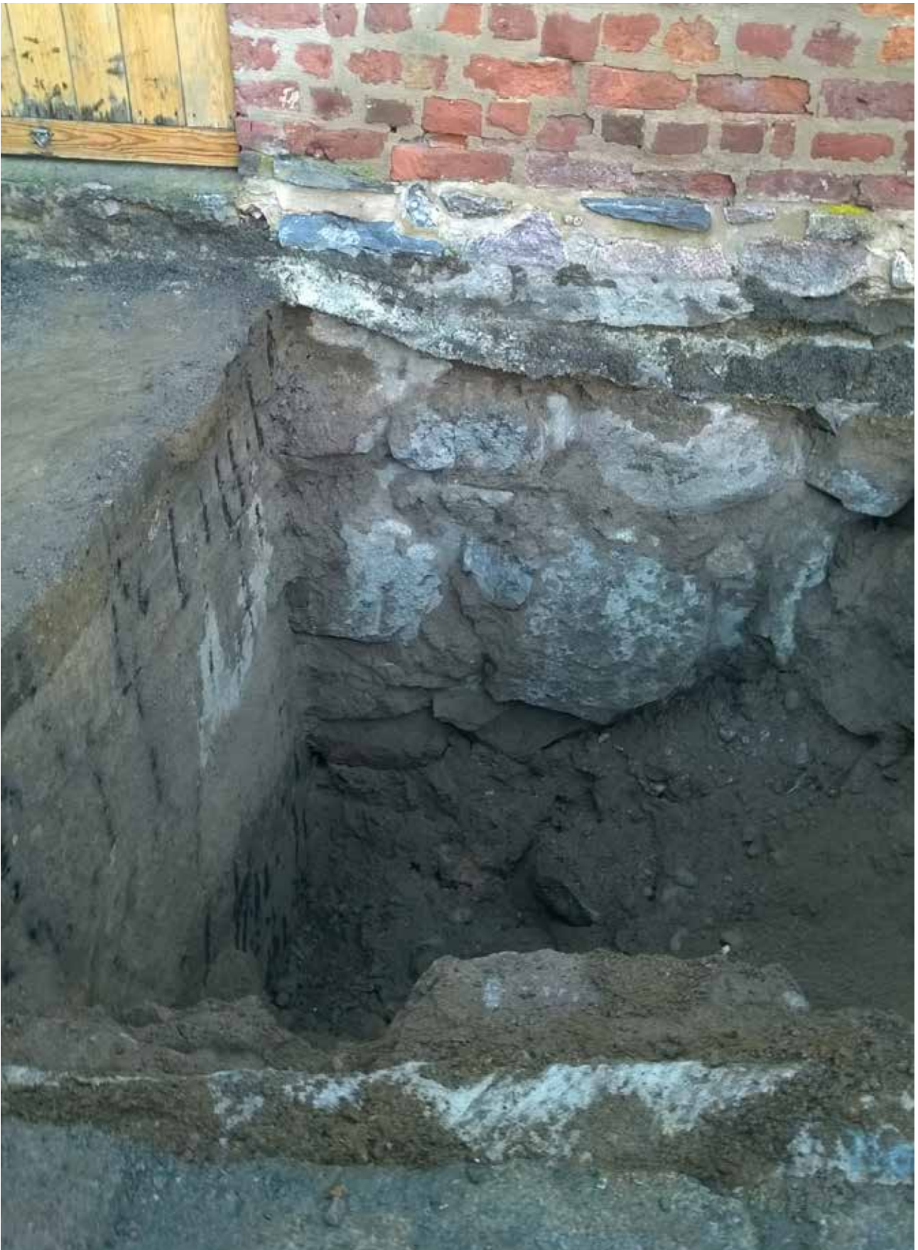
Kuva 1. Kruununleipomon kivinen seinän alaosa ja sen sivussa betonirakenne. E. Marraskuu 2015.