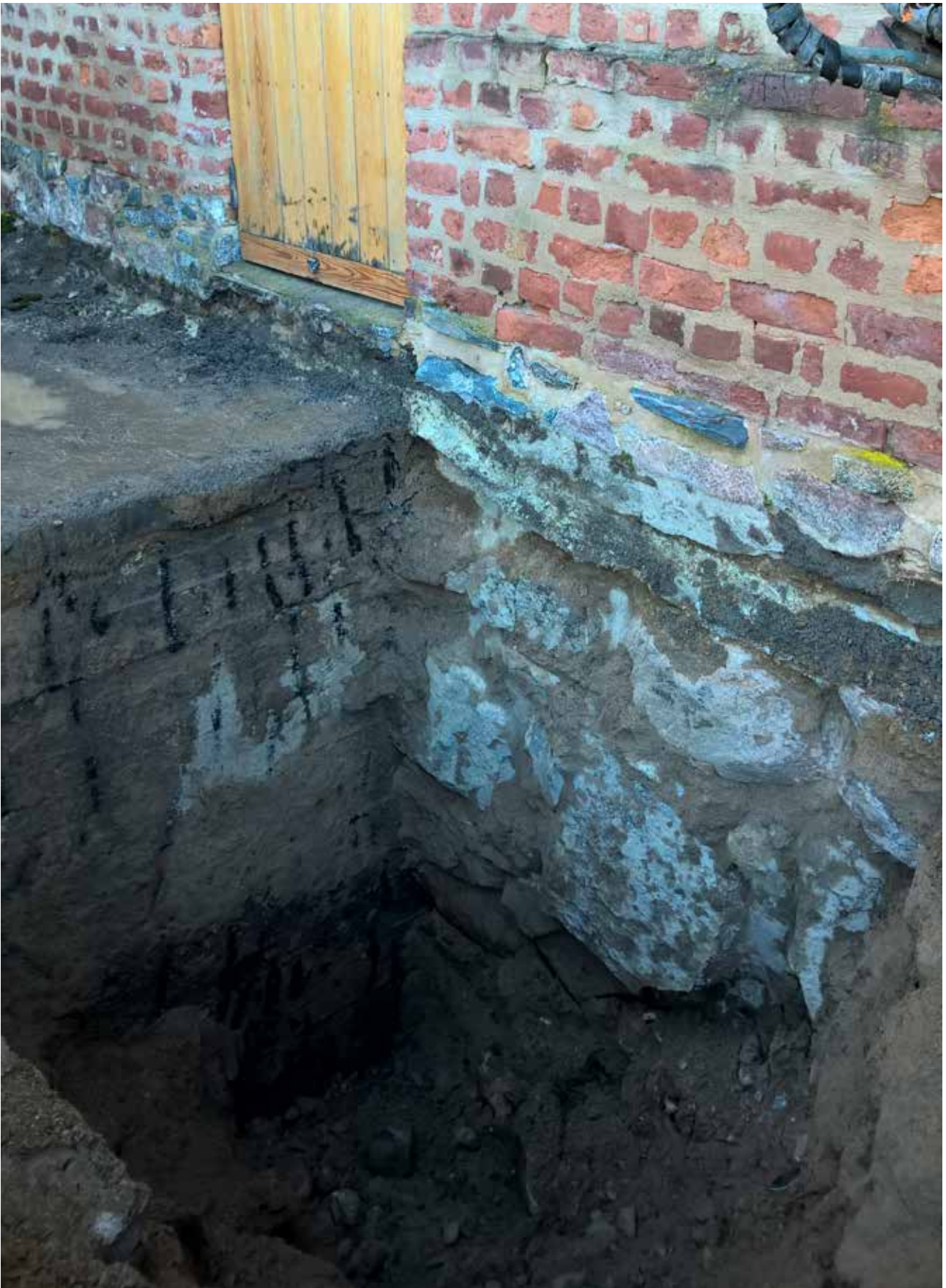
Kuva 2. Kruununleipomon kivinen seinän alaosa ja sen sivussa betonirakenne. NE. Marraskuu 2015.