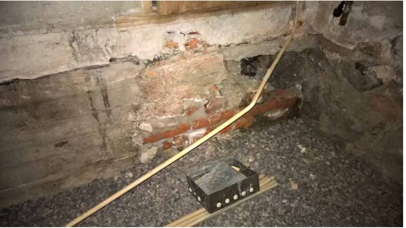
MuTu215002:3. Turun linnan pyörötornin lattian alla olevat seinärakenteet. Kesäkuu 2015. SW. KU