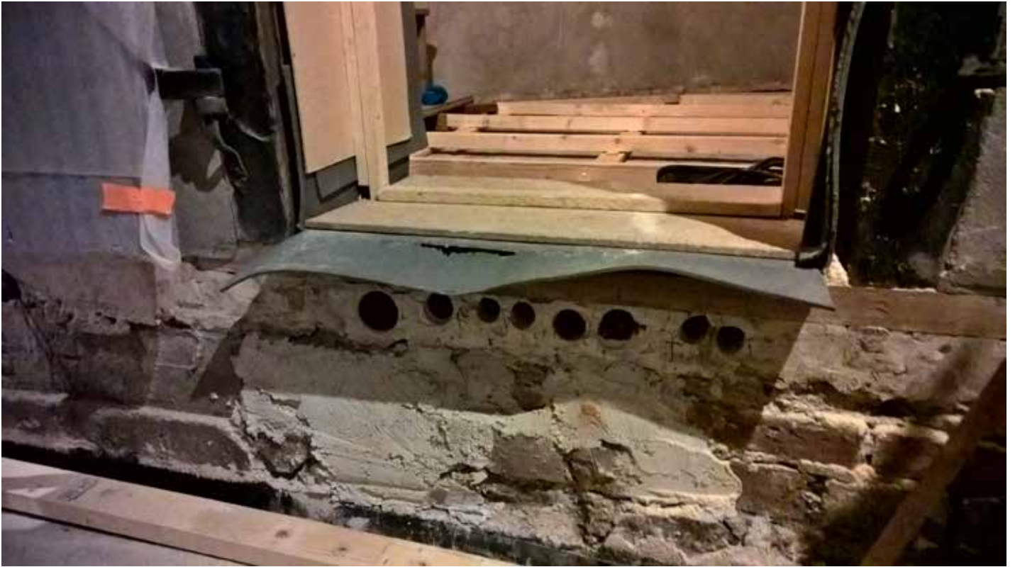
MuTu215002:5. Turun linnan pyörötornin lattian alle tehdyt putkiviennit. Heinäkuu 2015. KU