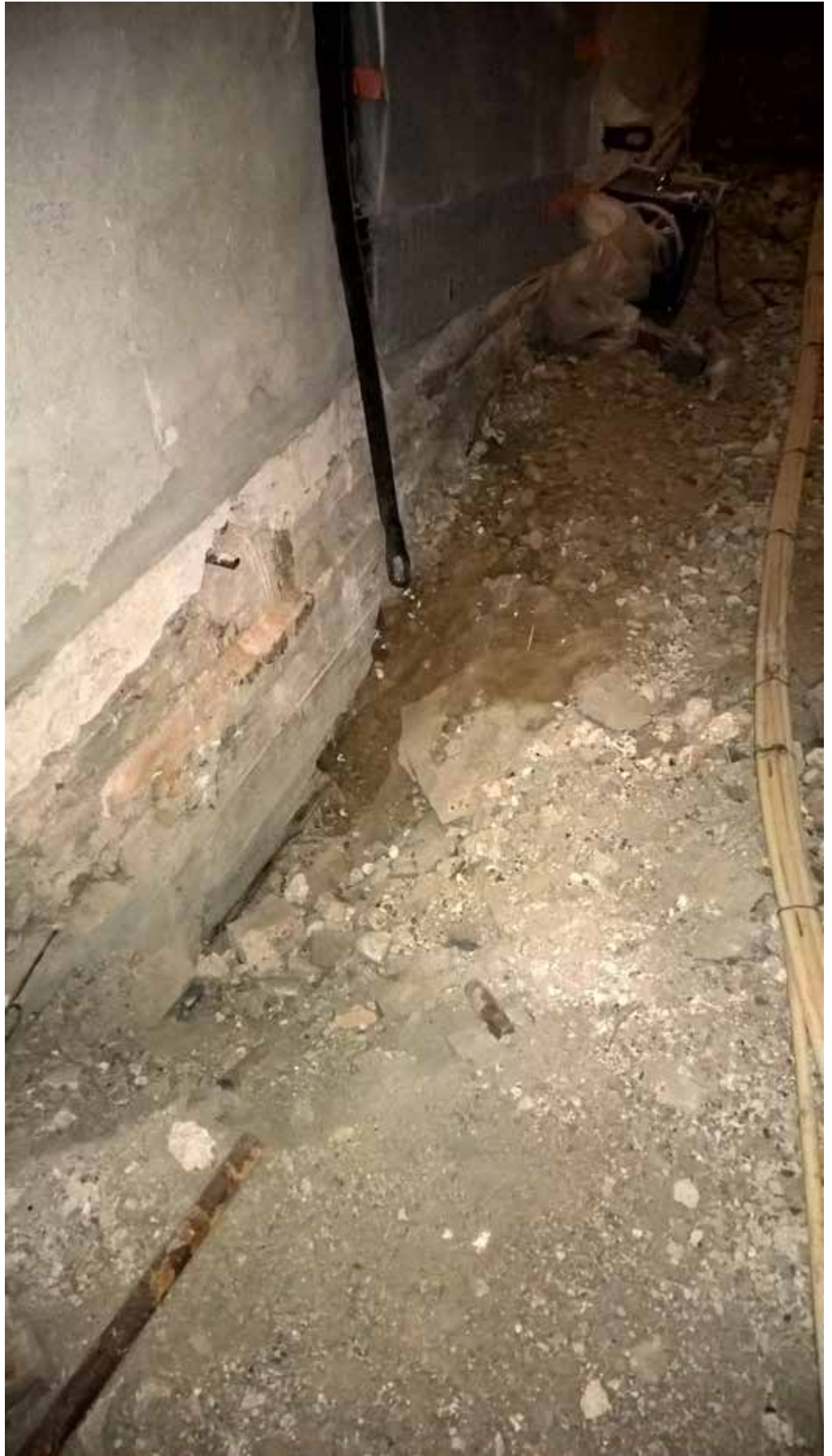
MuTu215002:2. Turun linnan pyörötornin lattian pohjataso. Kesäkuu 2015. NE. KU