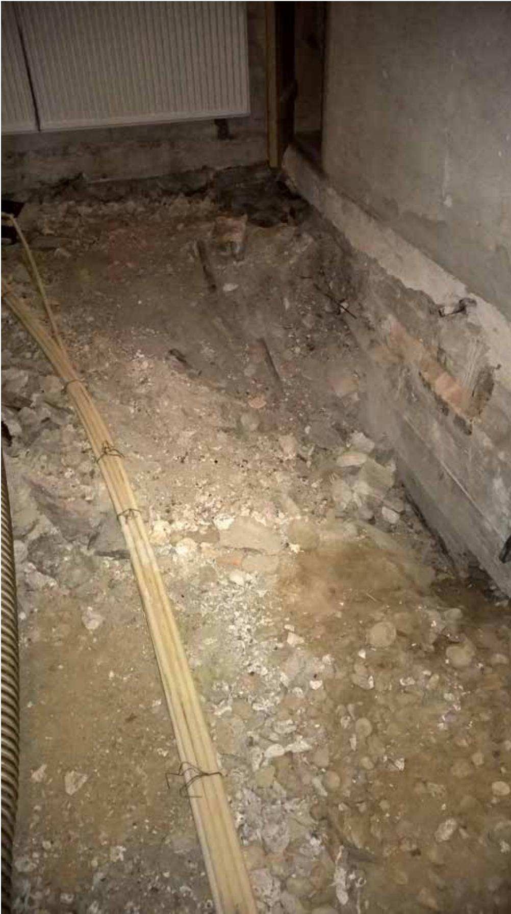
MuTu215002:1. Turun linnan pyörötornin lattian pohjataso. Kesäkuu 2015. NW. KU