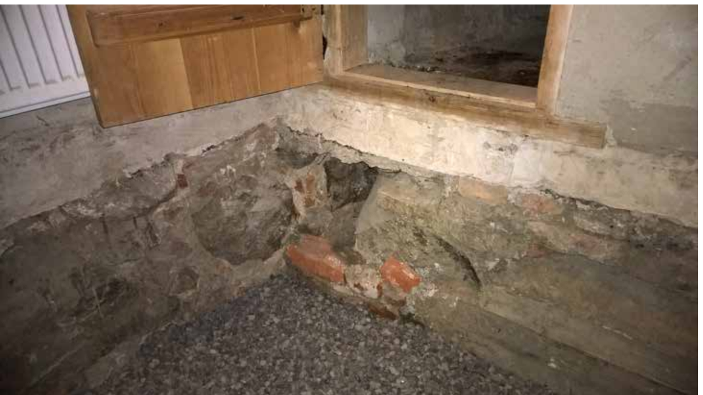
MuTu215002:4. Turun linnan pyörötornin lattian alla olevat seinärakenteet. Kesäkuu 2015. NW. KU