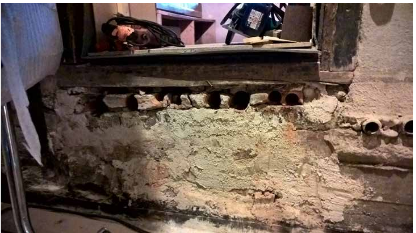
MuTu215002:6. Turun linnan pyörötornin lattian alle tehdyt putkiviennit. Heinäkuu 2015. KU