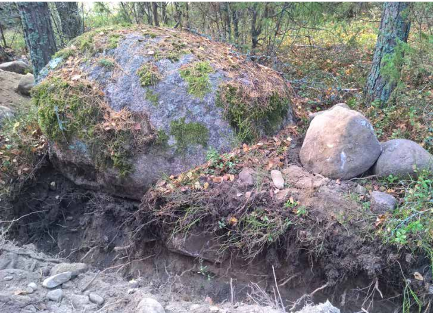
MuTu116021:2. Kappaleen kaakkoisessa osassa ollut suurikokoinen silmäkivi, jonka ympäristössä oli sekä kiviladelman jäänteitä että tummaa multamaata. SE. KU.