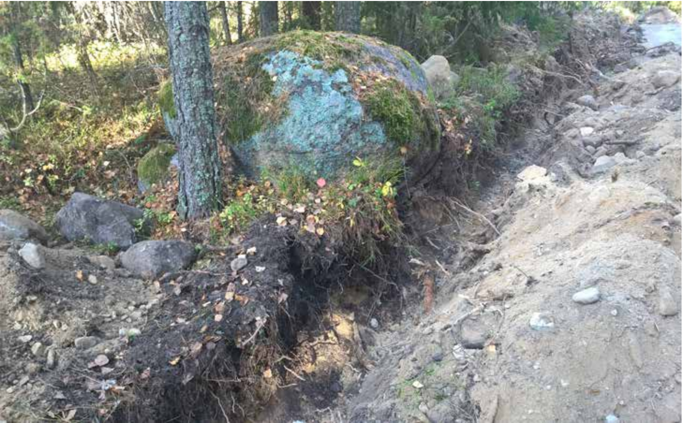
MuTu116021:1. Kappaleen kaakkoisessa osassa ollut suurikokoinen silmäkivi, jonka ympäristössä oli sekä kiviladelman jäänteitä että tummaa multamaata. SW. KU.