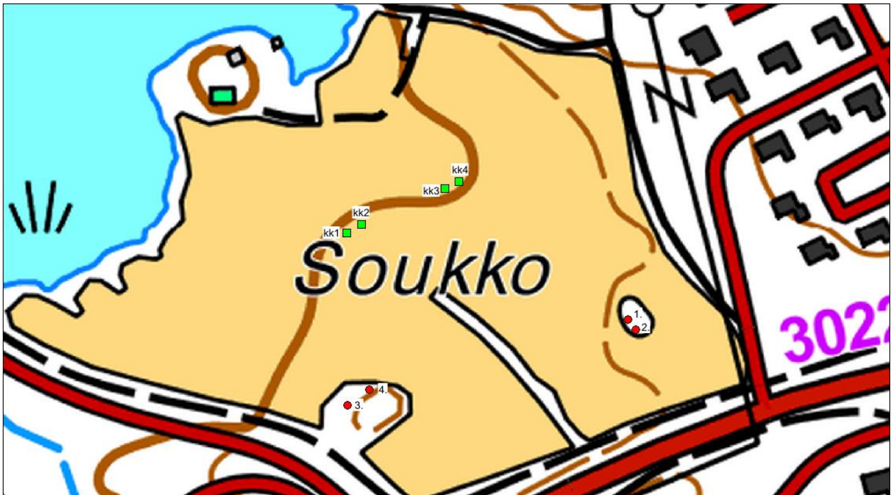
Kartta 6. Kohteet ja koekuopat. Kartalle merkitty alueen kohteet 1-4 punaisella pallolla, sekä koekuopat 1-4 vihrein neliöin. Pohjakartta © Maanmittauslaitos. Lisäykset karttaan: Eva Gustavsson