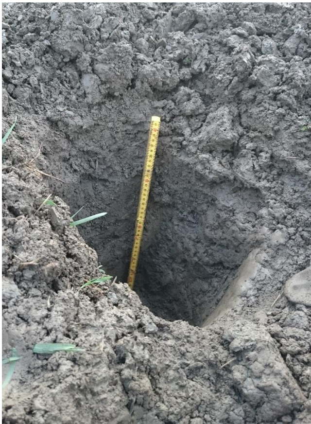
Kuva 9. Koekuoppa 2.