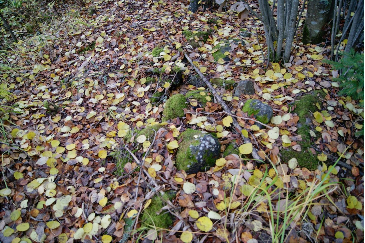
Kuva 7. Kohde Soukko 2. Kuopan vieressä n. 2 metrin päässä itään oleva kivikasa. Liittyvät mahdollisesti kellarirakenteeseen. Kuvattu luoteesta.