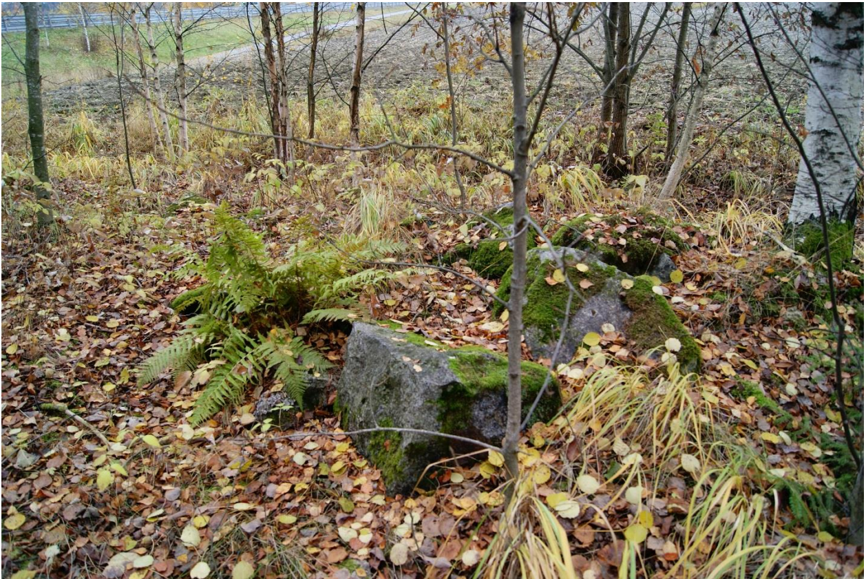
Kuva 5. Kohde Soukko 1. Kivijalkaa paikalla sijainneesta rakennuksesta. Kuvattu etelästä.