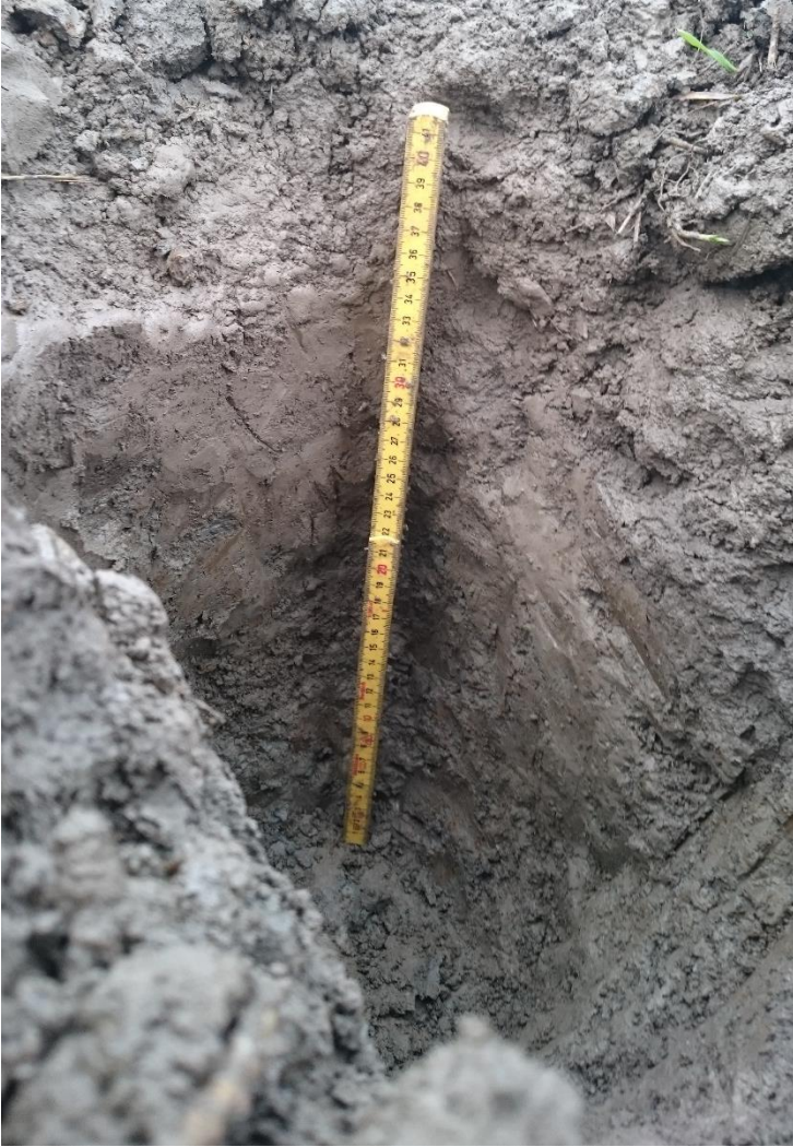
Kuva 10. Koekuoppa 3.