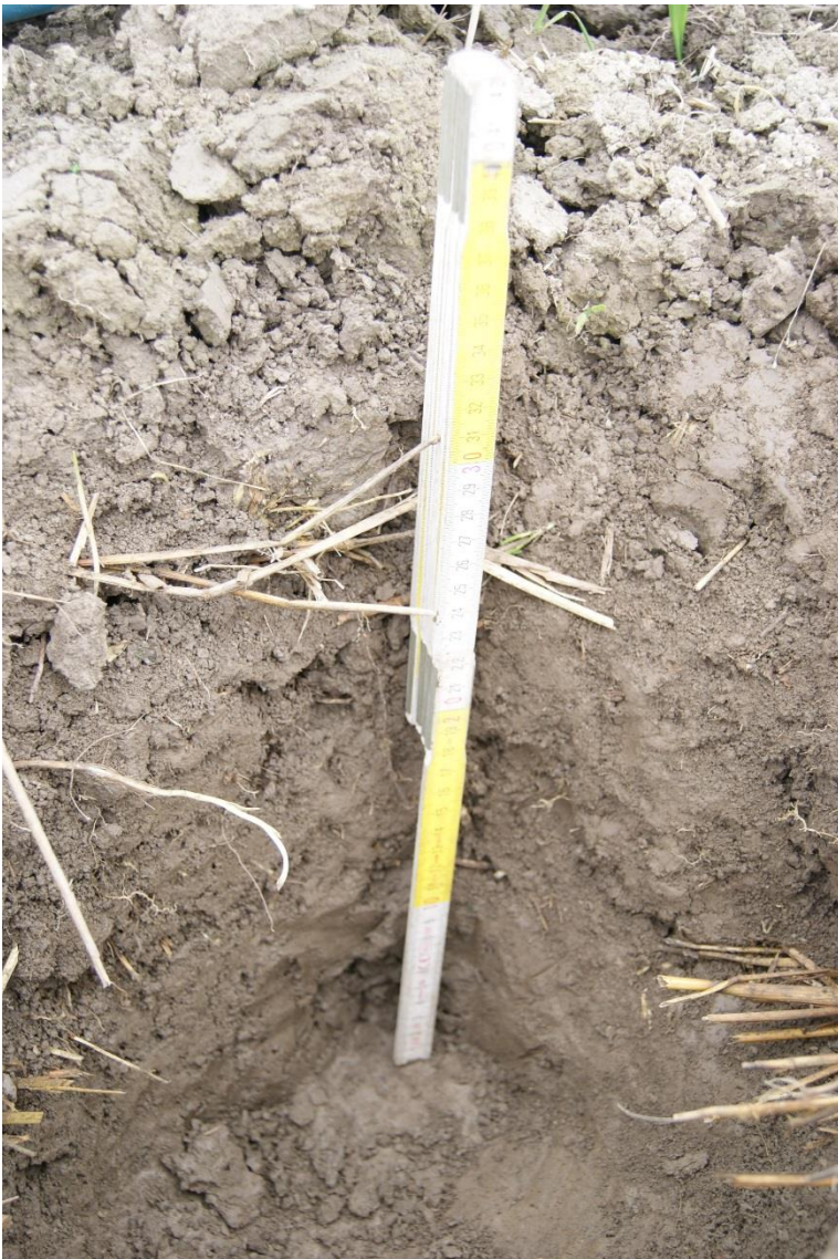
Kuva 8. Koekuoppa 1.