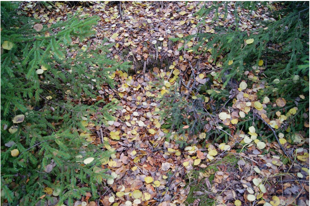
Kuva 6. Kohde Soukko 2. Rakennuksen raunioiden lähellä sijaitseva n. 1,5x2,5m kokoinen kuoppa. Kuopassa on osin kiviä päällä. Mahdollinen kellarikuoppa. Kuvattu Lounaasta.