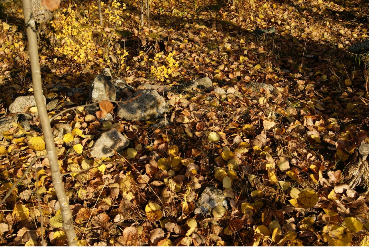
Kuva 2. Kohde Soukontie 1. Pieni lehtien peittämä röykkiö. Kuvattu lännestä.