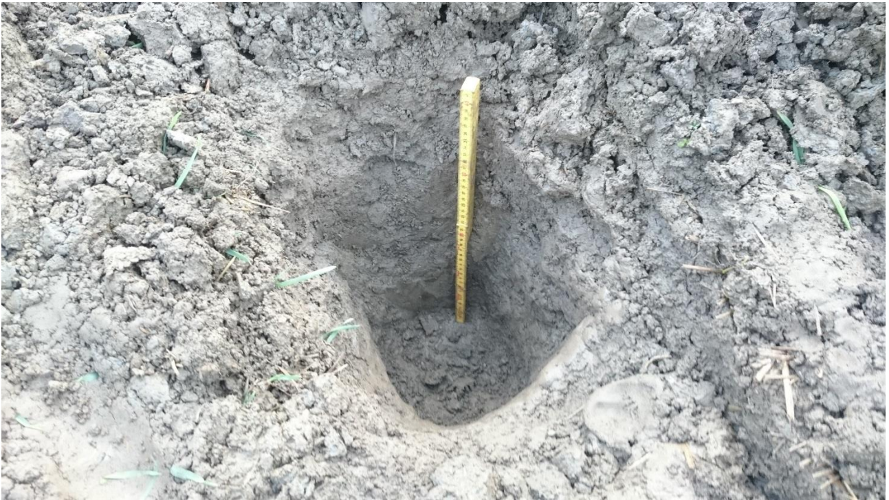
Kuva 11. Koekuoppa 4.