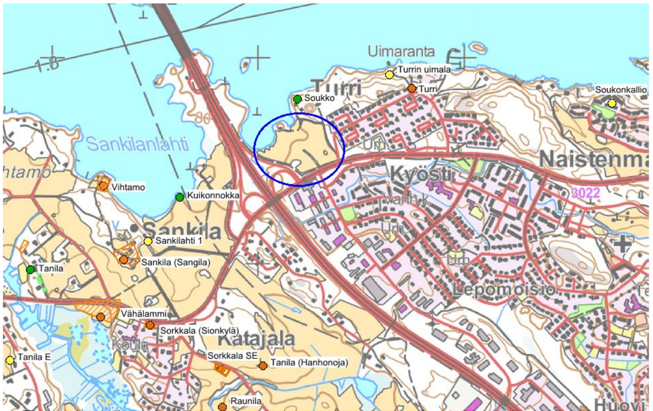
Kartta 2. Kartta inventointialueesta (sinisellä merkityn alueen sisällä), sekä lähistön muinaisjäänneksistä ja löytöpaikoista. Oranssit pallot ja alueet osoittavat kiinteitä muinaisjäänneksiä, keltaiset pallot mahdollisia muinaisjäänneksiä ja vihreät pallot löytöpaikkoja. Pohjakartta © Maanmittauslaitos 2015. Lisäykset karttaan: Eva Gustavsson