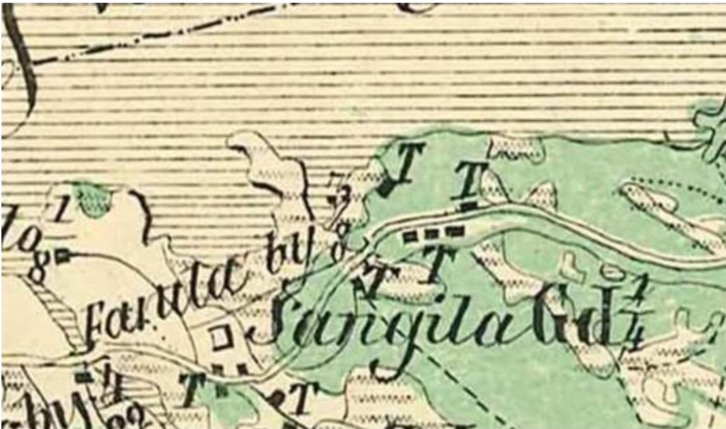
Kartta 5. Ote Kalmbergin kartasta vuodelta 1855. Tutkitun alueen itälaidalla on sijainnut torppa (kuvassa keskellä).

Kalmbergin vuoden 1855 kartassa näkyy tutkitun alueen itälaidalla torpan paikka. Torpan tarkka paikannus kartan perusteella on mahdotonta, eikä kohteita 1 ja 2 (Soukontie 1 ja Soukontie 2) voi varmuudella yhdistää torppaan. Torppa on sijainnut paikallaan myös varsin lyhyen aikaa 1800-luvulla, koska sitä ei enää näy Senaatin kartassa.