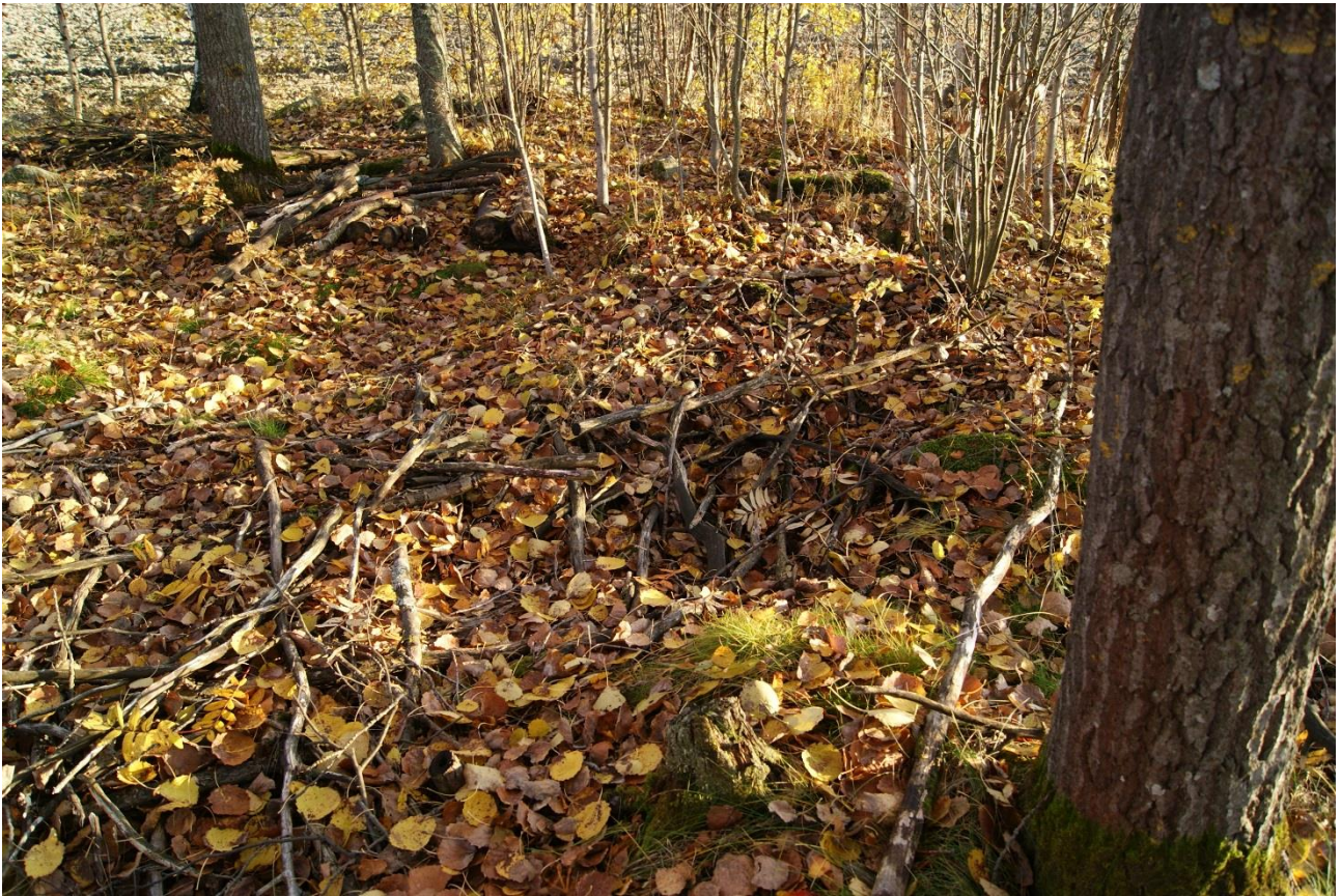
Kuva 3. Kohde Soukontie 2. Pieni kuoppa maassa. Mahdollisesti nauriskellari. Kuvattu pohjoisesta.