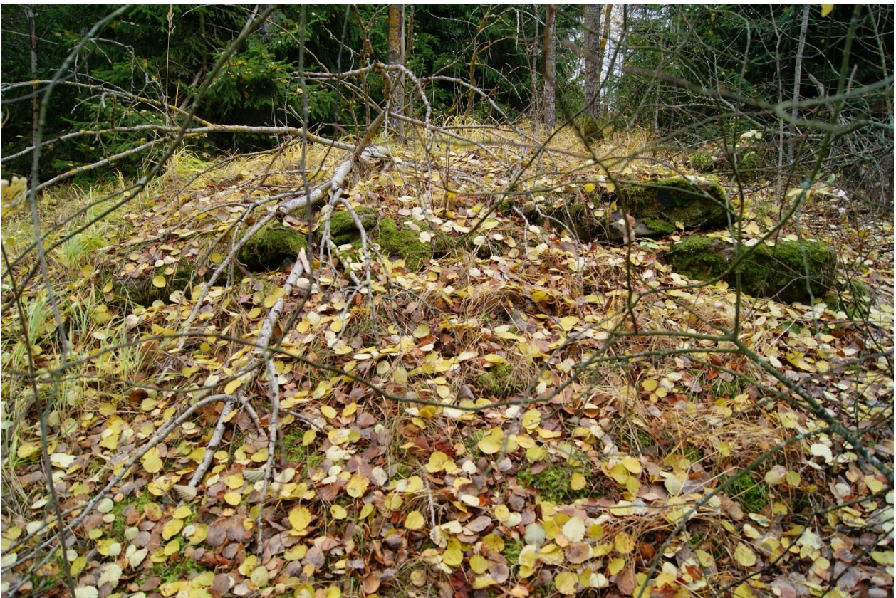
Kuva 4. Kohde Soukko 1. Kivisiä rakenteita paikalla sijainneesta rakennuksesta. Kuvattu koillisesta.