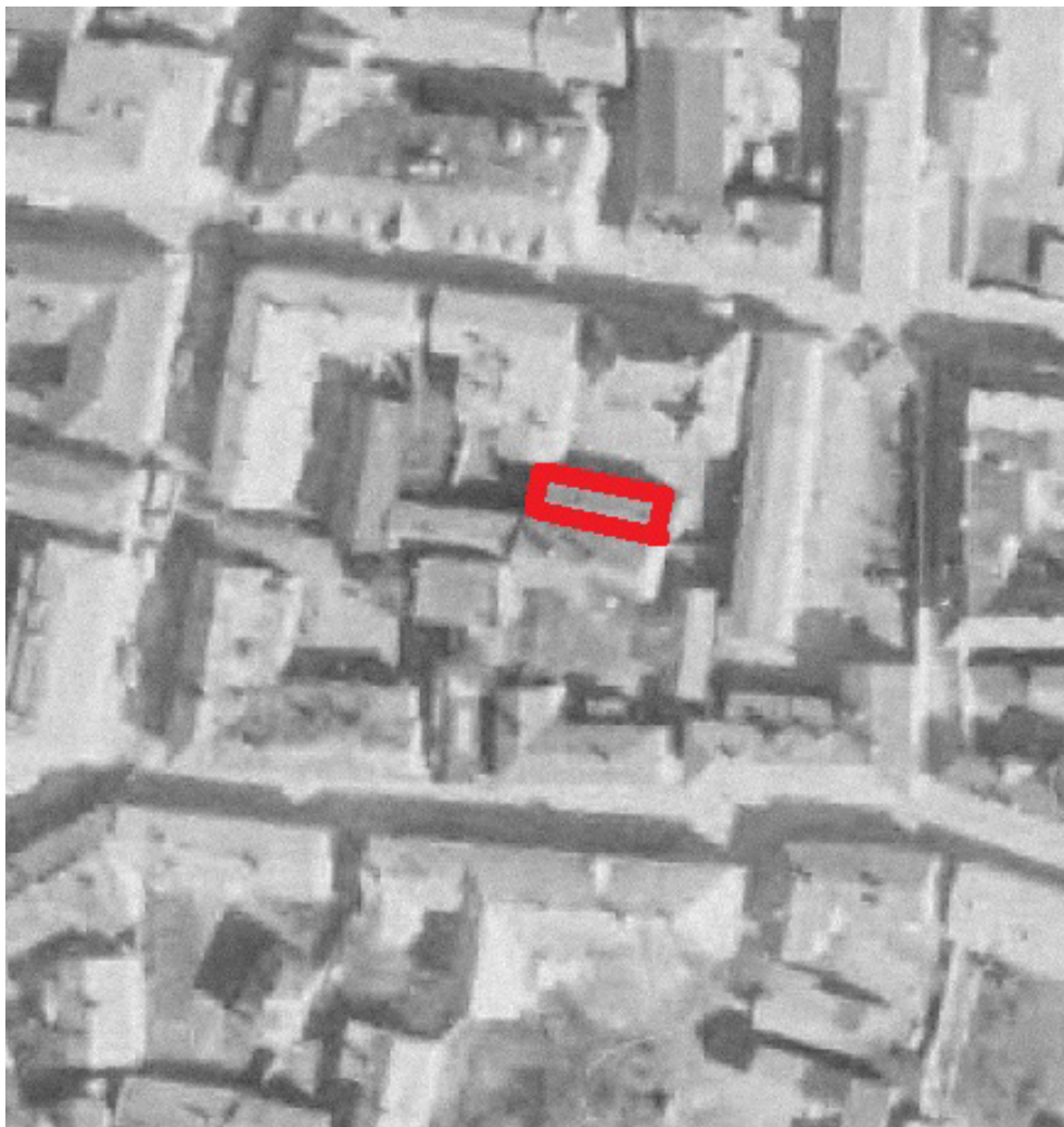
Kuva: pihan purettu ulkorakennus vuoden 1965 ilmakuvassa (Rauman kaupunki)

Liitteet: Kartat (Kartat 2 ja 3) Kuvat (MuTu116022Dg_2-5)