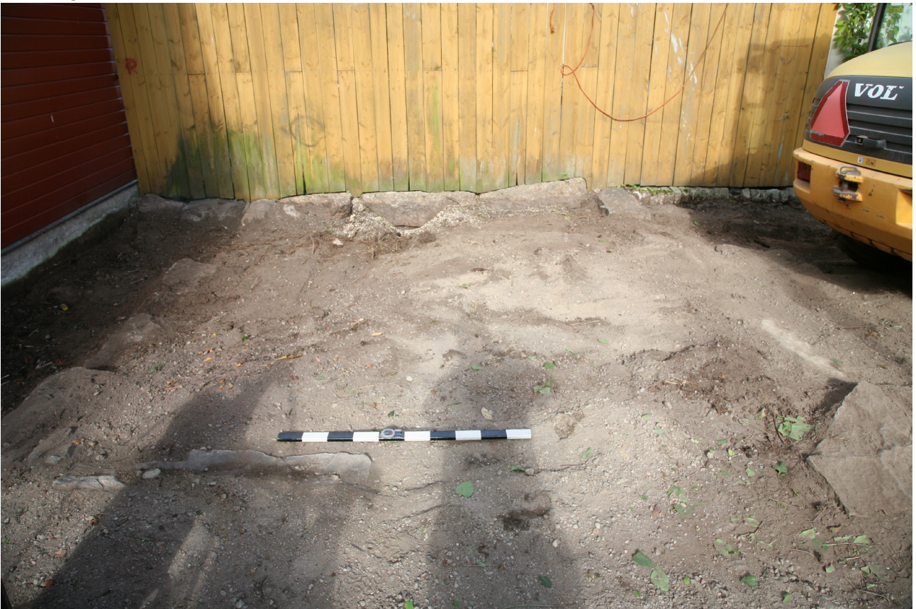
MuTu11622Dg_2. Havaitun kivijalan länsipääty. Idästä, 2.8.2016