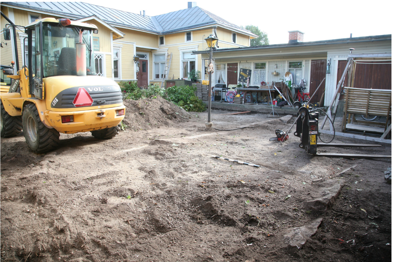
MuTu11622Dg_3. Havaittu kivijalka esillä ja kivijalan ympäristö pihakaivuun tavoitesyvyydessä. Lounaasta, 2.8.2016, J. Haarala