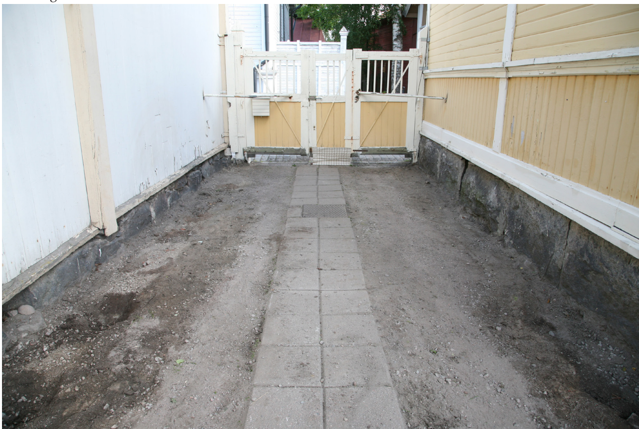
MuTu11622Dg_4. Pihan portti ja kulkureitti kaivuun tavoitesyvyudessa. Etelästä, 2.8.2016, J. Haarala