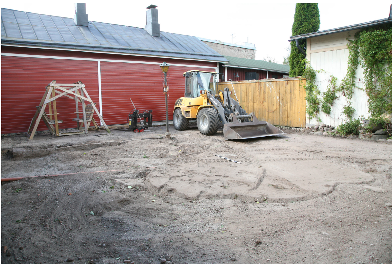
MuTu11622Dg_5. Valvottu alue pihakaivuun tavoitesyvyudessa. Koillisesta, 2.8.2016, J. Haarala