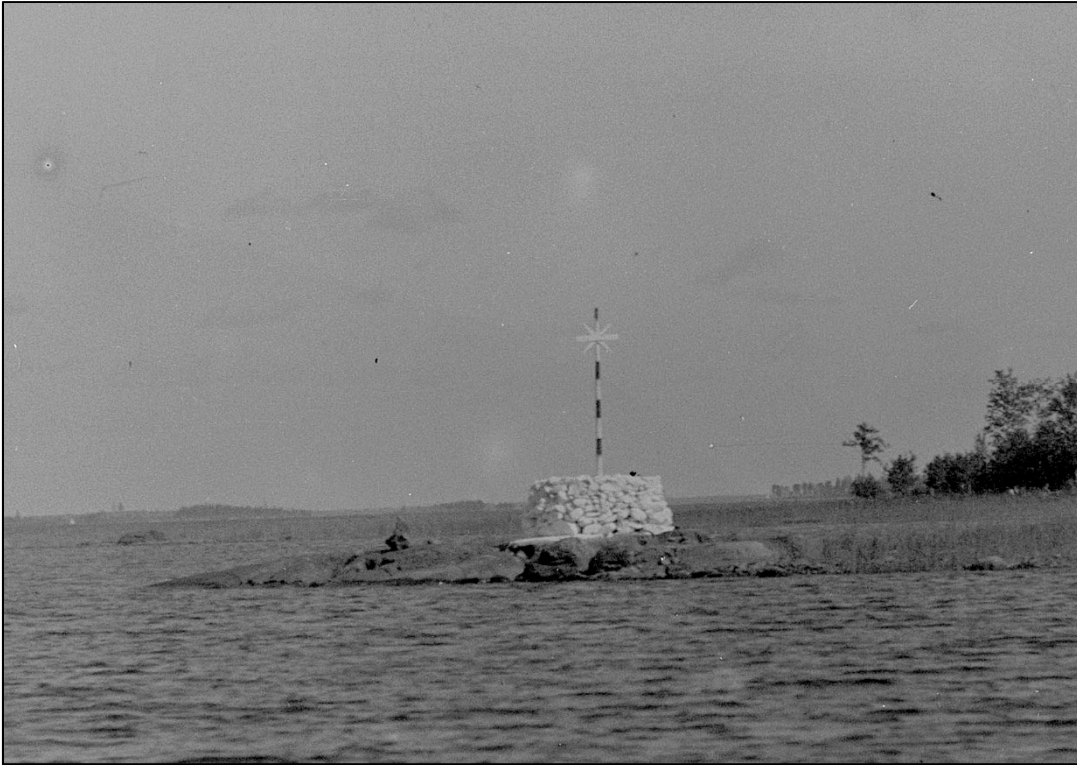
Kuva 3. Kohosaaren kummelin huippumerkkinä on risti ja nelisakarainen tähti. Osasuurennos kuvasta: "Kohokaita (Kaitasaari); kummeli kivellä kaislikossa länsilounaasta nähtynä."