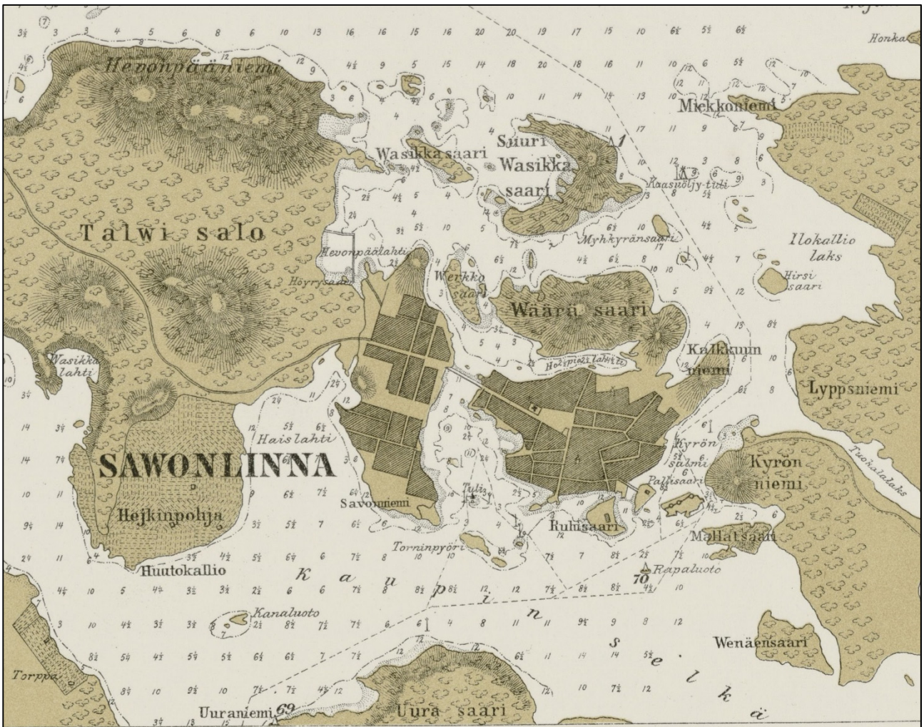
Kuva 1. Savonlinnan vesiä vuoden 1892 merikartassa. Karttaan on merkitty kummeleita Suureen Wasikkasaareen, Rapaluotoon sekä Uuraniemeen. Satamaan johtavan väylän varteen sekä Miekkonniemen lounaispuolelle on merkitty tulet. Osa kartasta: Purje-väylä kartta Saimaan vesillä Pienestä Kollonniemestä Savonlinnaan. 1892. Kansalliskirjaston Doria-julkaisuaineisto http://www.doria.fi/handle/10024/91976 .