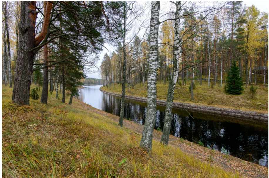
Kuva 5. Kirkkotaipaleen kanava.

Kanavakohteiden inventointiin yhteensä 64 kohdetta, niistä 2 oli Kymijoen vesistöalueen kohteita. Kohteista yli puolet, 39 kpl, kuuluu Saimaan kanavan kohteisiin. Kanavakohteet olivat iän ja tyyppinsä puolesta hyvin monipuolisia, vanhimmat ovat 1700-luvulta ja uusimmat 1960-luvulta. Kanavissa on historiallisia, 1800-luvulla rakennettuja ja tyylikkäällä kiviverhoilulla varustettuja kohteita, kuten Mälkiän sulku Saimaan kanavalla tai Kirkkotaipaleen kanava Mikkelissä, mutta myös hyvin pelkistettyjä 1900-luvun uittokanavia.