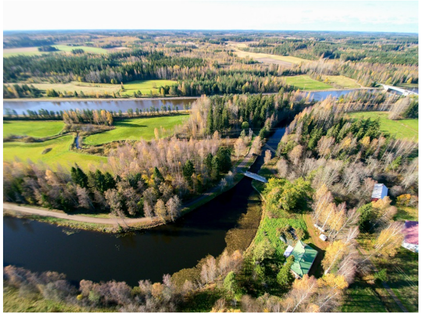
Kuva 4. Saimaan uusi ja vanha (edessä) kanava Kansolan kohdalla.

Saimaan kanavalta työ eteni Vuoksen vesistön itälaitaa Etelä-Savon kautta Pohjois-Karjalaan. Tällä alueella inventoituihin kohteisiin kuului mm. Suvorovin kanavat 1700-luvun lopulta. Liperissä ei päästy inventoimaan Tikankaivannon kanavaa, joka sijaitsee saarella ja inventointia ei tehty veneellä kuten vuonna 2015 vaan autolla.