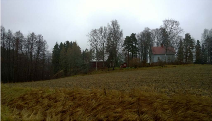
AKDG 4905:4. Risteyksen lounaispuolella oleva talo, etelästä.