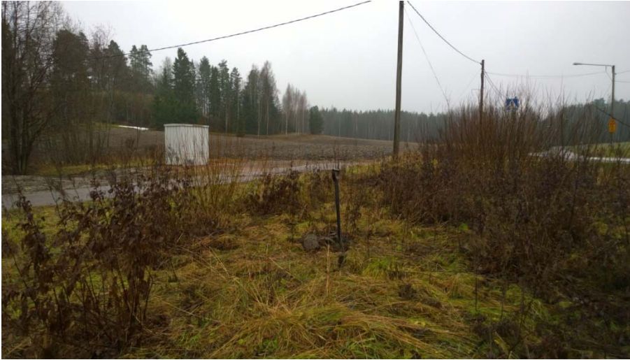
AKDG 4905:8. Koekuoppa 3, luoteesta.