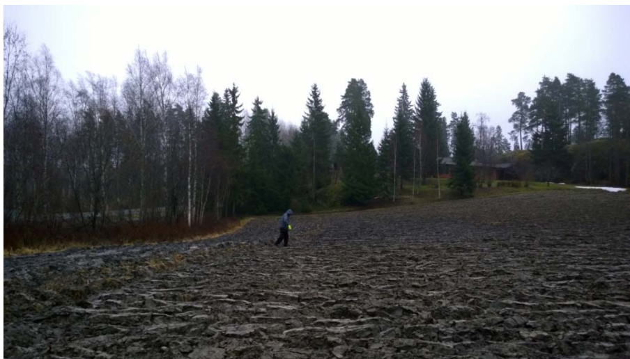
AKDG 4905:1. Pellon pinnan tarkastelua löytöpaikalla, luoteesta.

Lähimmät kivistä asuinpaikat tunnetaan Röylän laaksosta noin kaksi kilometriä Nedergårdista etelään, mutta Luukin-Lahnuksen alueella on muutamia muitakin ennestään tunnettuja kivistä löytöpaikkoja Nedergårdin lisäksi. Luukin nelisivuisen poikkikirveen (KM 5715:3) löytöpaikka on 2,1 km länteen Nedergårdista ja Luukin kivistä teräkatkelman (KM 17139) löytöpaikka noin 1,2 km länteen Luukin kartanon pelloilla.