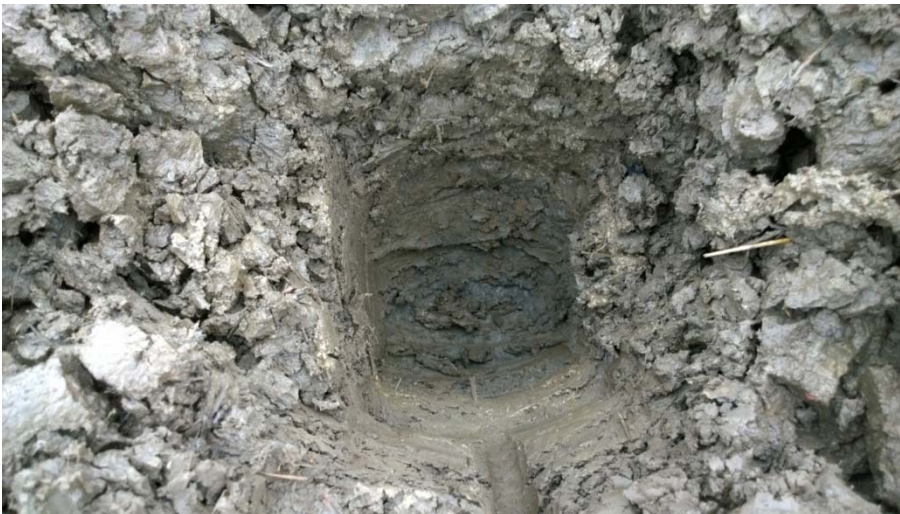
AKDG 4905:6. Koekuoppa 1.

Kenttätyö suoritettiin jalkautumalla maastoon ja tarkastamalla koko suunniteltu liittymän alue. Inventointialue oli hyvin pieni ja tarkastus oli tehty muutamassa tunnissa. Inventoinnin yhteydessä avoimet peltoalueet Vihdintien eteläpuolella tarkastettiin irtainten löytöjen varalta ja maastoon tehtiin muutamia koepistoja lapiolla (ks. kartta raportin alussa). Pellot osoittautuivat hyvin saviseksi ja märäksi. Löytöpaikka on alavaa peltoa, jossa kyntö ulottuu pohjasaveen saakka. Kivikautisesta asuinpaikasta tai muustakaan toiminnasta ei saatu inventoinnissa havaintoja. Nykyisen peltoalueen ulkopuolelle tehtyjen koe-kuoppien perusteella myös nämä alueet ovat vielä hiljakkoin olleet peltolina. Tämä näkyy myös vanhoilla peruskartoilla. Vihdintien pohjoispuolella maasto oli tasaista pensaikkaa ja suomaista, märkää maata. On hyvin epätodennäköistä, että tällaisessa maastossa olisi kivikautista asuinpaikkaa. On mahdollista, että vasarakirveen puolikas (KM 15800) on kulkeutunut löytöpaikalleen esim. peltotöiden mukana jostain ylempää laaksoa ympäröiviltä mäiltä, jossa asuinpaikan ja muun kivikautisen toiminnan voi olettaa olleen todennäköisempää kuin alhaalla märässä laaksossa.