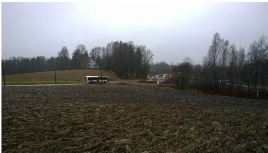
AKDG 4905:3. Yleiskuva vasarakirveen löytöpaikalle, kaakosta.