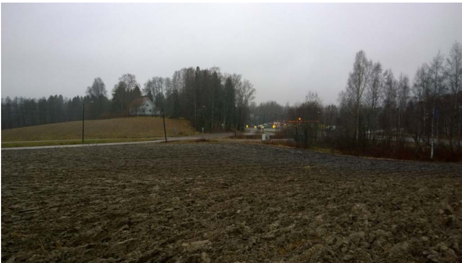
AKDG 4905:2. Yleiskuva vasarakirveen löytöpaikalle, kaakosta.