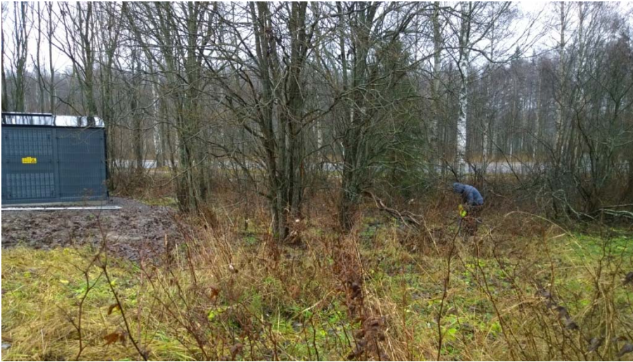
AKDG 4905:9. Koekuop- paa 4 kaivetaan, lou- naasta. Kuvaaja: Petro Pesonen.