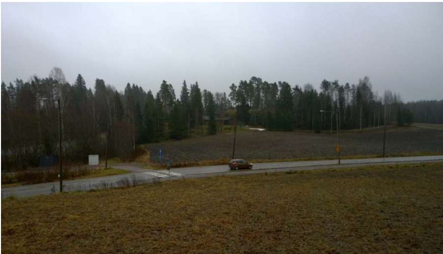
AKDG 4905:5. Vasarakirveen löytöpaikka alhaalla laaksossa, luoteesta.

Vuoden 1958 peruskartalla risteysalue on pääosin peltona, mm. huoltoaseman alue ja Vihdintien eteläpuoli ovat peltoa. Risteyksen koillispuoli on soista lehtimetsää.