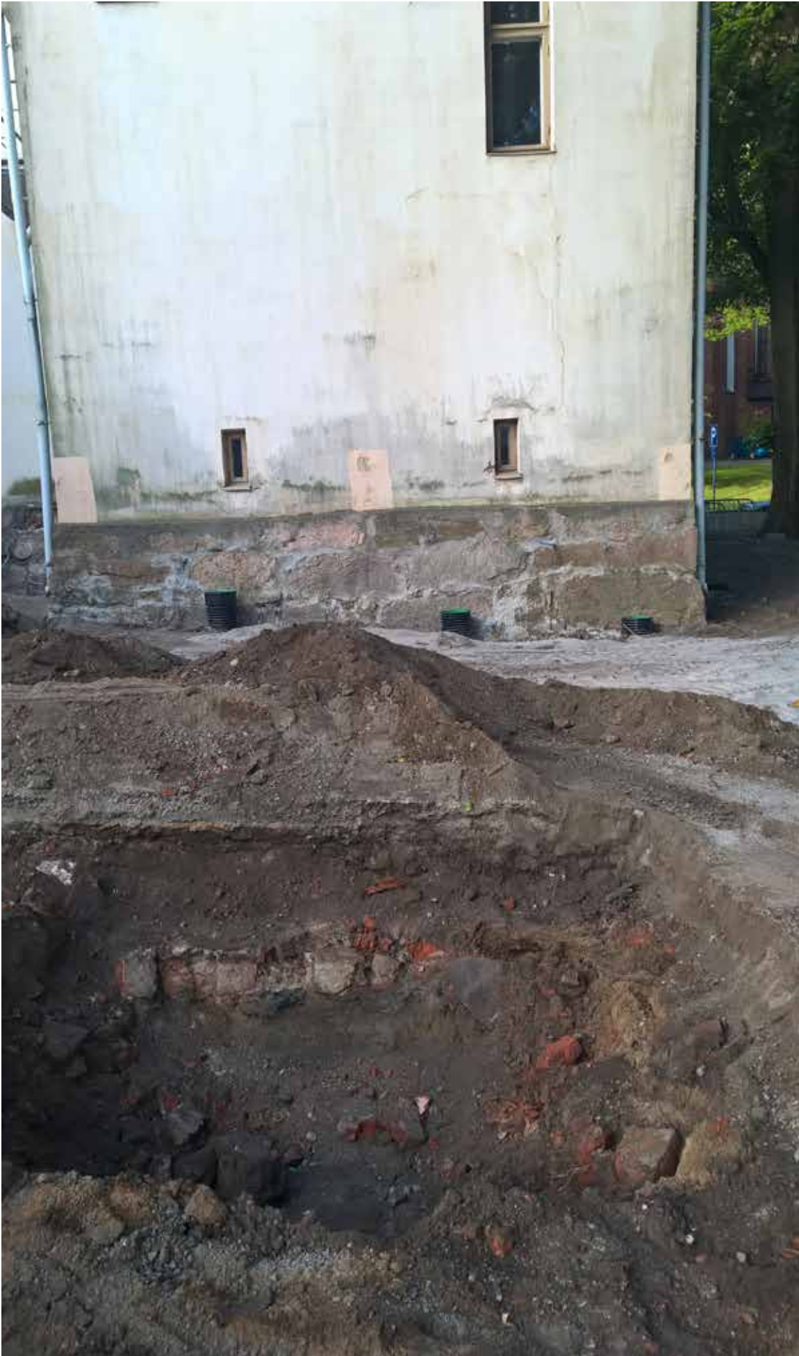
MuTu116017:1. Piha-alueelta esiin tullut tiililadelmä. N. KU. Elokuu 2016.