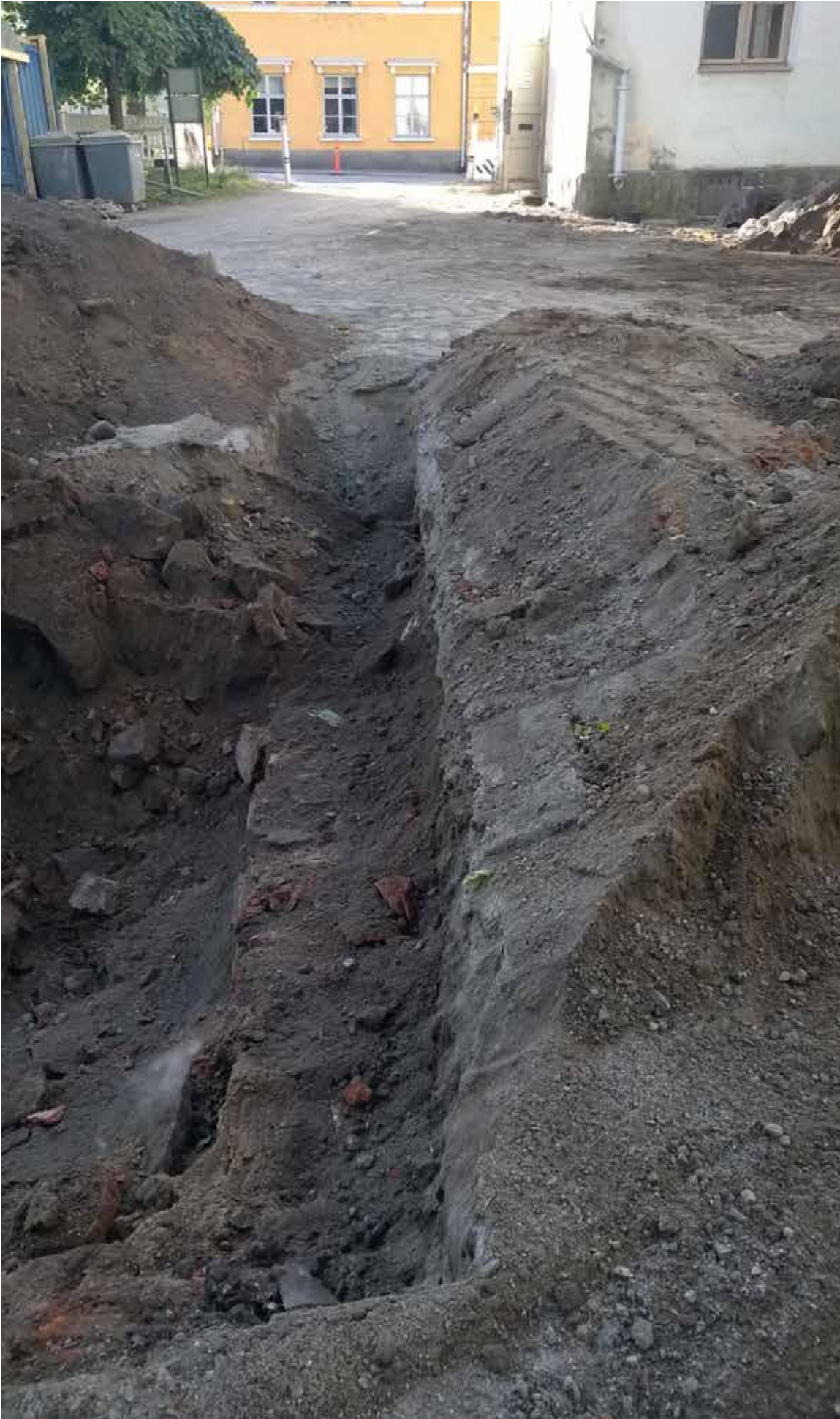
MuTu116017:2. Piha-alueelta esiin tullut tiililadelmä. W. KU. Elokuu 2016.