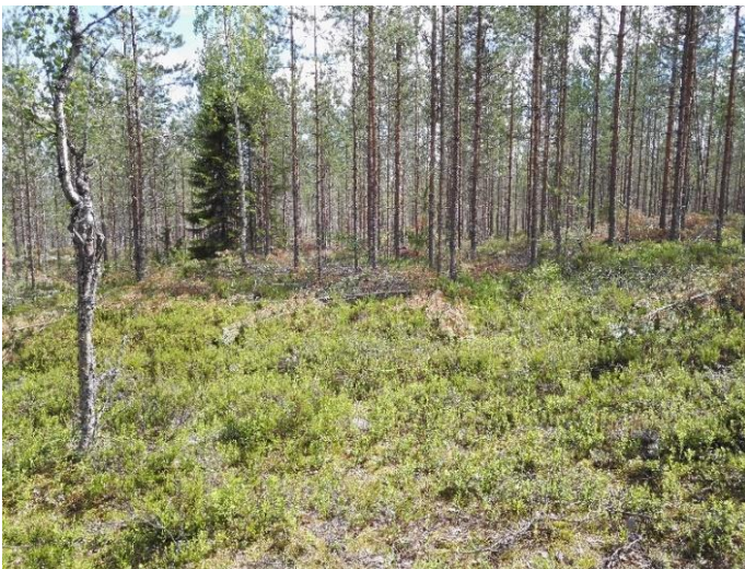
Kuva 1 yleiskuva Ahvenlamminmäen ympäristöstä.

Mäen päällä ja rinteillä kasvaa kuivaa ja kuivahkoa kangasmetsää valtapuuna mänty. Välissä on kuitenkin kosteampia rahkasammalmättäitä, etenkin pohjoispuolella ja mäelle rakennetun mökin läheisyydessä. Maanpinnanmuotojen havainnointia vaikeutti paksu varpu, sammal ja jäkäläkerros. Mäen päälle kulkevan nimeämättömän tien varrella oli nähtävillä useita hiekanottokuoppia. Hiekkaa on otettu tontilta eri ajankohtina ja maanomistajan mukaan pienimuotoinen hiekanotto saattaa jatkua edelleen tarvittaessa. Mikäli alueella on ollut matalia kivistä ladottuja röykkiöitä, osa niistä on voinut jo tuhoutua hiekanoton ja muun maanmuokkauksen yhteydessä.