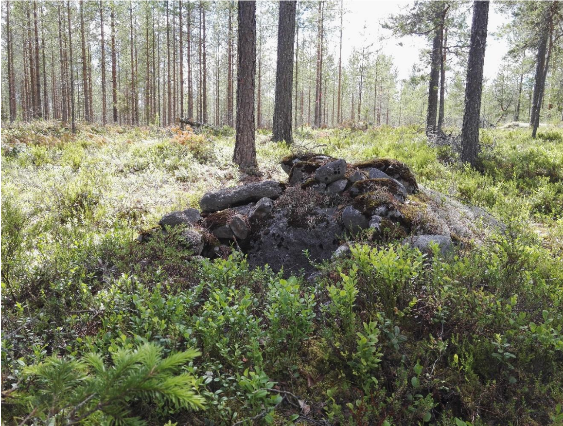
Kuva 3 kiviä suuremman maakiven tai kallion ympärillä ja päällä.