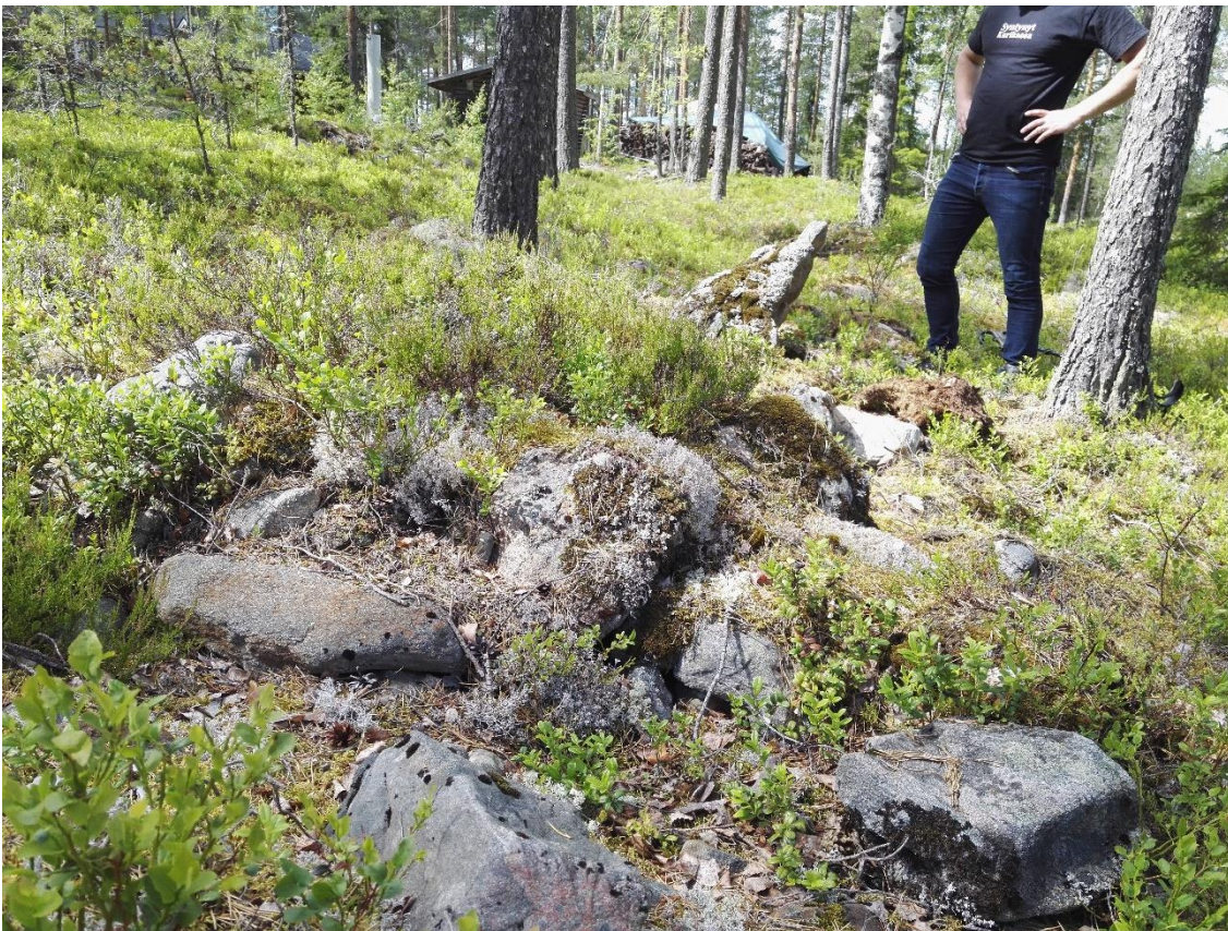
Kuva 4 kiviä näkyvillä muodostaen ehkä soikean latomuksen.