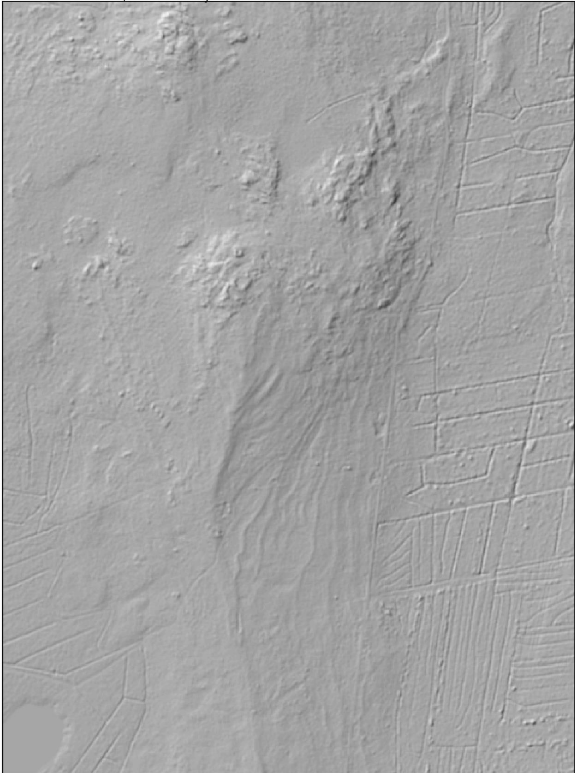
Ahvenlamminmäki, vinovalovarjostettu laserkeilauskuva