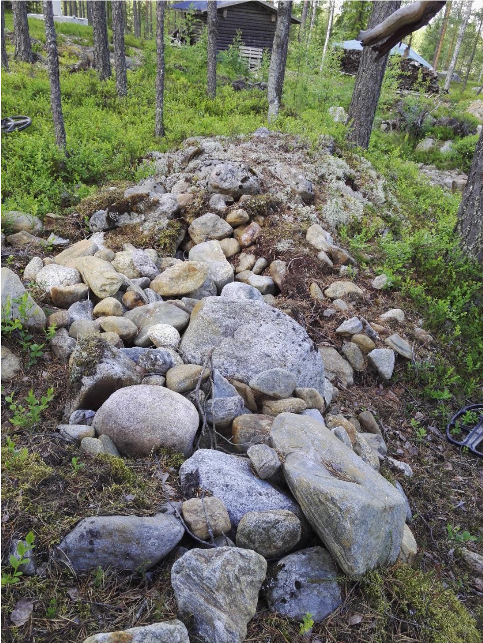
Kuva 2 harrastajien tutkima kivilatamus.

Alueella kasvaa runsaasti sammalta ja varpuja, joten mahdollisten muiden pintaturpeen alle jäävien matalien röykkiöiden havaitseminen on haasteellista. Muutama kohta aivan löytöpaikan vierellä kuitenkin kiinnitti huomiota muodollaan ja näkyvillä kivillä. Toisessa kohdassa (jokunen metri pengotusta röykkiöstä kaakkoon) oli irtonaisia kiviä suuremman kiven ympärillä ja päällä (KUVA 3). Ja lähellä (näköetäisyydellä) löytöpaikkaa oli pystyssä yksi kivi ja sen ympärillä joitakin kiviä näkyvillä sammalten ja varpujen seasta (KUVA 4). Kivet saattoi havaita myös kohdalla käveltäessä ja ne voisivat muodostaa soikean matalan röykkiön. Kummankaan havaitun mahdollisen röykkiön kohdalta ei tullut metallinilmaisimella mitään selkeää signaalia eikä niiden koordinaatteja ole tiedossa (nämä myöhemmin mitatut pisteet eivät jostain syystä tallentuneet karttasovelluksen muistiin). Yleisesti alueelta tuli muutamia epämääräisiä metallisignaaleja sieltä täältä, mutta yhdenkään kohdalla ei alettu kaivamaan mahdollista metallia esiin.