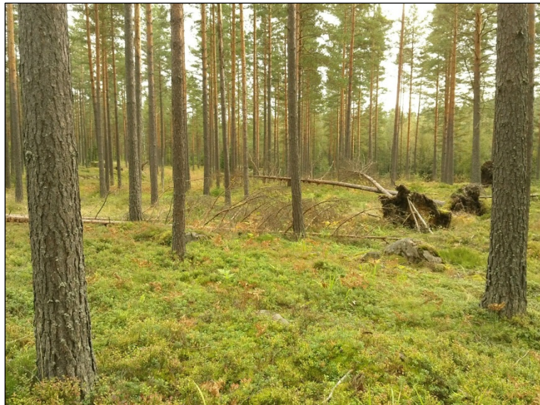
Slätmossenin kaakkoispuoleista maastoa