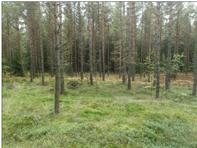
Taustalla tiheämmässä metsässä hiekkamaaperää Högbergetsbergetin eteläpuolella