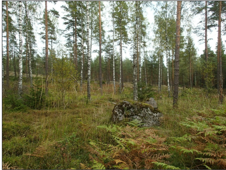
Alueen länsiosaa, kallioiden eteläpuolista rinnettä