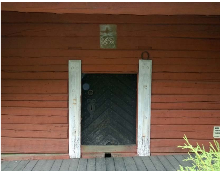
AKDG 5265:11. Vanhan-Laurilan aitan ovi.