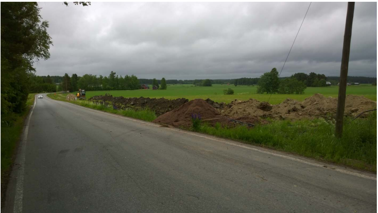
AKDG 5265:16. Valvonnan lopputilanne Vanhan-Laurilan itäpuolella, lännestä.

Viemärikaivanto kaivettiin valvotulla kohdalla kokonaan Katinhännäntien eteläpuolelle. Valvottu osuus oli savipeltoa, lukuun ottamatta Vanhan-Laurilan pihapiiriä, jossa oli pihanurmen alla 20-30 cm savista vanhaa peltomultaa ja sen alla vaalea hietamoreeni. Ainoa perusmaasta poikkeava havainto tehtiin Vanhan-Laurilan pihatiestä 30 metriä lounaaseen. Pihapiirin länsisyryjällä tuli vastaan hiilinen ja nokinen, palanutta kiveä, puusäleitä ja tiiliä sisältävä, noin 30-40 cm:n syvyydelle jatkuva alue muutaman metrin alueella. Vaikuttaa siltä, että kyseessä voisi olla joko tulisijan paikka tai sitten tälle paikalle siivottu tulisijan jäännös. Valvonnassa ei saatu ainoatakaan esinelöytöä.