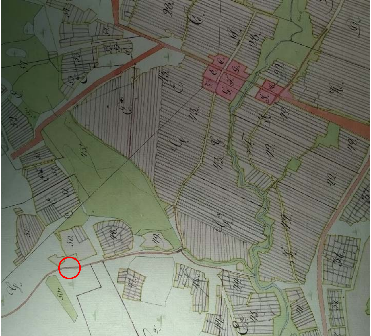
Ote vuoden 1779 tiluskartasta. Vanhan-Laurilan sijainti merkitty punaisella ympyrällä.