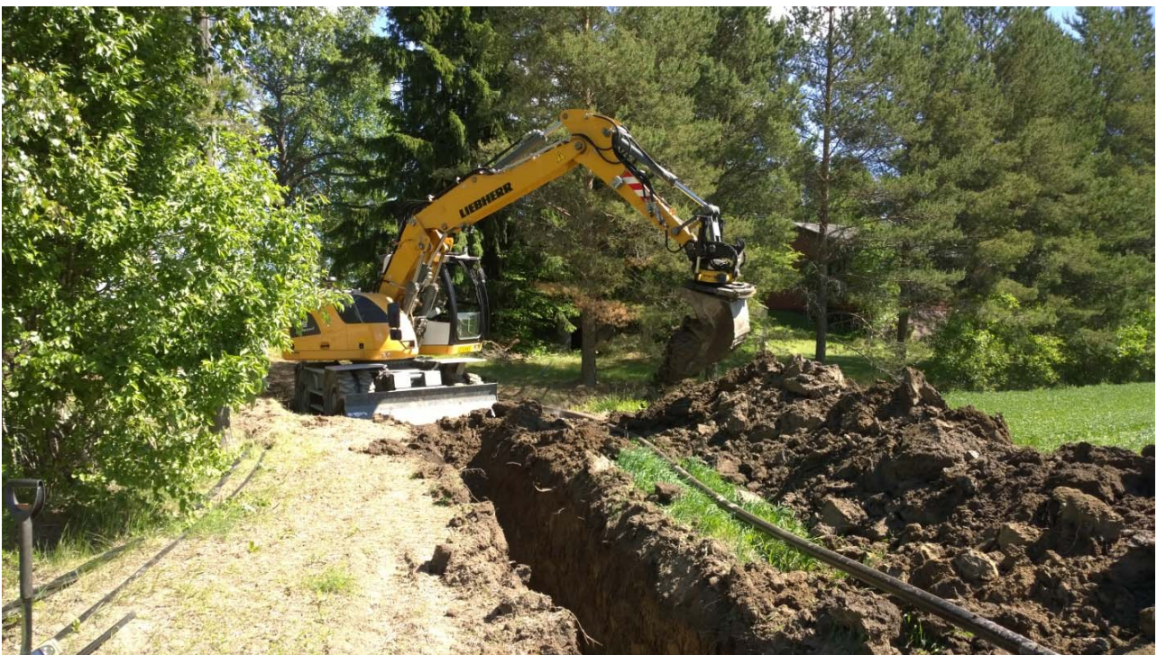
AKDG 5265:8. Kaivu etenemässä Vanhan-Laurilan pihalle, lounaasta.