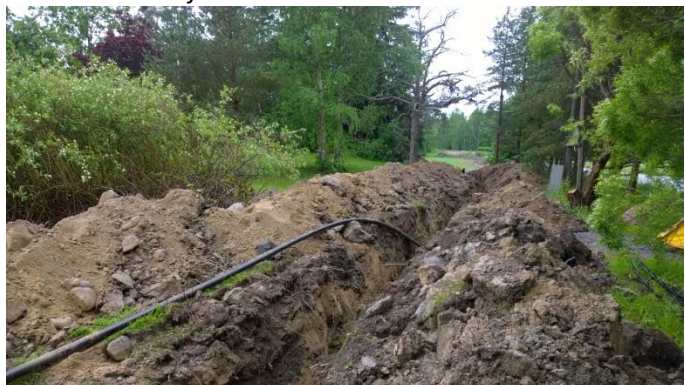
AKDG 5265:13. Kaivanto Vanhan-Laurilan kumpareella, idästä.