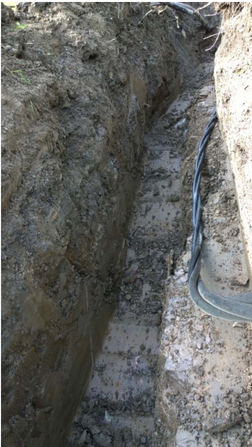
AKDG 5265:2. ”Kaapelihylly”.

Kaivaminen tapahtui kaivinkoneella. Kaivu alkoi valvottavan alueen länsipästä Katinhännän suunnasta tien 2815 (Katinhännäntien) eteläpuolella kohti itäkoillista ja tietä 2812 (Ypäjäntie). Menetelmänä oli kaivaa ensin pois pintamulta ja jatkaa sitten kaivamista syvemmälle, mikäli mullan alla ei näkynyt mitään dokumentoitavaa. Alkuperäisistä tiedoista poiketen kaivantoon tuli tällä kohdalla vesijohto ja sähkökaapeli; vesijohto noin 2 metrin syvyyteen ojan pohjalle ja sähkökaapeli erilliselle ”hyllylle” noin 1,2 metrin syvyyteen. Valvottavalla alueella Vanhan-Laurilan tilalle johtava pihatie kaivettiin poikki, mutta muita teitä ei linjaukselle jäänyt.