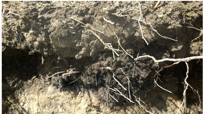
AKDG 5265:9. Palaneiden kivien aluetta ojan profiilissa, etelästä.