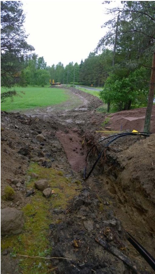
AKDG 5265:12. Katinhännän puoleinen kaivanto on peitetty, kuva Vanhan-Laurilan pihalta, koillisesta.

Valvonnassa ei saatu ainoatakaan esinelöytöä.