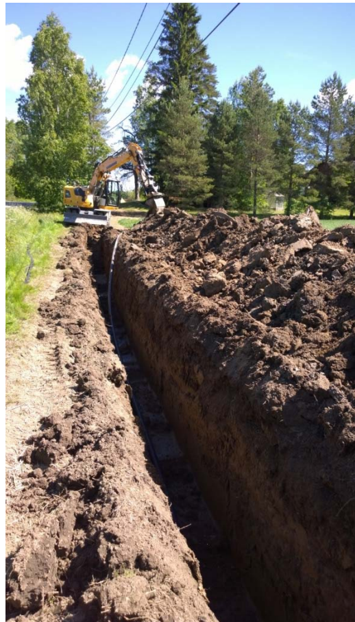
AKDG 5265:5. Kaivu etenee lähelle Vanha-Laurilaa, idästä.