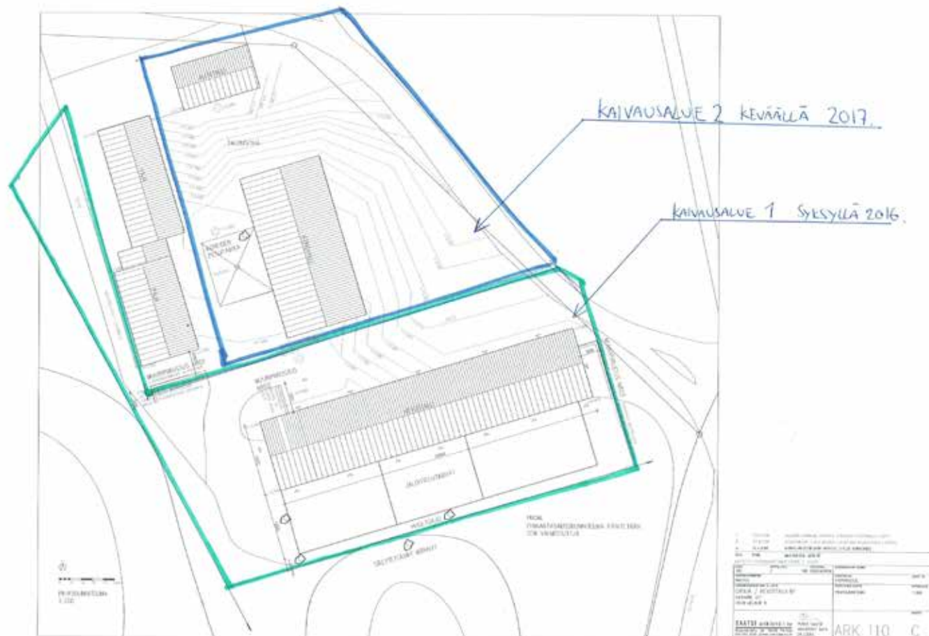
Karttakuva 1. Kuitian kartanon talouspiihan putkikaivantotyöt syksyllä 2016. Alueiden rajaustus pääurakoitsia. Karttapohja Kuitian kartano / Saatsi-arkkitehdit.