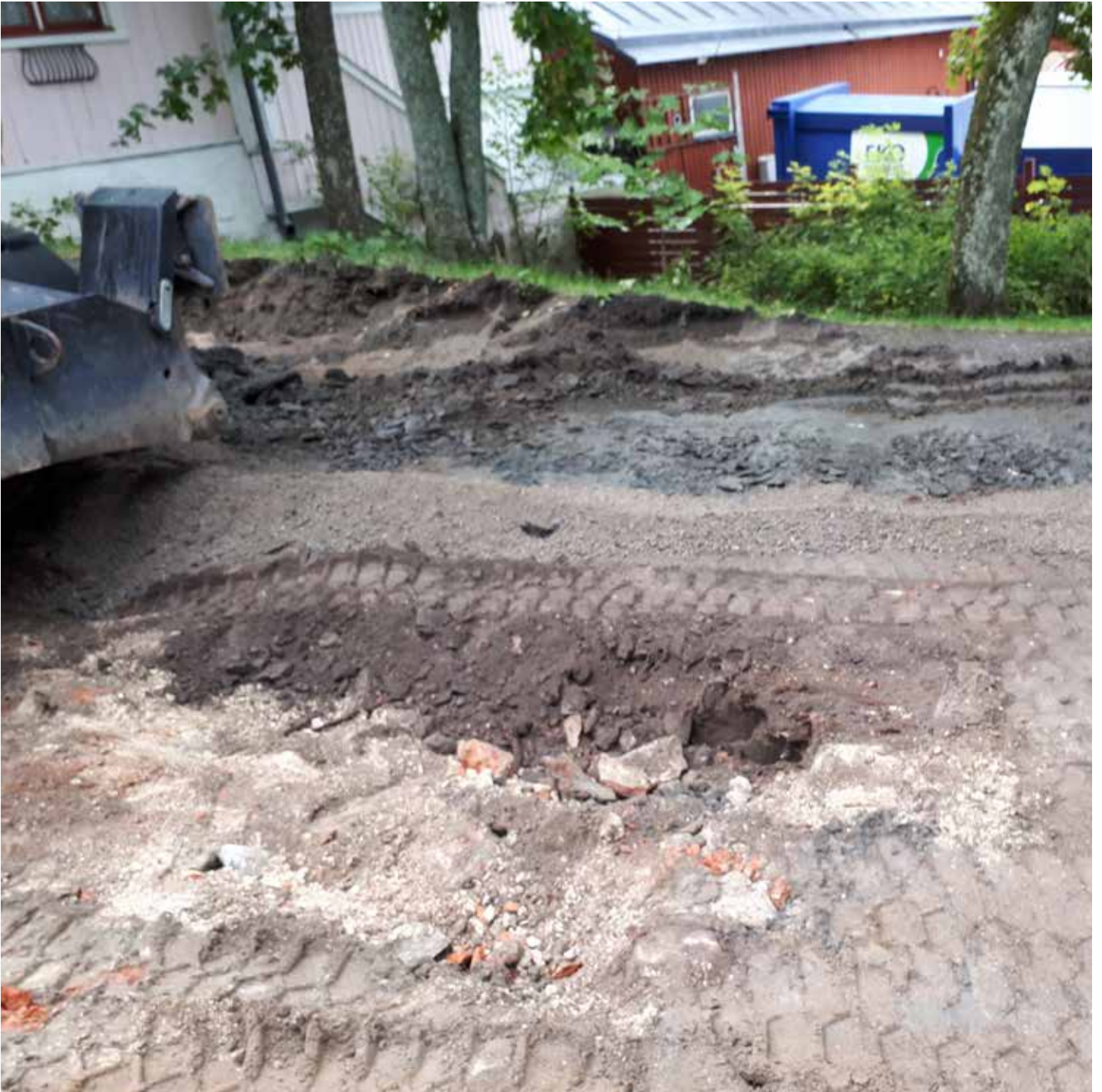
MuTu117028:1. Naantali. Nunnankatu. Kadun pinnan avaustyön yhteydessä esiin tullut tiili- ja laastirakenne. N. Syyskuu 2017. K. Uotila. Muuritutkimus ky.