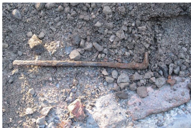
AKDG5211:1 Kaivannon n. 30 cm pitkä rautaesine.