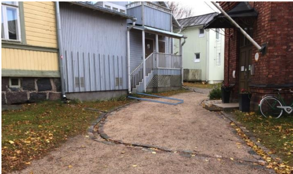
Kaivannon paikka, kuvattu luoteesta.