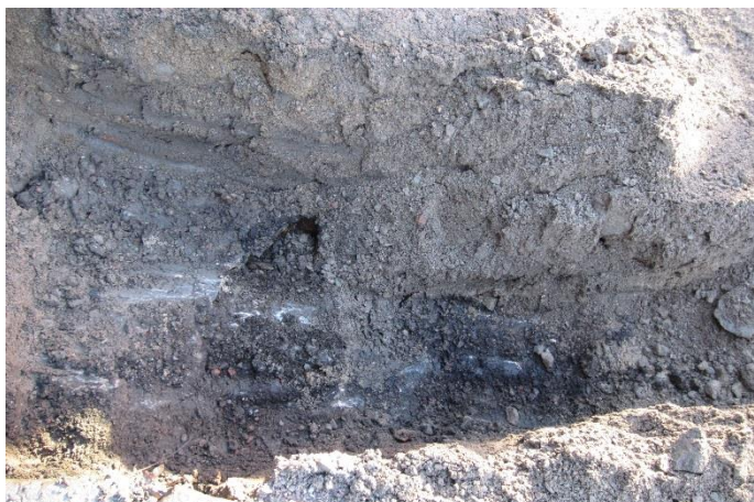
AKDG5211:2. Kaivannon eteläprofiiliin jättemaata.