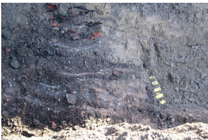
AKDG5211:3. Kaivanto päättyi kaapelikanavaan.