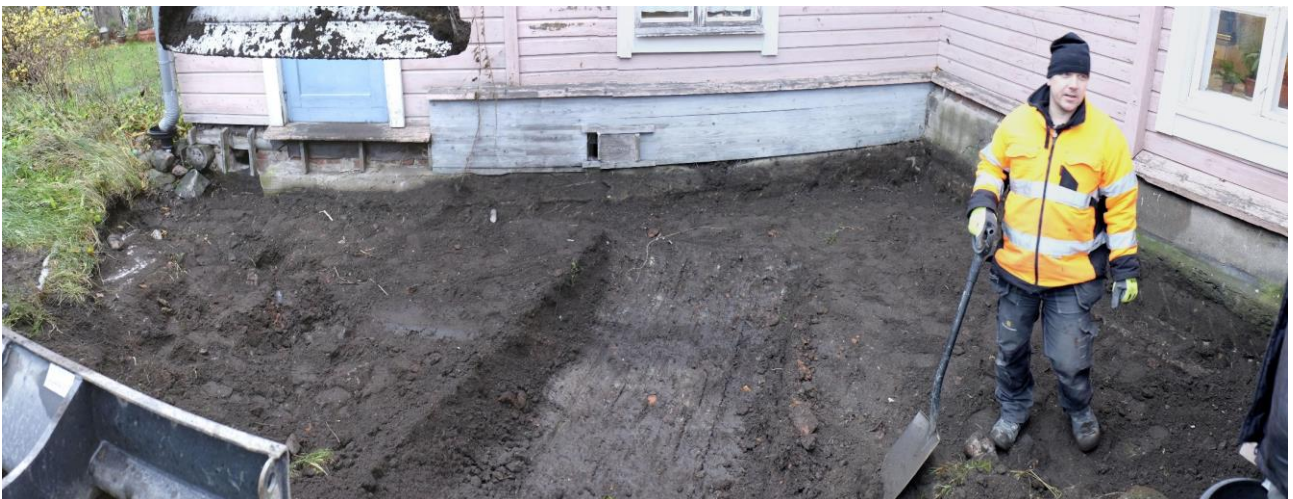
AKDG 5372:1. Panoraamakuva. Pintaturpeen alta paljastui mullan ja soran sekainen maa, jossa oli mm. pieniä tiilenmuruja, kuvattu eteläkaakosta. SV.