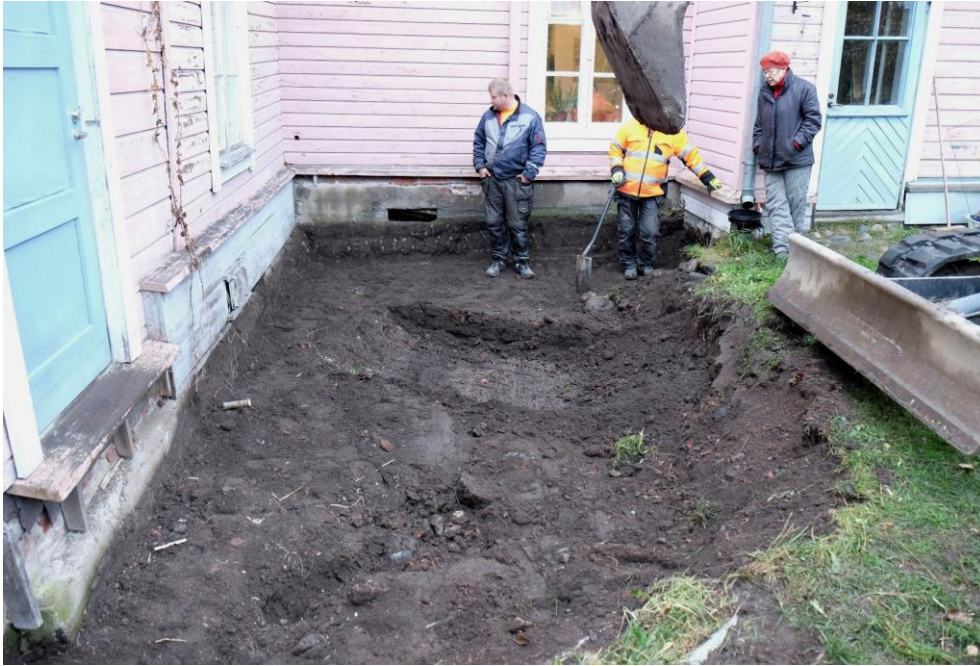
AKDG 5372:2 Panoraamakuva. Pintaturpeen alta paljastui mullan- ja soransekainen maa, jossa oli mm. pieniä tiilenmuruja ja etualalla myös kiviä, kuvattu länsilounaasta. SV.