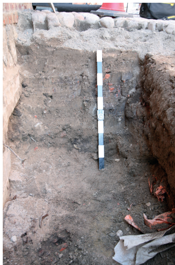
MuTu118018_4. Kaivannon lounaisprofiili. Koillisesta. 26.6.2018