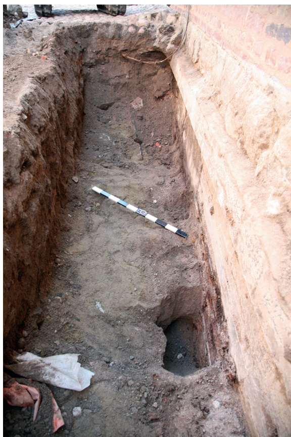
MuTu118018_3. Kaivannon pohja (tarvittava syvyys) sekä seinän vieren tehty koepisto. Lounaasta. 26.6.2018