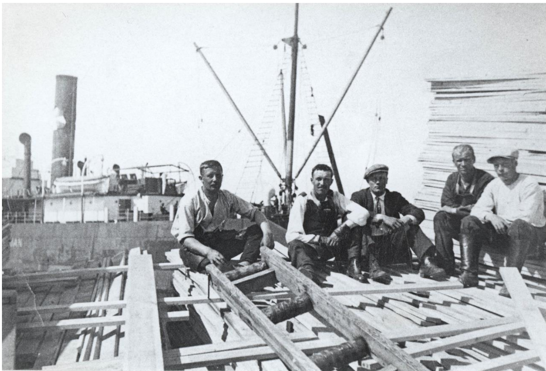
010a. Kuvassa oleva "rullaränni" oli pääasiassa käytössä silloin kun lastattiin sahatavaraa proomuihin, kuva on 20–30-luvulta. Henkilöt tunnistamattomia.

Sahatavaraa on myös lastattu pienimpiin aluksiin sahan rannassa. Vielä 50-luvun alussa on lastaus tapahtunut sahan meren puoleisella laiturilla.