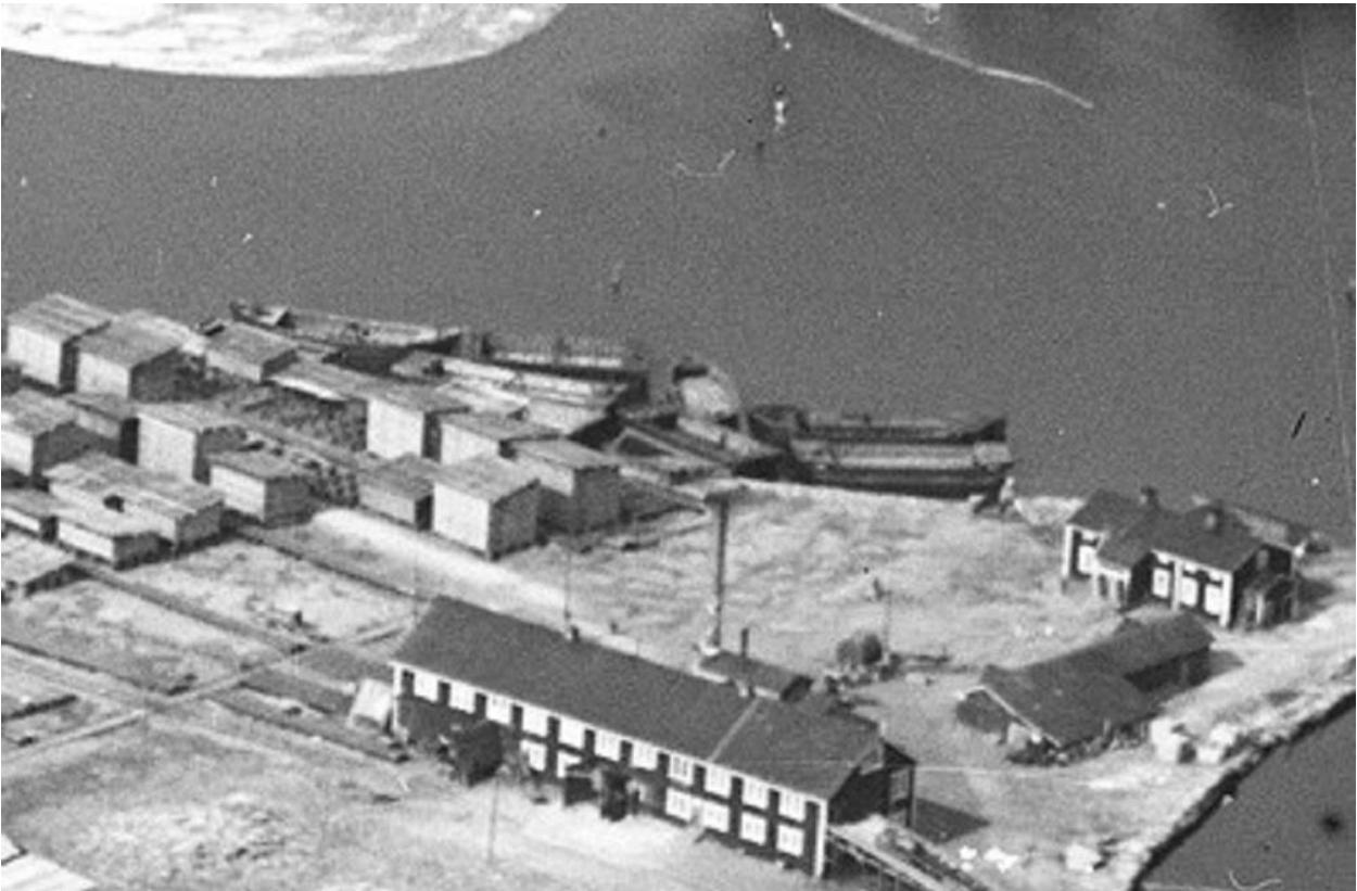
Kuva 13. Proomuja sahan Potin puoleisella lastauspaikalla vuonna 1930 (Ilmavoimamuseo 2017).