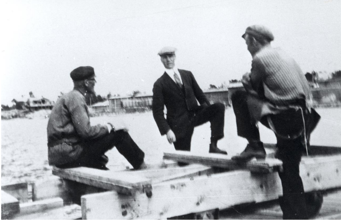
022b. Sataman alueella on varastoitu ja tarhattu monen eri sahan tavaraa odottamassa laivausta. Kuva on otettu Ykspihlajassa, Kajaani Oy:n tarhalla 25.6.1928.