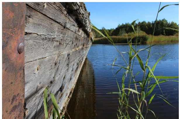
Kuvat 2-6. Ehjempänä säilyneen proomun yksityiskohtia.