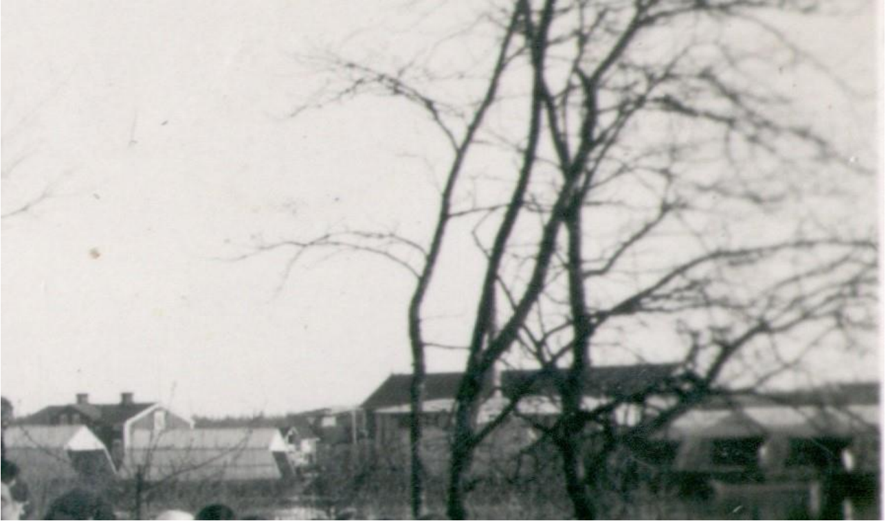
Kuva 15. Ykspihlajan proomuista on ollut myös laudoilla katettu versio (KHRM 2018).