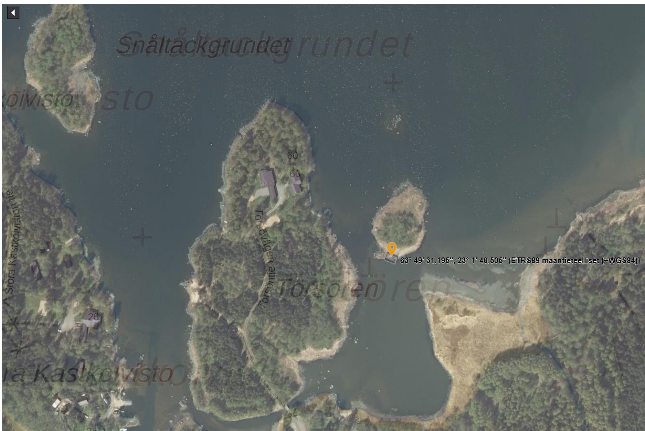
Kuva 1. Sijainti ilmakuvassa ja karttapohjalla (MML 2018).

Sijainti: 1.pintahylky 63°49'31,196" 23°1'40,506" (ETRS89 ~WGS84) 2.vedenalainen rakenne