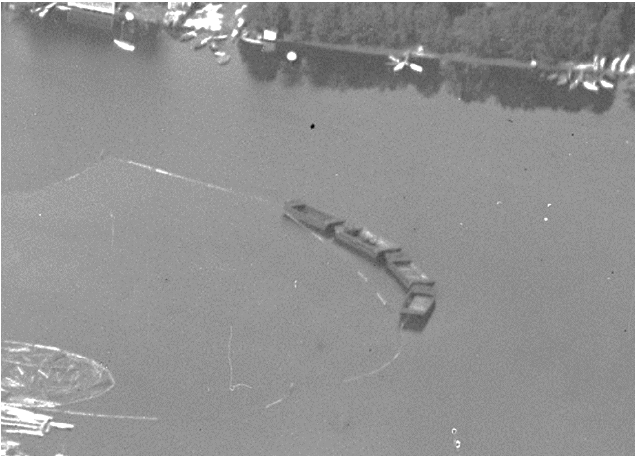
Kuva 12. Sahan proomuja Potissa vuonna 1930. (Ilmavoimamuseo 2017).

Torsörenissä nykyään nähtävillä olevat proomut ovat olleet Anttiroikon (2018) mukaan hylättynä jo 1940-luvun loppupuolella.