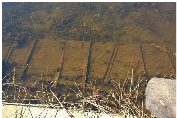
Kuvat 9-11. hajonneen proomun yksityiskohtia.