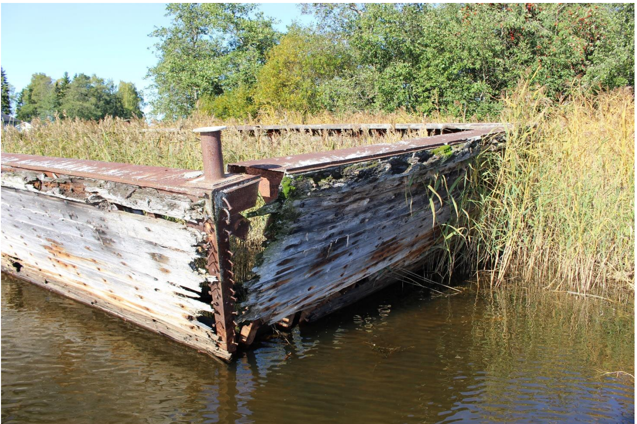
Kuva 1. Ehjempänä säilynyt proomu.

Hajonneempi proomu on päämitoiltaan toisen kaltainen, kyljet ovat kuitenkin irronneet ja makaavat pohjaristikon vieressä veden alla hiekalla. Osa kylkirakenteesta on kuivalla maalla ja noin kahdenkymmenen metrin päässä etelään päin on vielä havaittavissa yksi irrallinen osa. Vaikuttaa siltä että rakennetta on purettu ja osa siitä on kuljetettu pois alueelta.