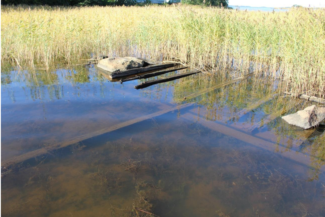
Kuva 7. Osittain veden alla oleva ja hajonnut proomu.