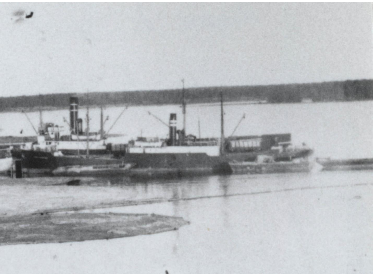
Kuva 14. Proomuja laivan kylkikiinnityksessä Ykspihlajan satamassa (KHRM 2018).