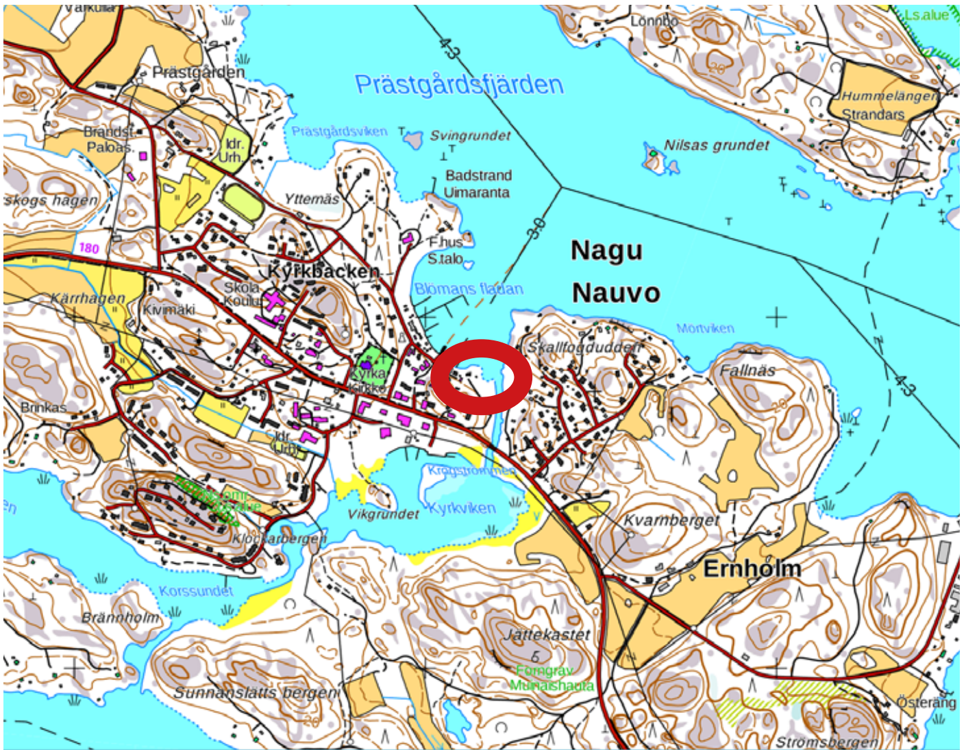
Kartta. Tutkimuskohde yleiskartassa. Karttapohja MML.