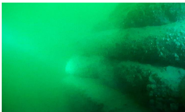
Hirsiarkun yläosaa ja pyöröhirsi