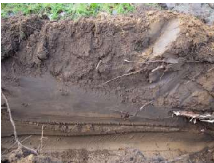
Kuva 10. Tyypillinen sekoittunut hiesumaannos kaivetulla kaapelilinjauksella.