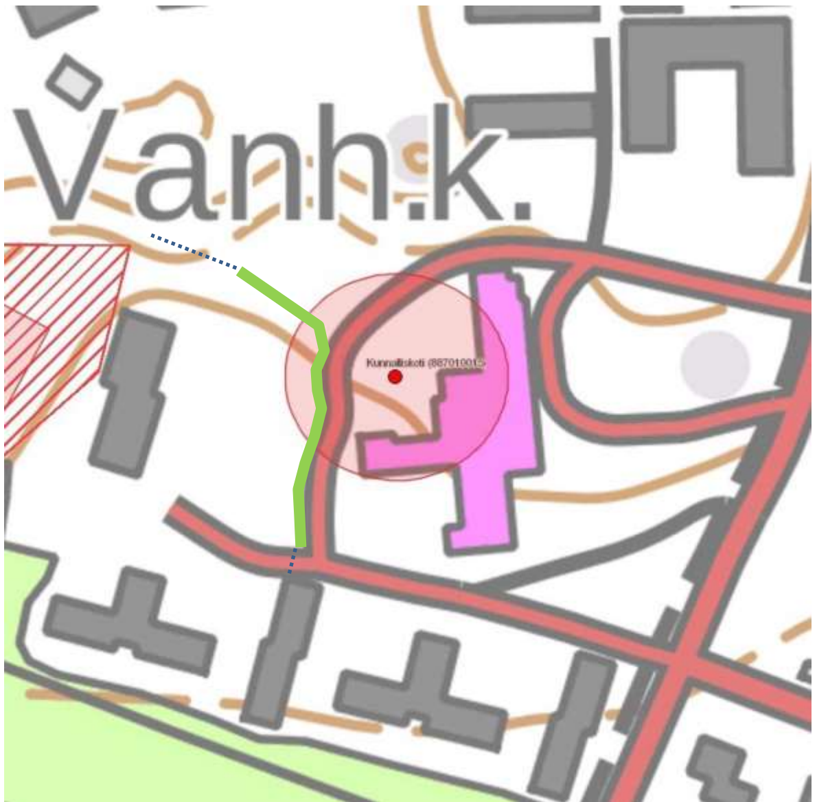
Kuva 10. Kohteen Kunnalliskoti länsipuolella kulkevan ja valvotun maakaapelilinjan sijainti merkitty kartalle vihreällä viivalla. Pohjakartta © Maanmittauslaitos 12/2017.

Valvottu kaapelireitti kulki pohjoisosassa vanhainkodin ja sen länsipuolisen rivitalon välissä sijaitsevan nurmikentän pohjoislaidassa. Maannos oli täällä hiesua noin 20-30 cm paksun multakerroksen alla. Vanhainkodin länsipuolella maakaapelilinja sijoittui vanhainkodin vieressä kulkevan tien länsireunaan, kohtaan, jossa sijaitti jo ennestään joitakin maakaapeleita. Maannos oli sekoittunutta läpi koko valvotun linjauksen. Valvonnan yhteydessä ei havaittu merkkejä kiinteästä muinaisjäännöksestä.