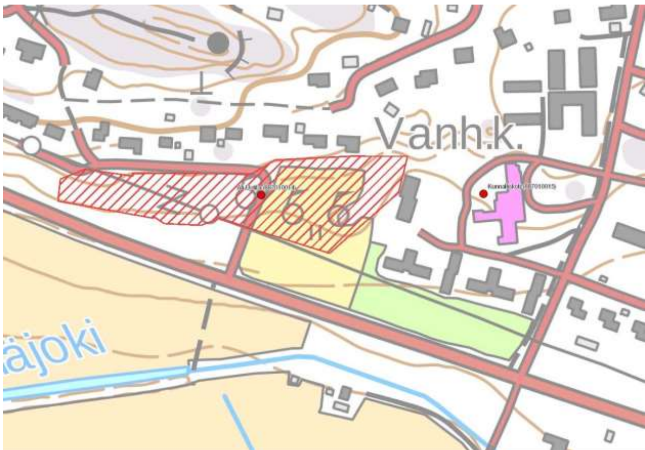
Kuva 2. Kohteiden Ali-Uotila ja Kunnalliskoti sijainti muinaisjäännösrekisterin mukaan. Pohjakartta © Maanmittauslaitos 12/2017. Ei mittakaavassa.