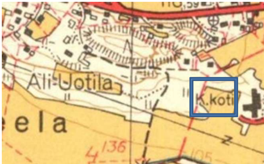
Kuva 8. Linjauksen itäpään sijainti merkitty kartalle sinisellä laatikolla. Peruskartta vuodelta 1959 © Maanmittauslaitos, lisäykset Kirsi Luoto 2017.