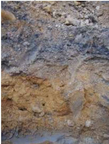
Kuva 13. Sekoittunutta maannosta tien länsireunassa. Kuvattu lännestä.