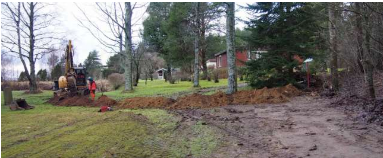
Kuva 9. Valvottua maakaapelilinjausta Ali-Uotilan muinaisjäännösalueen itäosassa. Kuvattu idästä.