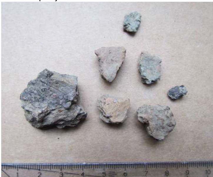
Kuva 4. Rautakauden tyyppin saviastian palasia (KM 41244: 6) koekuopasta 37.

Kohde sijaitsee Uralan kirkosta 700 m kaakkoon. Kiven- ja maansekaiset rökkiöt sijaitsevat kuivatun Vanhajärven pohjois-osan harjun etelärinteessä. Ali-Uotilan rökkiöt ovat osa Vanhajärven luoteispäässä sijainnutta rautakautista kalmistoa, joka on ollut noin 300 m pitkä, järven rantaa noudatteleva vyöhyke. Ali-Uotilan rökkiöitä on tutkittu kaivauksin useaan otteeseen: Vuonna 1954 tutkittiin Kuulaanmäellä hautarökkiö 1. Vuonna 1960 Ali-Uotilan haasta löydettiin 21 rökkiötä, joista kolme eteläisintä oli hävitetty tilustietä levennettäessä. Vuonna 1960 tutkittiin tuhotun rökkiön 3. pohja, ja rökkiö entisöitiin. Vuonna 1961 tutkittiin hautarökkiöt 20 ja 21 sekä rökkiö A vuonna 1962 tiehankkeen vuoksi. Rökkiön 21 vierestä löytynyt kuppikivi on siirretty tien pohjoislaitaan. Pylväskatajaa kasvava hautarökkiö 2 on tutkittu lähes kokonaan ja entisöity vuonna 1989. Kalmiston pohjoispuoliselle asuntoalueelle vievän tien linjausta on muutettu niin, että tie tulee lähes suoraan etelästä. Tietä on myös levennetty niin, että se rikkoo lähimpien rökkiöiden reunoja. Kohde Kunnalliskoti (887010015) kuuluu samaan kalmistoon. Kesällä 2017 muinaisjäännösalueella tehtiin maakaapelointihankkeeseen liittyvä koekaivaus, jossa selvitettiin sijaitseeko suunnitellulla linjauksella kiinteää muinaisjäännöstä. Linjauksen itäosasta, nyt valvotulta alueelta löydettiin rautakautisia saviastianpaloja sekoittuneesta kontekstista.