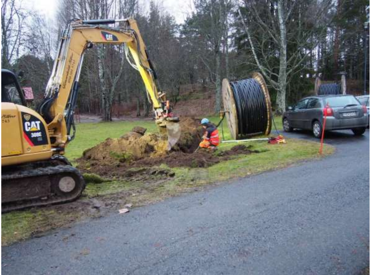
Kuva 6. Maakaapelikaivantoa kaivetaan Kunnalliskodin röykkiön itäpuolelle, tien viereen. kohdalla kulki jo ennestään maakaapeleita. (Kuva: Urjala Ali-Uotila ja Kunnalliskoti 2017: 2)

(Maanrakennus Silfver Oy) edustaja oli asiasta etukäteen yhteydessä Pirkanmaan maakuntamuseon arkeologi Ulla Lähdesmäkeen, joka ohjeisti asiassa sähköpostitse.