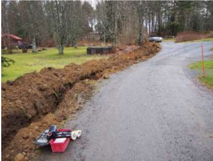
Kuva 11. Maakaapelikaivanto tien reunassa kohteen Kunnalliskoti länsipuolella. Kuvattu etelästä.