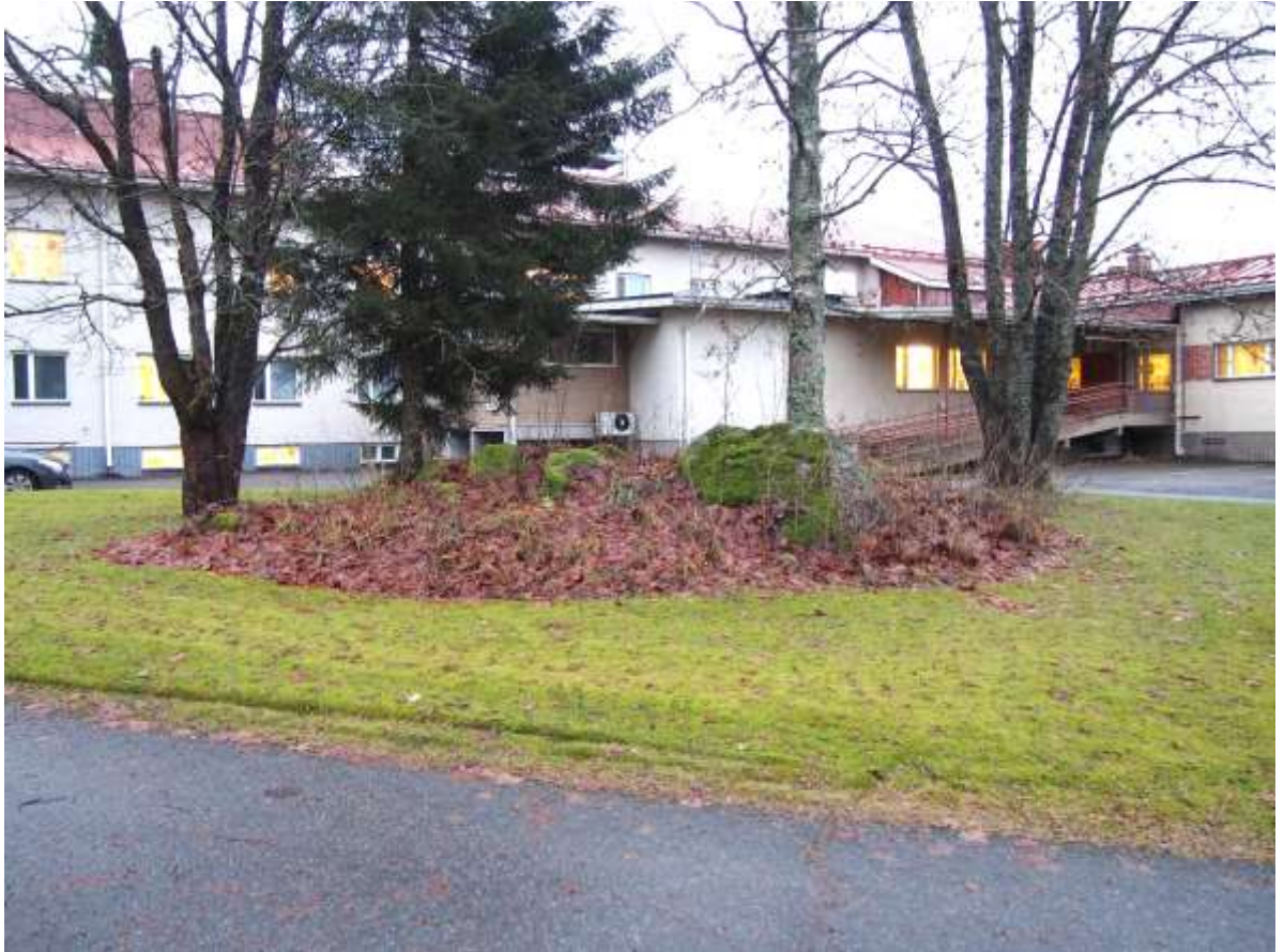
Kuva 5. Kunnalliskodin tutkittu ja ennallistettu röykkiö. Kuvattu luoteesta.

Rautakautinen röykkiö sijaitsee 750 m kaakkoon Urjalan kirkosta, Urjalan kunnalliskodin länsipuolella, pihamaalla. Kohde on tutkittu, entistetty ja merkitty rauhoitustaululla. Keväällä 1953 kunnalliskodin rakennustöiden yhteydessä löytyi rautakautiseen hautaukseen viittaavia esineitä mm. kaksi rautaista keihäänkärkeä, väkipuukko, paimensauvan muotoinen viitanneula sekä kilvenkupura. Esineet voidaan ajoittaa 600 - 700-luvuille jKr. Kohde tutkittiin vuonna 1953. Tuolloin tutkitun röykkiön ympäristö on tasattu pihamaaksi ja teiksi niin, ettei röykkiön vieressä ollut toista tutkittua röykkiötä enää ole. Röykkiöiden läheltä on tuhoutunut myös kunnalliskodin itäpuolinen luontainen kivikko, jossa oli matalahko kiviröykkiö sekä pyöreä kivikehä. Kunnalliskodin röykkiö sijaitsee samassa rinteessä kuin Ali-Uotilan röykkiöt ja ne kuuluvat ilmeisesti samaan kalmistoon.