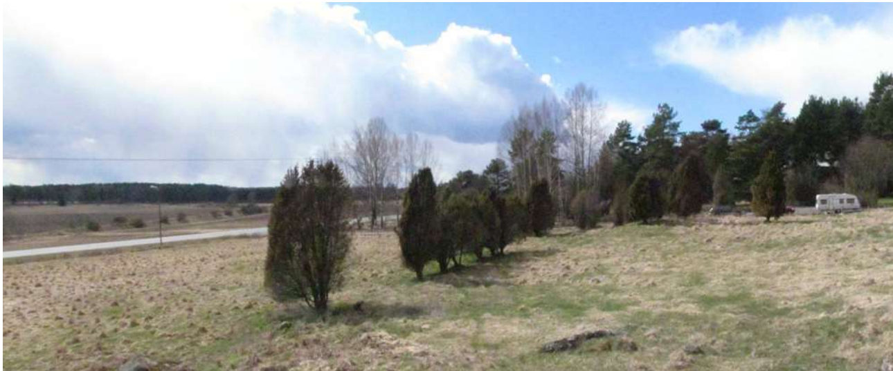
Kuva 3. Ali-Uotilan muinaisjäännösalueutta kuvattuna Kuulaanmäen rökkiön laelta kohti länttä.

Kohde sijaitsee Uralan kirkosta 700 m kaakkoon. Kiven- ja maansekaiset rökkiöt sijaitsevat kuivatun Vanhajärven pohjois-osan harjun etelärinteessä. Ali-Uotilan rökkiöt ovat osa Vanhajärven luoteispäässä sijainnutta rautakautista kalmistoa, joka on ollut noin 300 m pitkä, järven rantaa noudatteleva vyöhyke. Ali-Uotilan rökkiöitä on tutkittu kaivauksin useaan otteeseen: Vuonna 1954 tutkittiin Kuulaanmäellä hautarökkiö 1. Vuonna 1960 Ali-Uotilan haasta löydettiin 21 rökkiötä, joista kolme eteläisintä oli hävitetty tilustietä levennettäessä. Vuonna 1960 tutkittiin tuhotun rökkiön 3. pohja, ja rökkiö entisöitiin. Vuonna 1961 tutkittiin hautarökkiöt 20 ja 21 sekä rökkiö A vuonna 1962 tiehankkeen vuoksi. Rökkiön 21 vierestä löytynyt kuppikivi on siirretty tien pohjoislaitaan. Pylväskatajaa kasvava hautarökkiö 2 on tutkittu lähes kokonaan ja entisöity vuonna 1989. Kalmiston pohjoispuoliselle asuntoalueelle vievän tien linjausta on muutettu niin, että tie tulee lähes suoraan etelästä. Tietä on myös levennetty niin, että se rikkoo lähimpien rökkiöiden reunoja. Kohde Kunnalliskoti (887010015) kuuluu samaan kalmistoon. Kesällä 2017 muinaisjäännösalueella tehtiin maakaapelointihankkeeseen liittyvä koekaivaus, jossa selvitettiin sijaitseeko suunnitellulla linjauksella kiinteää muinaisjäännöstä. Linjauksen itäosasta, nyt valvotulta alueelta löydettiin rautakautisia saviastianpaloja sekoittuneesta kontekstista.