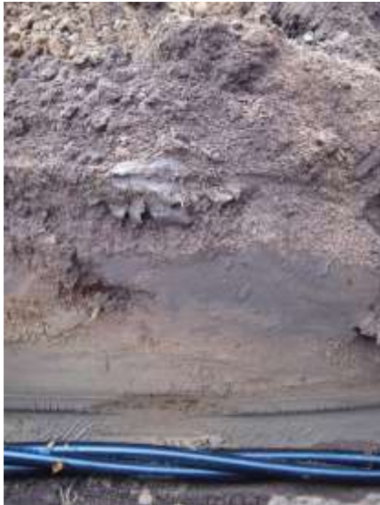
Kuva 12. Kohteen Kunnalliskoti länsipuolella kulkevan ja valvotun maakaapelilinjauksen pohjoisosan hiesumaannos kaapelikaivannon eteläprofiilissa. Kuvattu pohjoisesta.