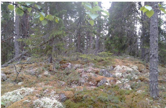
Röykkiö pohjoisesta.

Seinäkallio on nevojen ja kivikkoisten kankaiden ympäröimä kallioalue Kälviällä noin 7,5 km Kälviän kirkosta itä-kaakkoon. Kallion luoteisosassa on kallionkielekkeen eteläreunalla kiviröykkiö. Röykkiön läpimitta on ollut noin 6 metriä, mutta sen eteläosa on tuhoutunut. (noin kolmasosa röykkiöstä). Röykkiötä on aikanaan pengottu ilmeisesti aarten löytämisen toivossa ja sen eteläosasta on vieritetty kiviä kielekkeeltä alas. Kielekkeen alapuolella sammaleen alla on runsaasti samanlaisia kiviä kuin röykkiössäkin. Tästä on kuitenkin kulunut jo aikaa, sillä röykkiö ja siitä poistetut kivetkin ovat nykyään paksun sammalen peitossa.