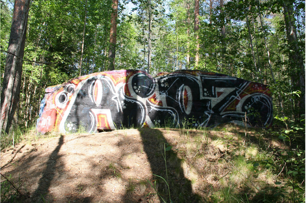
Kellari/korsu oviaukkojen puolelta kuvattuna. Pohjoiseen.