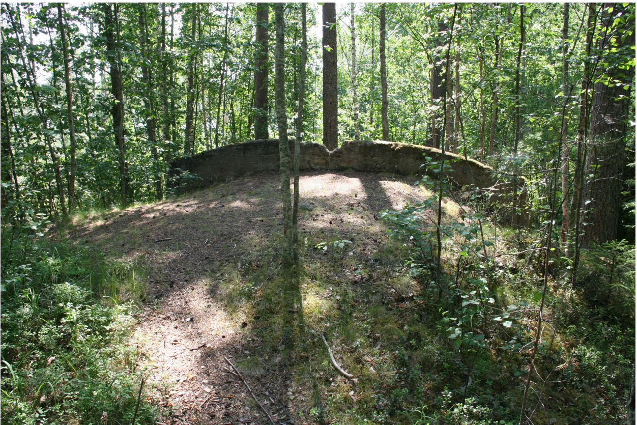
Kellari/korsu ylärinteen puolelta kuvattuna. Etelään.