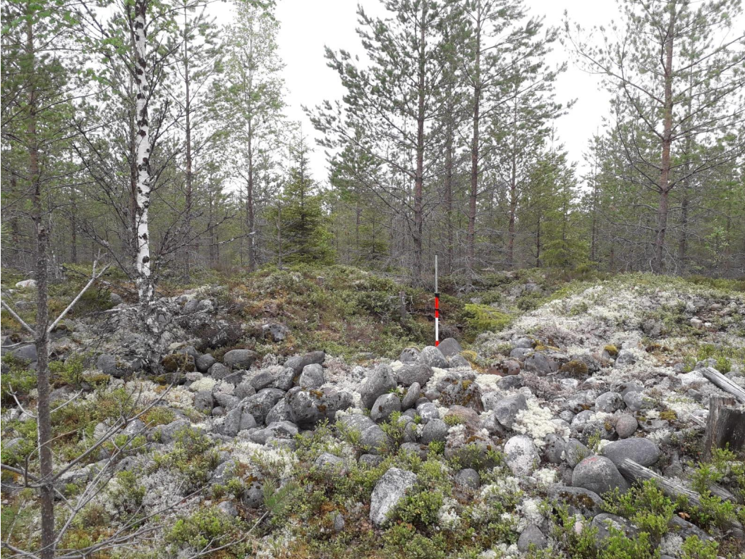
Rakkakuoppa reunavalleineen. Länteen. JR 5.6.2020.

Rantanen, Janne/Seinäjoen museot: SEINÄJOKI (ent. Nurmo) Kirkkomäki. Arkeologinen tarkastus 29.5.2020 ja kartoitus 5.6.2020.