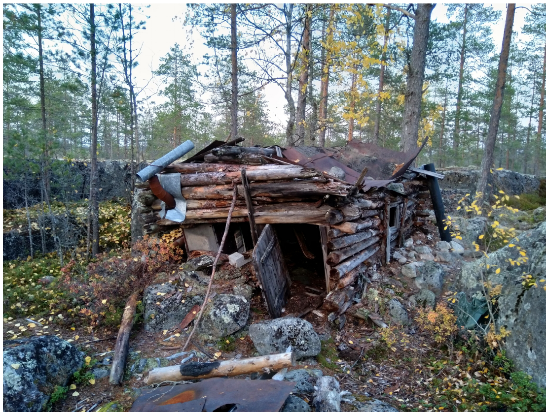
Kuva 1. 1900-luvun metsäsauna, ”piilopirtti”, Kauhavan Åkantbergetin laella.