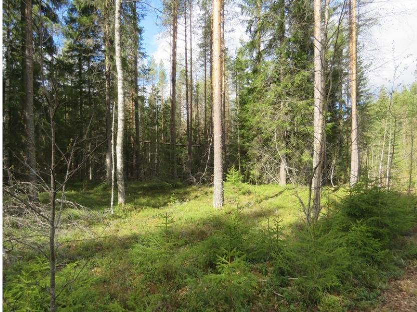
Kuva 1 Uusi voimalapaikka H kuvattu luoteeseen. Tasainen hieman kumpuileva hiekka-alue Perho – Veteli harjujakson lounaispuolella. Varttunutta kasvatusmetsikköä.