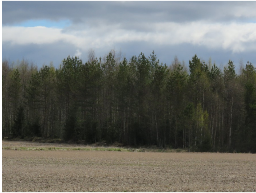
Kuva 3 Uusi voimalapaikka C kuvattu pelloilta kaakkoon. Voimalapaikka sijaitsee tiheässä nuoressa metsikössä Tasainen osittain soistunut kivinen kangas.