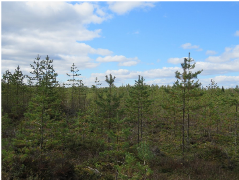
Kuva 2. Uusi voimalapaikka D kuvattu lounaaseen. Tasainen kivinen kuivahko kangas, taimikkoa.