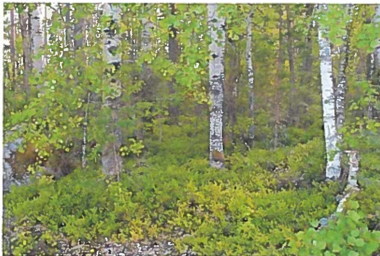
Sysmänniemessä kasvaa sekametsää, josta riittää monipuolista syötävää lampaille.