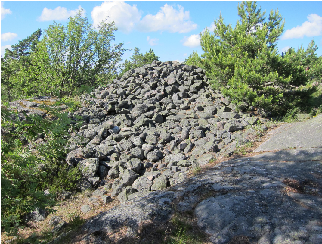
Kuvassa oikealla rökkiössä kasvava nuori mänty. Se kannattaa poistaa esimerkiksi sahaamalla kivikon pinnan myötäisesti, ennen kuin se kasvaa kookkaaksi. Kuvaussuunta koilliseen.

Rökkiön reunoille on ehtinyt kasvaa nuorta pihlajaa, joita voi myös poistaa, jotta ne eivät juurillaan vaurioita kohdetta. Heinän niittoa ja vesakon raivausta tehdään metrin parin säteellä rökkiöstä. Kanervikkoon ja nuoriin katajain ei kajota. Toimenpiteiden avulla kohteen rakenne tulee paremmin esille ja maatuva aine ei kerry lisää. Kohdetta hoidettaessa on huomioitava lintujen pesimärauha.