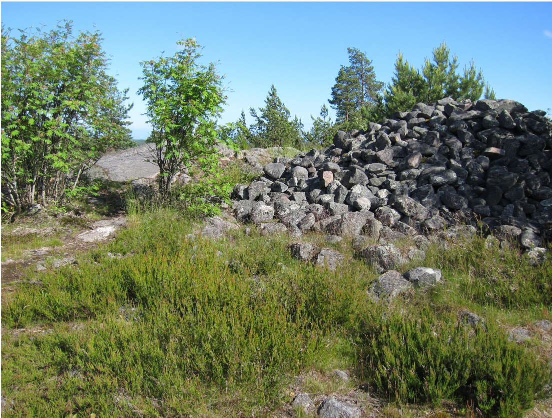
Kuvassa röykkiön pohjoisosa. Kuvassa näkyvät pihlajat, jotka kasvavat röykkiön kivrakenteessa kiinni, kannattaa poistaa. Kuvaussuunta itään.