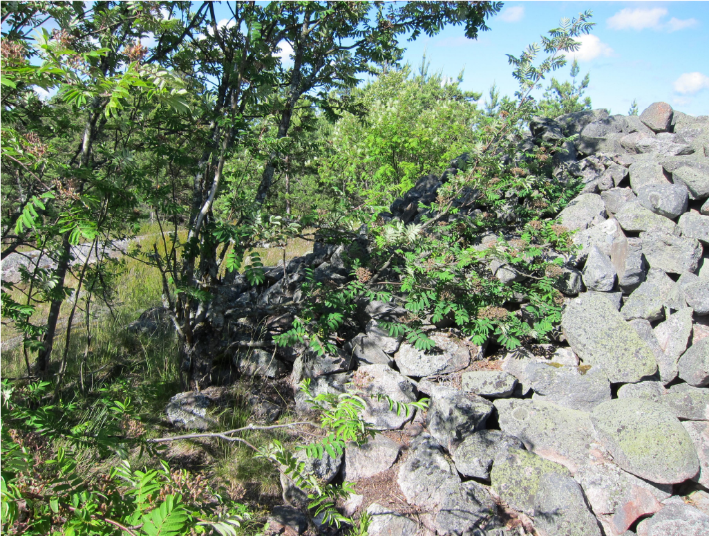
Tässä kuvassa näkyvät lähempää röykkiön kivrakenteen kupeessa kasvavat pihlajot, ne kannattaa poistaa, ennen kuin ne alkavat rikkoa röykkiön rakennetta. Kuvaussuunta pohjoiseen.

Kasvi- ja puujätteen poiskuljetuksen järjestämiseksi on syytä ottaa yhteyttä kaupungin puisto- ja metsäalueista vastaavaan tahoon kaupunkiympäristön toimialalla (Kaupunkiympäristön toimiala – Rakennusvirasto – Katu- ja puisto-osasto – ylläpitotoimisto).