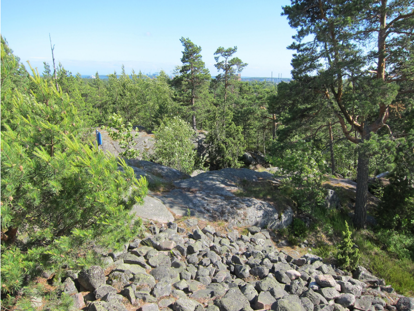
Maisemaa kohteelta etelään, missä horisontissa näkyy mm. Vuosaaren sataman rakenteita.