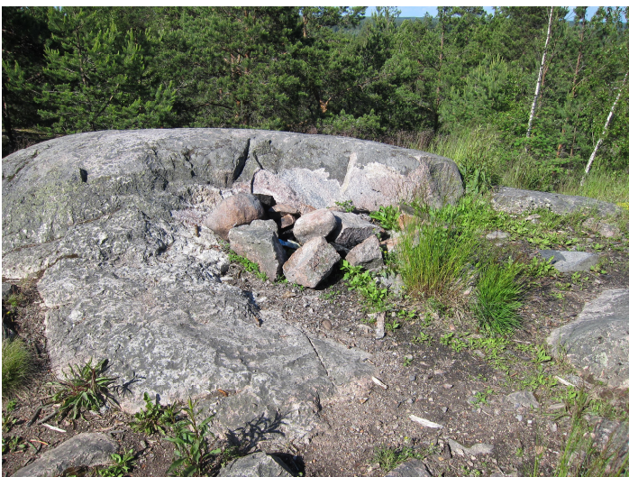
Röykkiön itäpuolella oli nuotien jäännökset ja roskaa. Kivet lienevät peräisin röykkiöstä. Luonnonsuojelualueilla tulenteke on kielletty. Kuvaussuunta itään. 25.6.2017.

Kohteelle on syntynyt luonnollinen polku länsipuolelta Vikkullantieltä. Nousu on melko jyrkkä. Kohteella havaitut roskat ainakin kertovat kohteella vierailuista. Kulutus on arviolta kohtuullista. Käynnillä 2017 havaittiin röykkiön itäpuolella kivirinki, jossa oli poltettu nuotiot. Hienojen maisemien johdosta paikka on varmasti mieluisa retkeilykohde.