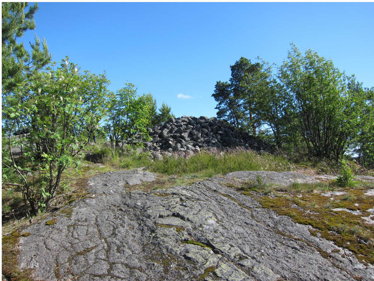
Röykkiö länsi-luoteesta kuvattuna. Kohteen reunamilla kasvaa nuorta pihlajaa ja heinää.

Kesällä 2017 kohde vaikuttaa olevan samassa kunnossa, kuin mitä se on kuvailun perusteella ollut 2000-luvun. Jonkin verran kiviä on alarinteellä kohteen länsipuolella. Kohteen itäpuolella kallio laskee jyrkästi alapuolella olevaan notkelmaan ja tällä puolella on kiviä noin 13 x 5 metrin alueella. Kivet saattavat olla peräisin röykkiöstä.