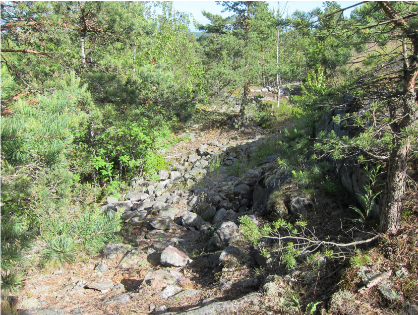
Notkelma röykkiön itäpuolella. Kivet ovat mahdollisesti peräisin röykkiöstä. Kuvaussuunta kaakkoon.