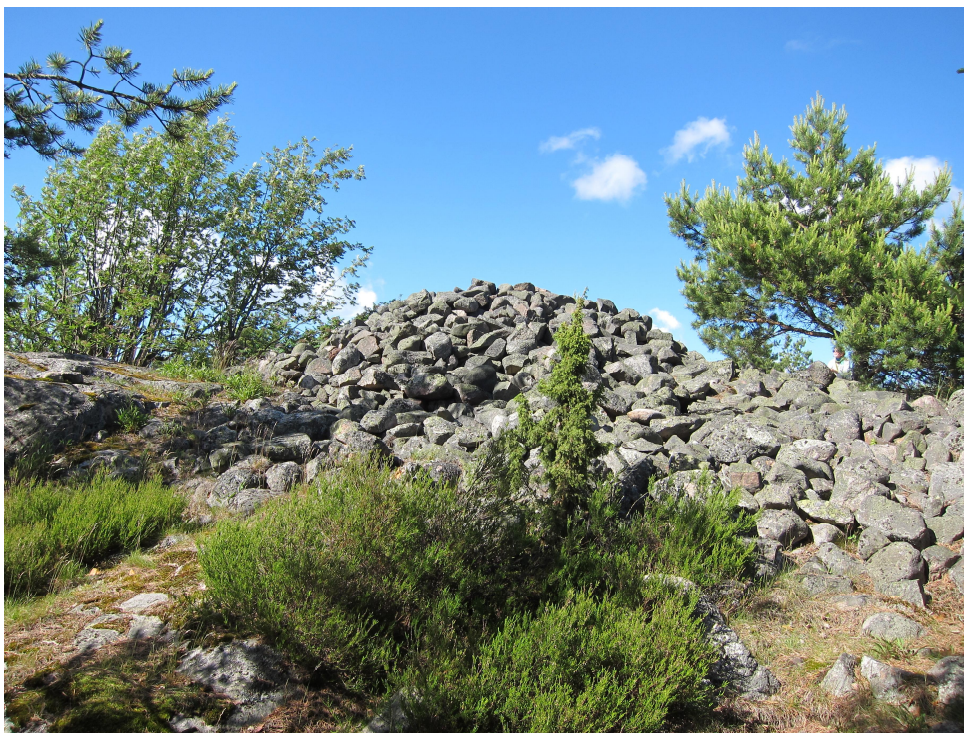
Rökkiön länsilaidalla kasvaa pihlajia, joista ainakin lähimpänä rökkiön kiviä kasvavat puut voisi poistaa. Kuvaussuunta pohjoiseen.

Rökkiön reunoille on ehtinyt kasvaa nuorta pihlajaa, joita voi myös poistaa, jotta ne eivät juurillaan vaurioita kohdetta. Heinän niittoa ja vesakon raivausta tehdään metrin parin säteellä rökkiöstä. Kanervikkoon ja nuoriin katajain ei kajota. Toimenpiteiden avulla kohteen rakenne tulee paremmin esille ja maatuva aine ei kerry lisää. Kohdetta hoidettaessa on huomioitava lintujen pesimärauha.