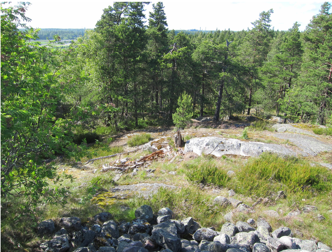
Maisemaa röykkiön länsirinteelle. Hieman kiviä on vierähtänyt rinteeseen ja niitä voi kantaa takaisin röykkiöön. Kuvaussuunta länteen.